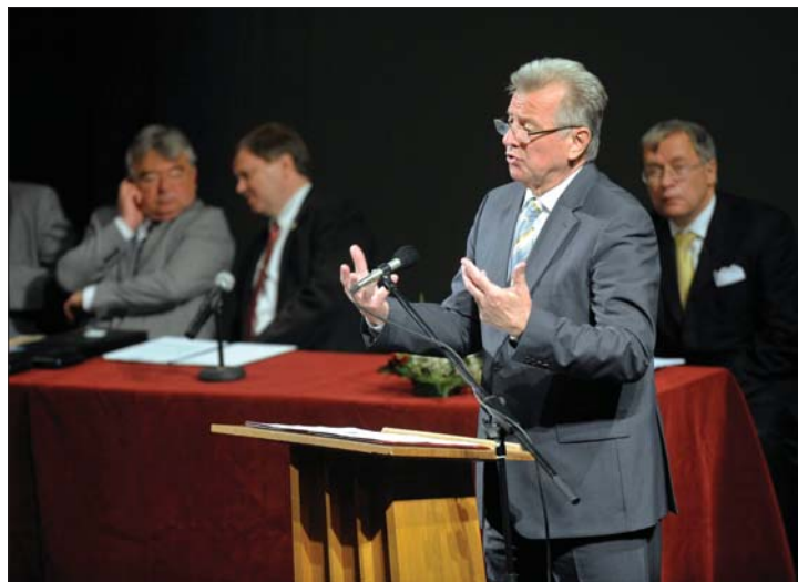
Schmitt Pál nyitotta meg tegnap a Hungarológiai Kongresszust

A rendezvény fővédnökeként megnyitotta tegnap a hetedik hungarológiai kongresszust Kolozsváron a magyar államfő. Schmitt Pál előtte összefogásra szólította fel az erdélyi magyar politikai szervezeteket. 3. és 8. oldal