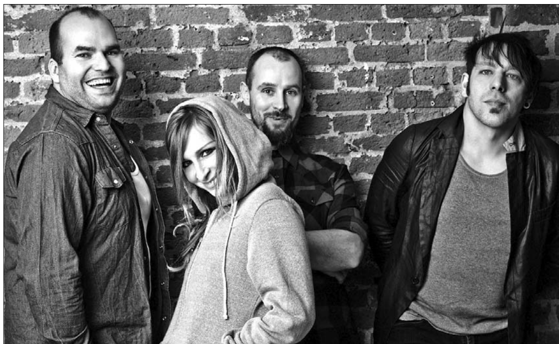
A Guano Apes lesz a csütörtökön kezdődő Tuborg Green Fest Fél-sziget első napjának legnagyobb sztárja

► A Guano Apes nevű göttingeni rocknégyes lesz a csütörtökön kezdődő Tuborg Green Fest Fél-sziget első napjának legnagyobb sztárja. A Maros partján zenélő együttes 96-ban, az Open your eyes című számmal ugratott a zenei listák elejére, és a telt házas koncertek színpadjaira. Kemény riffek funkys témákkal karöltve, kellemes, dallamos ének energikus, kemény üvöltéssel váltva: tökéletes recept a népszerűséghez. A siker következtében a Guano Apes leszerződött a Gun Records lemezkiadóval, melynek nyomán 1997-ben kiadták a Proud Like A God című első nagylemezüket. A lemez támogatására újra megjelen-