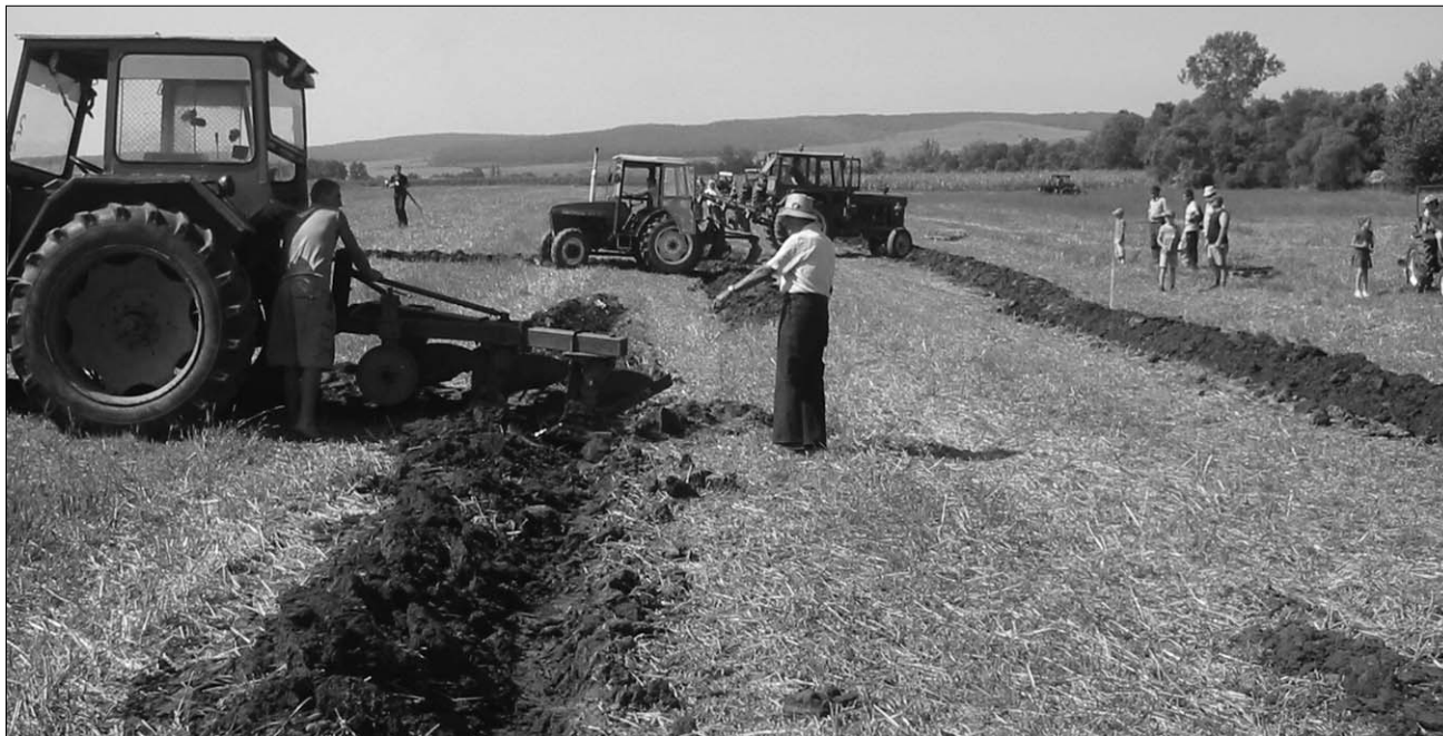
Újragondolt hagyomány. A gépesítés mindinkább jellemző a nyárádszenti gazdákra