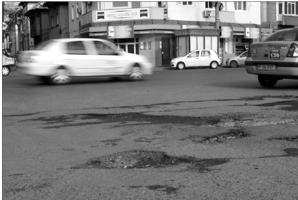
Az útviszonyoknak megfelelő, „kátyuarányos” szigorítást kérnek az autósok

Annak kapcsán, hogy uniós szinten Romániában a legalacsonyabbak a közlekedési kihágásokért kiróható bírságok, Hagiu kifejtette: Romániában a legalacsonyabbak a jövedelmek is, amit szintén szem előtt kell tartani a büntetések összegének megállapításánál.