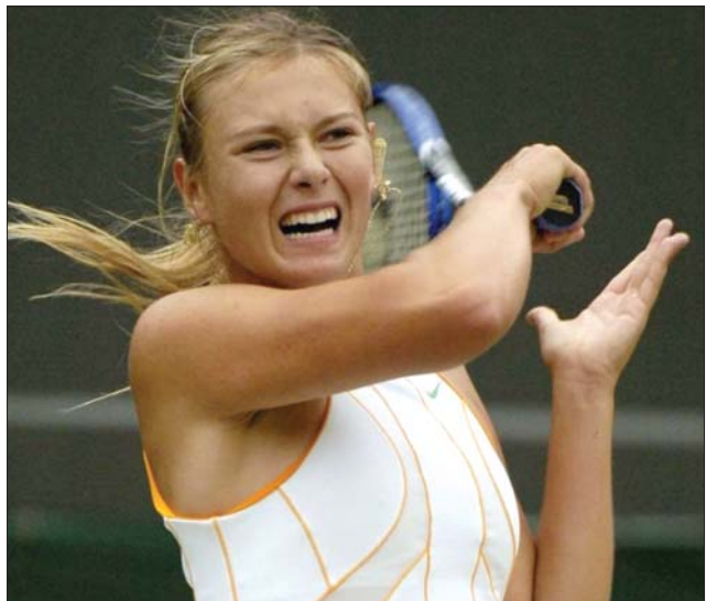
Marija Sarapova bombaformában várja a jövő héten kezdődő US Open

A tornagyőztes Sarapova (6346 pont) a hetedikről feljött a negyedik helyre a női teniszezők legfrissebb, tegnapi kiadott világranglistáján, amelyen már csak a dán Caroline Wozniacki (9335), az orosz Vera Zvonarjova (6820) és a belga Kim