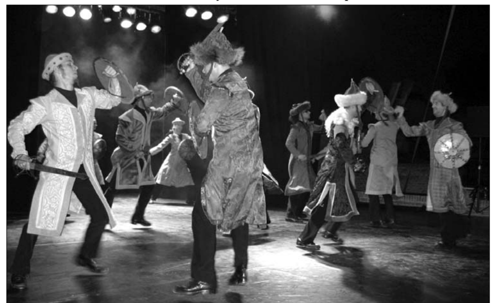
Az ExperiDance az Ezeregyév című táncszínházi koreográfiáját mutatta be