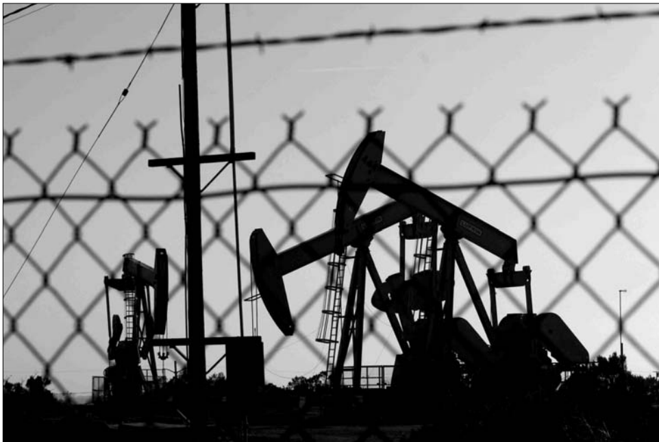
A líbiai nyersanyagexport várható indulása világszerte „olajozottabbá” tette a tőzsdéi kereskedést

A pénzpiacokkal kapcsolatban pozitív tendenciákról számolt be a CNN Money friss felmérése is, amely szerint annak dacára, hogy a vezető New York-i tőzsdemutatók az év eleji szintekhez képest mind a negatív oldalon tartózkodnak – az augusztus elején bekövetkezett pánik miatt – az elemzők bizakodóak a jövőt illetően. Eszerint az S&P-500 index év végéig csaknem 20 százalékkal fog emelkedni – idézte a Világ gazdaság . Bár az elemzők köreiből viszonylagos egyetértés mutatkozik az év utolsó négy hónapjában tapasztalható ralit tekintve, a szakértők tisztában vannak azzal is, hogy egy jóval lassabb növekedési fázishoz érkezünk.