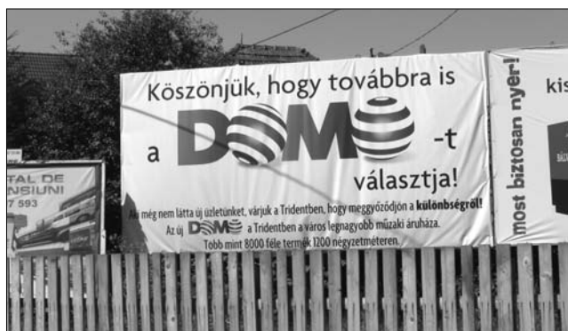
A magyar reklámokat is megregulázná a prefektúra