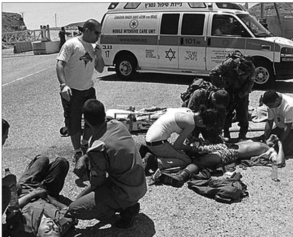
Egy palesztin támadás sebesültjei Izrael déli részén. Nem ritkák a véres események

képviselőjének azon aggodalmát, hogy a Palesztinával kapcsolatos ENSZ-szavazás mélyen megoszthatja az uniót. A 27 tagállam többsége – elsősorban a déli országok, köztük Ciprus, Görögország és Málta – ugyanis kiáll a palesztin kezdeményezés mellett, a kisebbség ugyanakkor Izrael álláspontját osztja. Több ország egyensúlyozik, a magyarokon kívül például a hollandok is ingadoznak. Mint ismeretes, a közelmúltban Bukarestbe látogatott Benjamin Netanjahu izraeli kormányfő és Emil Boc miniszterelnök tárgyalásai után nyilvánvalóvá vált, hogy a palesztinok nem számíthatnak Románia szavazatára sem. A magyar ENSZ-szakértő szerint Budapest álláspontjának a kialakításában fontos szerepe lehet annak, hogy a palesztin kérdéstről szóló döntés időben megelőzi-e a BT-tagsági szavazást. Úgy látja, hogy a palesztin államiság elismerését ellenző izraeli-amerikai álláspont elszigetelődik, és Magyarországon BT-tagságának megszerzésében – ehhez a közgyűlésben a tagállami szavazatok kétharmadára lesz szükség – nagy szerepe lesz az arab országok, valamint a palesztin ügyet támogató más államok csoportjának.