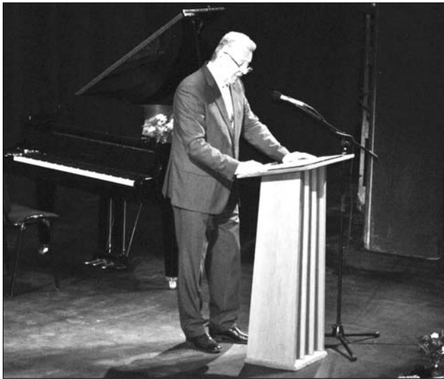
Schmitt Pál nyitotta meg a Hungarológiai Kongresszust

A köztársasági elnök hangsúlyozta, az összmagyarságnak egyre nagyobb szüksége van a kinyíló, globalizálódó