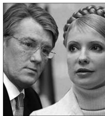
Viktor Juscenko és Julija Timosenko