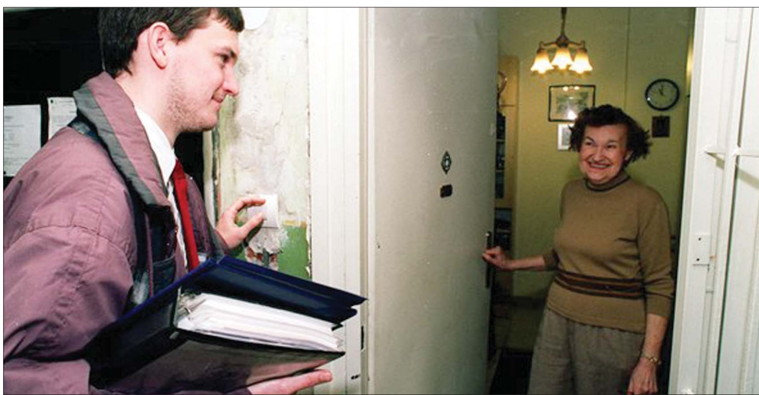
Több erdélyi városban is problémát jelent a megfelelő számú és végzettségű számlálóbiztosok toborzása az október végi cenzusra