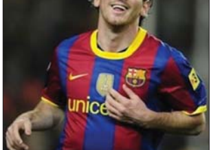
Lionel Messi duplázott

Pénteken a sport.ro 22 órai kezdettel közvetíti élőben a Barcelona örök vetélytársa, a Real Madrid hasonlóan hagyományos mérkőzését a