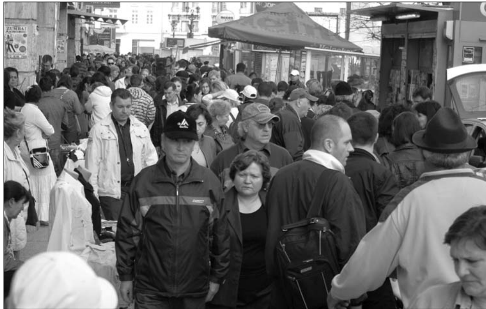
Mindenkit számba vesznek az október 22–31. között zajló népszámláláson