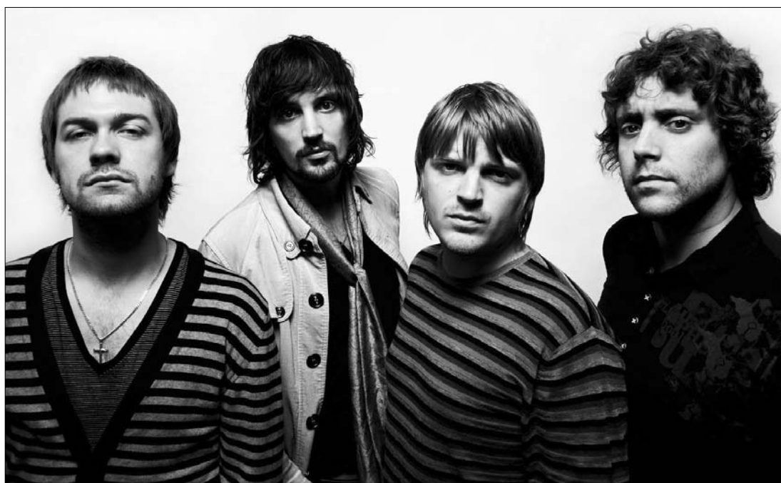
Felejthetetlen koncertet ígér a marosvásárhelyi fél-szigetközöknék a Kasabian, minden idők egyik legjobb brit bandája

Holnap rajtol Románia egyik legnagyobb szabadtéri fesztiválja Marosvásárhelyen, a Tuborg Green Fest Fél-sziget. A zenei esemény kezdetéig bemutatjuk a rendezvény legnagyobb sztárjait.