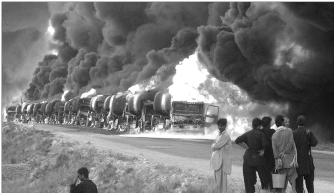
Pakisztánban lángba borult a NATO konvoja. Az afganisztáni utánpótlás ezen az útvonalon zajlik

vesztették – közölték tegnap pakisztáni titkosszolgálati forrásból. Az akciót hétfő éjjel hajtották végre törzsi területen, Észak-Vazirisztánban, a radikális iszlamisták egyik fellegvárában. Egy gépkocsit vettek célba két rakétával a pilóta nélküli repülőgépről, azaz drónról. A halálos áldozatok kiléte ismeretlen. Egy helyi tévécsatorna számításai szerint idén ez volt a pilóta nélküli repülőgépekről végrehajtott 51. támadás Pakisztánban. A csapásmérések – amelyekben eddig összesen nagyjából 800 ember vesztette életét – tovább szítják az egyébként is meglévő Amerika-elleneséget a dél-ázsiai iszlám köztársaságban. ◀