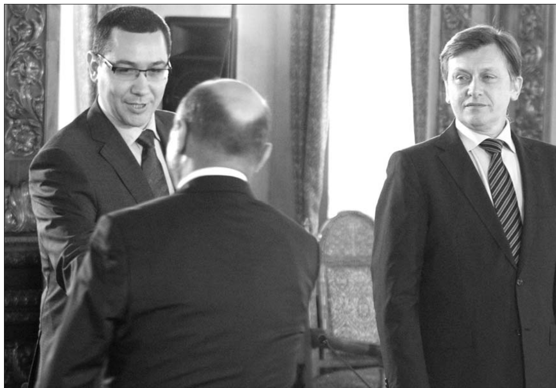
Traian Băsescu (háttal) nem hajlandó elismerni Victor Ponta és Crin Antonescu szövetségét

Az államfő interjúját Adrian Năstase, a PSD országos tanácsának elnöke is kommentálta, szerinte a PDL elszigeteltségében jobbra-balra vagdalkozik. ◀