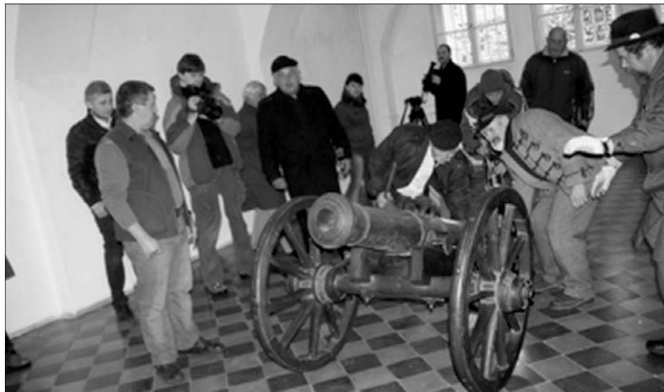
A székelygyörgyiek remélik, dák kincsekért cserébe örökre megkaphatják Gábor Áron ágyúját