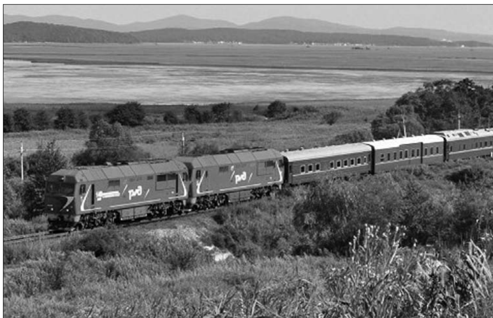
Az észak-koreai diktátor „titokzatos páncélvonata”. Az amerikai Air Force One földi mása

Az oroszok számára különösen Dél-Korea ellátása lehetne nagy üzlet, de földrajzi helyzetük miatt az északiak erős pozícióban vannak, hiszen ők dönthetnek arról, hogy áthaladhat-e területükön a vezeték. Elemzők szerint évi százmillió dollárhoz juthatnának, az előrelépéshez azonban arra is szükség volna, hogy elmozduljon a holtpontról az északiak atomfegyver-programjáról szóló, de két évvel ezelőtt elakadt alkudozás. Mindeközben délen nem felejtik el az északiak fegyveres támadása-