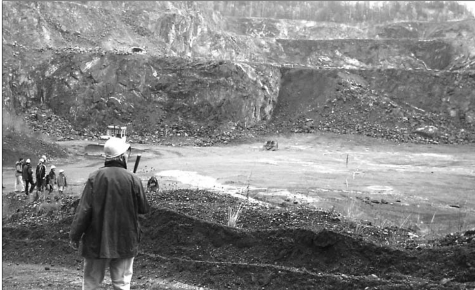
A Verespatakra tervezett aranykitermelést további két bányaprojekt követné Boicán és Felsőcsertésen

Az államfő szerint azért van szükség a verespataki beruházásra, mert az állam így növelhetné a Román Nemzeti Bank nemesfém-tartalékait. „A korábbinál sokkal inkább támogatom a kiter-