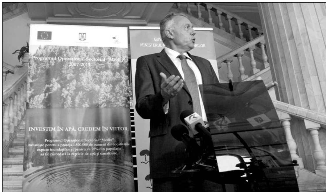
Borbély László miniszter szerint a széndioxid-kibocsátási kvótapiac nem túlságosan dinamikus

Átlagosan tizenhét százalékkal keresnek kevesebbet férfi társaiknál a női alkalmazottak az Európai Unió tagállamaiban – derül ki az európai statisztikai intézet, az Eurostat felméréseiből. (Adevărul) ▶ A legfrissebb felmérések szerint immár nem Iaşi, hanem Temesvár Románia második legnagyobb városa Bukarest után. A bányásági nagyvárosnak 311 ezer lakosa van, kétezerrel több, mint moldovai „vetélytársának”. (Evenimentul zilei) ▶ Nicolae Ceauşescu scorniceşti-i szülőházát csak az utódok engedélyével lehet idegenforgalmi látványossággá értékesíteni. Ezt a diktátor lánya, Zoe Ceauşescu férje, Mircea Oprean jelentette ki, annak kapcsán, hogy Elena Udrea idegenforgalmi miniszter beindítaná a kommunista korszak emlékhelyeit átfogó vörös turisztikai körút nevű projektjét. (Jurnalul naţional) ▶ A gazdasági-pénzügyi válság ellenére immár tíz romániai vásárolt a Ferrari legújabb, 458 Spider jelzésű, lehajtható tetőjű szuperepkocsijából, amelyet hivatalosan még be sem mutattak az országban. (Curentul) ▶ 10-12 milliárd euró közé teszik a mezőgazdasági szakemberek az idei gabonatermés értékét. A búza fele exportra kerül. (Curierul naţional)