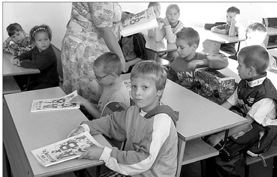
Drágább a magyar tankönyv, háromszor kerülnek többbe a kisebbségi kiadványok