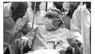
Al-Megrahinak napjai lehetnek hátra

Kómában fekszik líbiai otthonában a Lockerbie-merénylet elkövetéséért elítélt Abdelbaset al-Megrahi, akiről néhány napja még az a hír járta, hogy eltűnt. A súlyos rákbeteg merénylőt napok választják el a haláltól, s az országban uralkodó káosz miatt semmilyen orvosi segítséget nem kap. Megrahit két éve azért engedték el skóciai börtönéből, mert betegsége előrehaladott állapotban volt, ám azóta többször is látják nemzeti ünnepeken pártfogója, Kadhafi elnök oldalán, mintha semmi baja sem volna. A CNN-nek a fiával sikerült kapcsolatba lépnie, aki elmondta: apja haldoklik, és senki sem segíthet rajta. „Nincs telefonvonalunk, így nem kérhetünk orvosi segítséget, csak oxigént tudunk adni neki – mondta a fiú. – A zavargások kitörése után fosztogatók lepték el a házukat, és elvitték apám összes gyógyszerét.” ◀