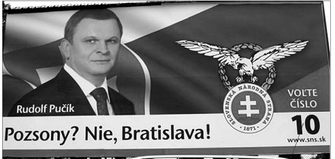
Pozsony? Nem, Bratislava! Egy szélsőséges szlovák párt óriásplakátja a magyar nyelvhasználatot tagadja

Dusan Caplovic, az ellenzéki Irány–Szociáldemokrácia (Smer) alelnöke, volt kisebbségügyi kormányfő-helyettes szerint a 67 éve kitört antifasiszta szlovák nemzeti felkelés Szlovákia belépője volt