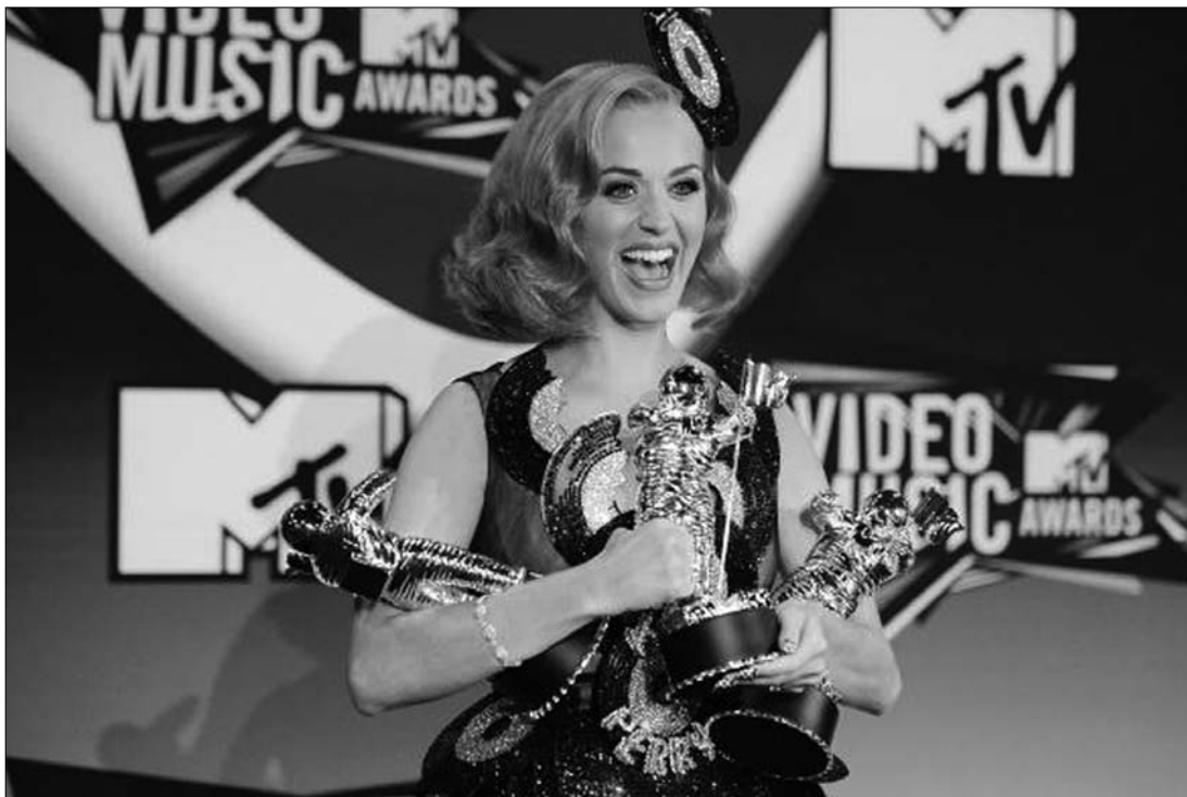
Katy Perry három ezüst asztronautával tért haza az MTV Video Music Awards vasárnapi gálájáról