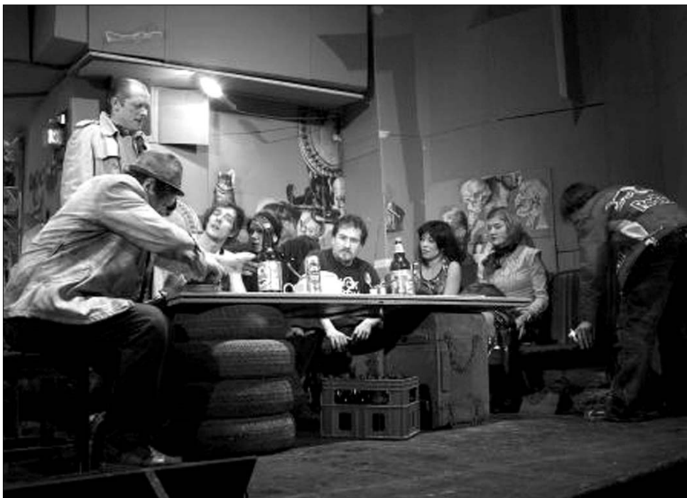
A Csíki Játékszín a Kisvárdán díjazott Finito című darabját is átmenti a most induló új évadba