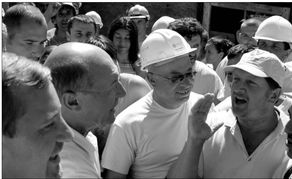
Az államfő váratlanul érkezett Verespatakra, és több órát töltött a Fehér megyei községben

Az államfő szerint felháborító, hogy a román politikusok túl későn hoznak meg fontos döntéseket, Románia