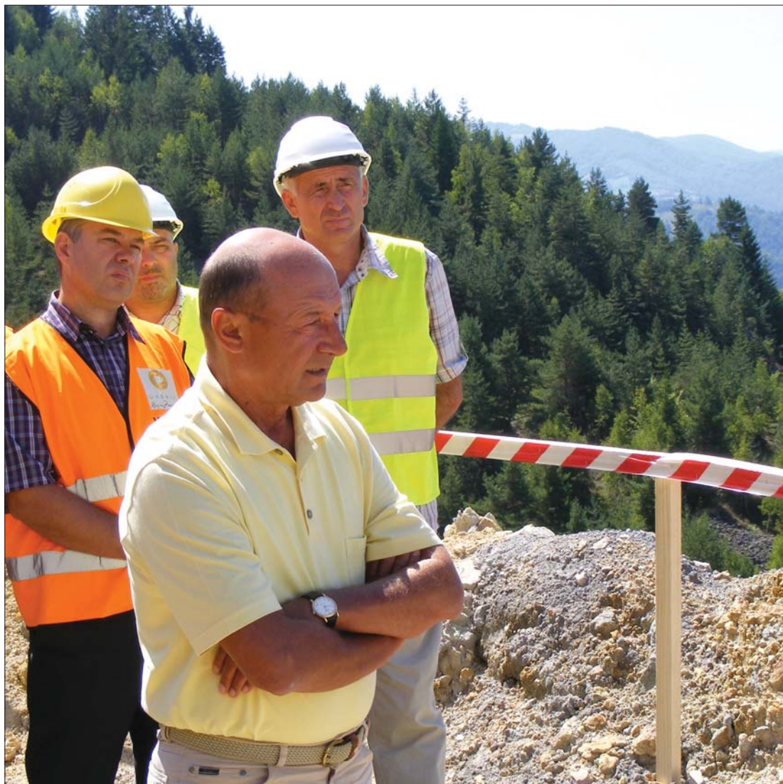
Terepszemlén az államfő. Traian Bănescu rajtaütésszerűen érkezett tegnap az erdélyi településre