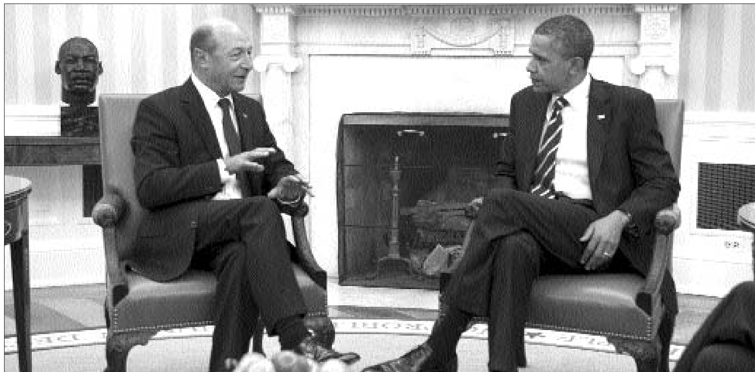
Traian Băsescu román államfő (balra) és Barack Obama amerikai elnök a Fehér Ház Ovalis Irodájában tárgyalt egymással

Annyi bizonyos: a nemzet peremvidékén senki nem várja azt, hogy Magyarországon önmagába roskadjon, hanem azt szeretné, hogy végre-valahára önmagára találjon, szűnjön meg a mindennapi háborús hangulat és legyen béke. A harci kiáltások helyét vegye át az a gazdaság- és társadalomszervezés, amely képes jólétre, megbízható jövőt biztosítani a polgárainak, mert egy nemzet nagyságának ez az igazi ismérve. Ha úgy tetszik, a hitele. Amit nem kell visszafizetni sem forintban, sem valutában.