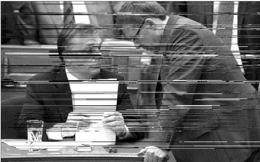
Orbán Viktor és gazdasági minisztere, Matolcsy György. Tegnap tovább zuhant a forint árfolyama

Ausztria megvizsgálja, hogy mennyiben jogszerű a devizahitelek rögzített árfolyamon való előtörlesztéséről szóló magyar kormányzati javaslat – jelentette ki tegnap az osztrák kancellár. Werner Faymann az osztrák kormány szokásos heti ülése után közölte: ő és Michael Spindelegger alkancellár számos beszélgetést folytattak a magyar féllel az osztrák bankoknak a tervet érintő aggodalmairól. ◀