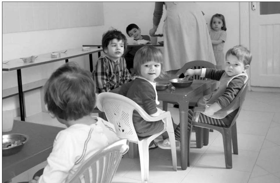
Csak azoknak a gyerekeknek jut bölcsődei ellátás, akik évek óta várólistán vannak

Az utóbbi hetekben tapasztalható szárazság miatt egyre több az erdőtüz, a napokban a Bucegi hegységben lobbantak fel a lángok. Az országos tűzoltó-parancsnokság figyelmeztetése szerint a katasztrófákat legtöbbször emberi hanyagság okozza: rendkívüli károkat okoznak a tarlóégetők, valamint azok a turisták, akik felelőtlenül gyűjtanak tüzet a szabadban. Vrancea megyében egyetlen hónap alatt 48 erdőtüzhoz riasztották a tűzoltókat és a katasztrófavédelem embereit. A kárbeccslés jelenleg is folyik.