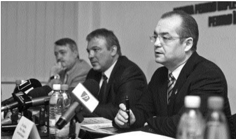
GDP-arányosan Románia költ a legtöbbet befektetésekre – hangsúlyozta Emil Boc a program indulásakor

A hivatalos programnyitón jelen levő Emil Boc miniszterelnök hangsúlyozta, hogy Románia jelenleg első helyen van az Európai Uni-