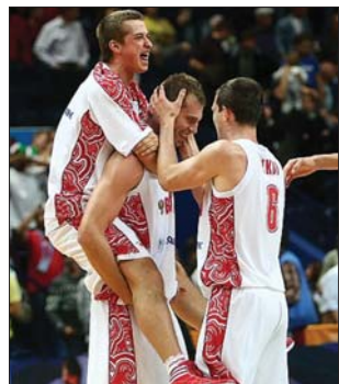
Monyjat ünneplik társai

▶ Hétfőn este zárult a második csoportkör a Litvániaiban zajló 37. férfi kosárlabda-Európa-bajnokságon. Az F csoport legfontosabb összecsapásán a szlovénok 67-60-ra verték a finnek, s így ők jutottak a legjobb nyolc közé. Tét nélküli mérkőzésen a görögök 73-60-ra verték a grúzok, de így sem tudtak előrébb lépni a harmadik helynél. Az orosz-macedón párharc a csoportlétéről döntött – előbbiekre javára. A végig szoros, ádáz küzdelemben az exjugoszlávok az utolsó másodperccig vezettek (61-60), de Szergej