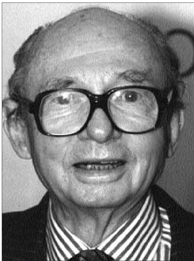
Felix Habsburg, aki soha nem mondott le az osztrák trónról

Életkora miatt Felix nem élvezhette a császárság-királyság előnyeit, annál inkább a hátrányait. Miután meglátta a napvilágot, 1916. június 8-án az osztrák-magyar trónörökös, Károly és Zita Bourbon-pármai hercegnő gyermekét a schönbrunni palotában másodnagybátyja, I. Ferenc József császár és király jelenlétében megkeresztelték (keresztapja Szászországi III. Frigyes Ágost király volt, nagyanyja, Szászországi Mária Jozefa hercegnő fivére). Az osztrák-magyar uralkodó azonban még azon év novemberének 21. napján elhunyt, így Felix apja lépett a trónra, császárként I., királyként IV. Károly néven. Károlyt 2004-