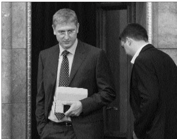
A volt kormányfő a Parlamentben. Hivatali visszaéléssel gyanúsítják

Gyurcsány Ferenc mentelmi jogának felfüggesztését az