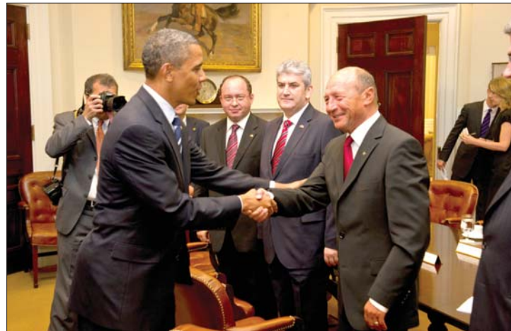
Rakétapajzsot érő kézfogás: Traian Bănescu találkozott Barack Obamával

▶ Soron kívül fogadta tegnap az Ovális Irodában Traian Bănescu román államfőt Barack Obama amerikai elnök, akinek a Fehér Ház honlapján közzétett hivatalos programjában nem szerepelt találkozó a bukaresti vendéggel. Az elnöki delegáció washingtoni tartózkodása alatt aláírták az amerikai rakétapajzs romániai elemeinek telepítéséről szóló szerződést is. 3. és 4. oldal ▶