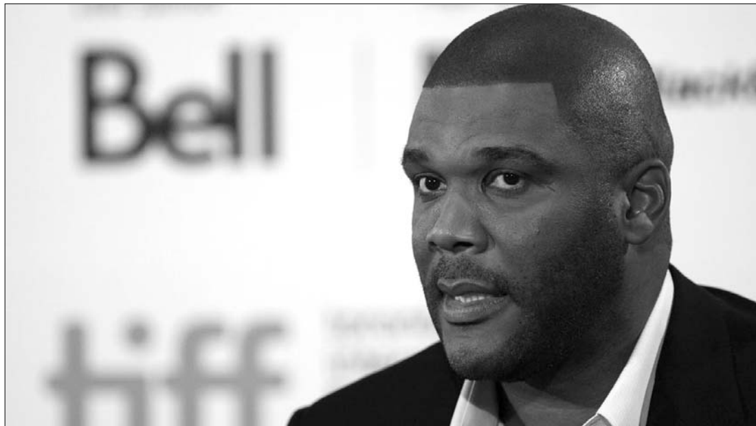
Tyler Perry színész-rendező-forgatókönyvíró a Forbes szerint a szórakoztatóipar legjobban kereső sztárja

Tyler Perry vezeti a Forbes című gazdasági lap számításai szerint a szórakoztatóipar legjobban kereső sztárjainak listáját. A House of Payne és a Meet the Browns című sorozatok írója, rendezője és színésze 2010–2011 között 130 millió dollárt keresett. A második helyet A Karib-tenger kalózái producere, Jerry Bruckheimer foglalja el, 113 millióval. Steven Spielberg rendező-producer a harmadik helyre szorult 107 millió dollárral. Elton John legutóbbi turnéjával 204 millió dollárt hozott össze, ő maga 100 millió dollárt keresett, így éppen csak megelőzi Simon Cowell, az American Idol beszélőairől ismert zsűritagját, az X-faktor kitalálóját, aki 90 millió dollárt keresett. A lista egy érdekes szereplője James Patterson, aki csak az elmúlt évben közel húsz sikerkönyvet írt. A hetedik helyen Oprah Winfrey kedvence, Dr. Phil áll 70 millióval. Leonardo DiCaprio az egyetlen színész a listán, a Viharsziget ben és az