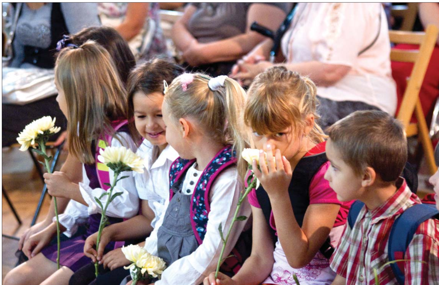
Az oktatási-nevelési támogatás kedvezményezettjei a romániai magyar kisiskolások is: szüleik még nem tudják, mikor jutnak hozzá a pénzhez.

Budapest szerint már elkezdtek az oktatási-nevelési támogatások folyósítását