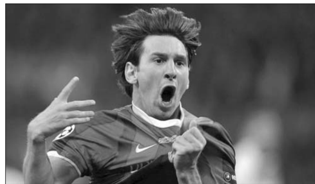
Lionel Messi triplázott a pamploniaiak ellen

Három gól is kevésnek bizonyult a pontszerzéshez az Arsenalnak: az angol Premier League 5. fordulójában az Ágyúok 4-3-ra kaptak ki a Blackburn Rovers vendégeiként. További eredmények: Aston Villa-Newcastle United 1-1, Bolton Wanderers-Norwich City 1-2, Everton-Wigan Athletic 3-1, Swansea City-West Bromwich Albion 3-0, Wolverhampton-Queens Park Rangers 0-3. Tegnap: Tottenham-Liverpool FC 4-0, Fulham FC-Manchester City 2-2, Sunderland-Stoke City 4-0. A Manchester Uni-