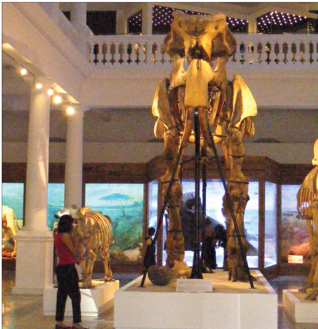
A felújított Antipa-múzeumban kiállított kapafogú őselefántcsontváz egyedüli a világon

intézményt megnyitották a látogatók előtt. Az Európai természettudományi intézetek rangsorában az ötödik helyen álló fővárosi múzeum látványos fény- és hangtechnikába „csomagolva” mutatja be a látogatóknak az ország legjellemzőbb növény- és állatvilágát, a Duna-delta és a Fekete-tenger vízi világától a hegyvidékig. Kelemen Hunor kulturális miniszter a múzeum felújítása kapcsán az ÚMSZ-nek kijelentette: „a kulturális befektetéseket válságban is folytatni kell, ugyanis az nemzeti érdek.” 8. oldal ▶