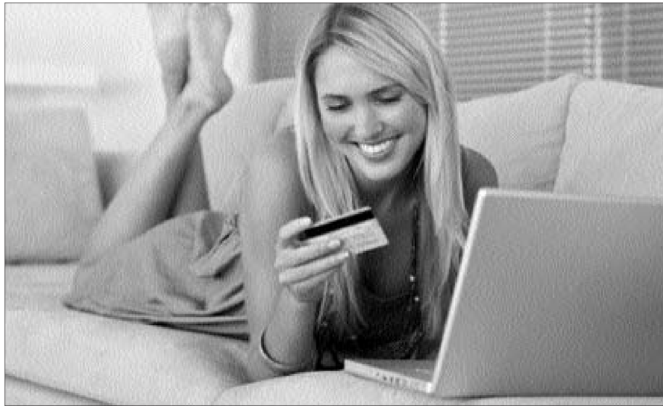
Vásárlóleszen. Bár nem olcsó mulatság, a cégeknek megtérül profi internetes jelenlétre áldozni

A Marketingiskola.ro által a romániai magyar kis- és közepes vállalkozások körében végzett felmérés azt mutatja, a cégeknek csupán negyede élt tavaly az online reklám lehetőségével, ennek arányát azonban 50 százalékban kívánták növelni az idei év folyamán. A cégvezetőknek ugyanakkor 40 százaléka szívesen venne több gyakorlati segítséget e téren – sokkal nagyobb arányban, mint más marketingeszköz esetében.