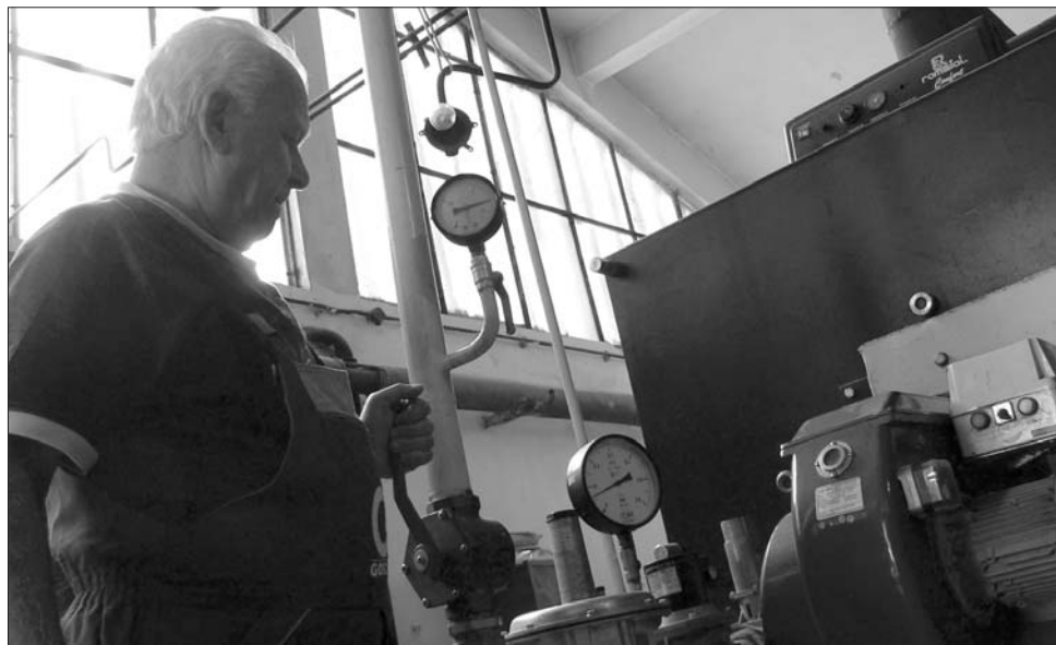
A hőenergiát előállító vállalatok többé nem kapnak állami támogatást

A marosvásárhelyi önkormányzat nem hallgatott a kormányfő biztatására, s úgy döntött, a továbbiakban is szubvenciót nyújt a helyi távhőszolgáltatóknak. A vállalat szóvivője megerősítette, az önkormányzattól ígéretet