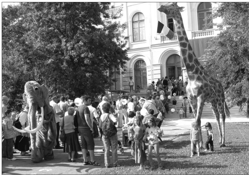
Szombaton már a délelőtti órákban több százan álltak sorba a fővárosi Antipa-múzeum előtt.

Azok viszont, akik bejutottak a vitrinek közé, már örültek a jegyautomata meghibásodásának. „Fantasztikus. Nincs tömeg, nem siettet senki. Mintha nem is Romániában lennék. S ez a látvány, ez a hangzás minden pénzt megér” – lelkesedett egy fiatal nő, aki a múzeum legfiatalabb látogatójának számító öt éves kisbabájával érkezett a megnyitóra. A látogatókat valóban korszerű kiállítás fogadta, amely bemutatja az ország legjellegzetesebb növény- és állatvilágát, a Duna-delta és Fekete-tenger vízvilágától a hegyvidéki ritka ásványokat, őskorszaki csontokat és lenyoma-