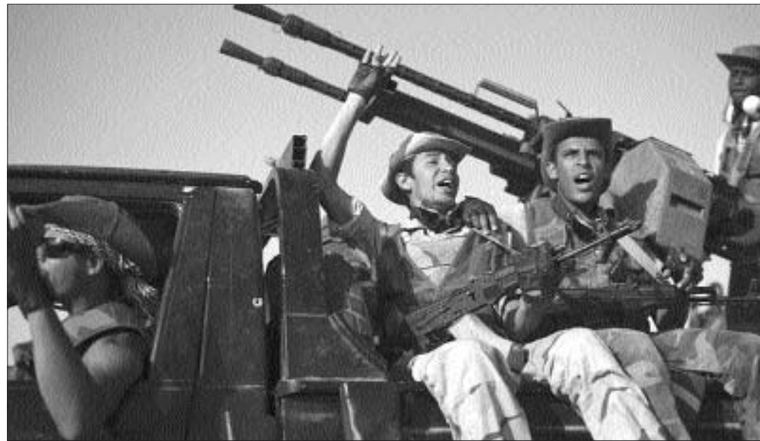
A diktátorhoz hű csapatok még több líbiai települést az ellenőrzésük alatt tartanak

Közben a felkelők birtokába került a Kadhafi-rezsim által felhalmozott vegyi fegyverek egy része. A mustárgázt Tripolitól 600 kilométerrel délre őrzik egy vegyi üzemben. ◀