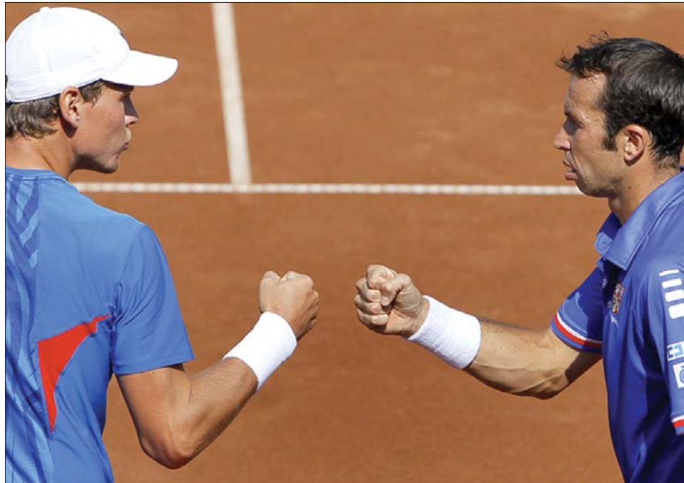
Kemény csehek. Berdych és Stepanek becsületpontot sem engedélyezett a házigazda románoknak

A spanyol után a címvédő szerbeket búcsúztató argentin válogatott jutott be másodikként a fináléba. Belgrádban a tegnapi első egyes során a dél-amerikaiakat erősítő Juan Martín del Potro legyőzte a világszámú Novak Djokovicot (7-6, 3-0), miután a szerb sztár bokasérülés miatt feladta. Ezzel a vendégek 3-1-es, behozhatatlan előnyhöz jutottak. Korábbi eredmények: Viktor Troicki-David Nalbandian 4-6, 6-4, 2-6, 3-6, Janko Tipsarevic-del Potro 5-7, 3-6, 4-6, Troicki, Nenad Zimonjics-Juan Ignacio Chela, Juan Monaco 7-6 (4), 6-4, 6-2. Tegnap: Tipsarevic-Monaco 6-2 (visszalépés), és ezzel a végeredmény 2-3. A finálét december 2. és 4. között rendezik Spanyolországban. ◀