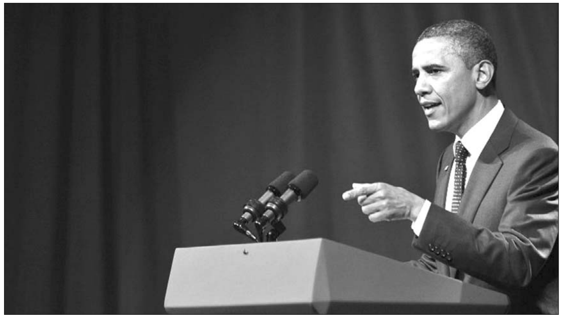
Barack Obama szerint az egész világ számára ijesztő fejlemény az euróövezet válsága

Nem sokan merik kimondani – és Obama sem mondta ki –