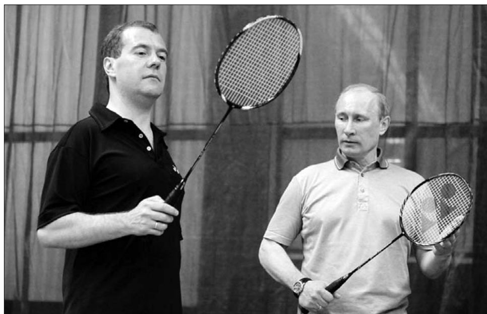
Vladimir Putyin és Dmitrij Medvegyev. Az arcukon látszik, hogy a tét több, mint egy teniszgyőzelem

„Mi tagadás, ez elég ócska színjáték volt. Medvegyev, pillanatnyilag még elnök, de 2012 tavaszától megint miniszterelnök, amiképp Putyin korábbi elnöksége idején is volt, később őszintén elis-