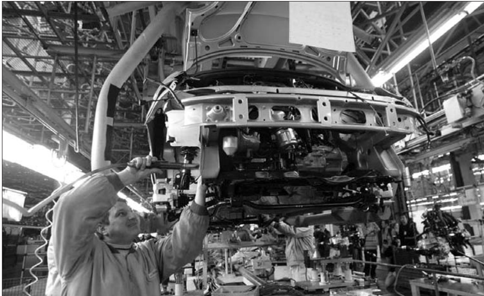
Kiemelt helyzetben. Az autógyártásban könyvelték el idén a legnagyobb arányú bérnövekedést

„Az adatok azt bizonyítják, hogy a hazai cégek többsége átesett azon a recesszióra jellemző tüzeti szemléleten, hogy pusztán a túlélésre és anyagi javak konzerválására összpontosítson. Így visszatért egy óvatosságot jellemző – magyarázta Peter de Ruijter, a PwC Románia pénzügyi tanácsadóval foglalkozó részlegének vezetője. Hozzátette: az idei béremelések mozgása szoros összefüggésben áll majd az infláció alakulá-