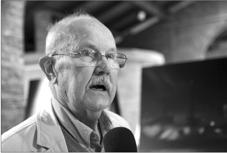
Makovecz Imre nemzetközi híru építész 76 éves korában hunyt el

Első, már a saját stílusát hordozó épülete a berhidai étterem volt, 1964-ben. Erdélyben is több épületet tervezett, többek között Temesváron, Csíkszeredában, Vargyason, Sepsiszentgyörgyön, Kolozsváron építettek az ő tervei alapján templomokat, illetve egy ravatalozót. Százánál több különböző funkciójú, jellegzetes épületet alkotott. A fát nem díszítőelemként, hanem szerkezetként