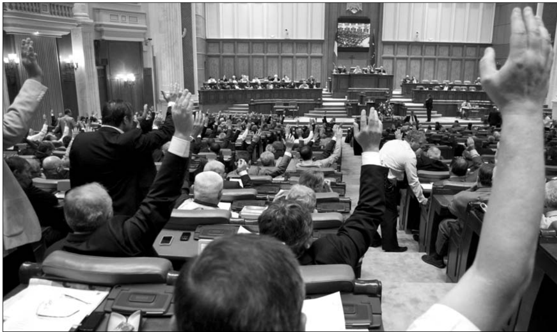
A képviselők és szenátorok sorra megszavazták a kormánypártok jelöltjeit az alárendelt intézményekbe.

Az új ombudsman a nép ügyvédje intézménye eddigi vezetője, Ion Morariu helyettese volt, emellett két egyetemen jogot tanít. Korábbi sajtócikkek szerint Iancu azzal vádolták meg a diákjai, hogy kenőpénzeket kért az elnéző vizsgáztatásért. ◀