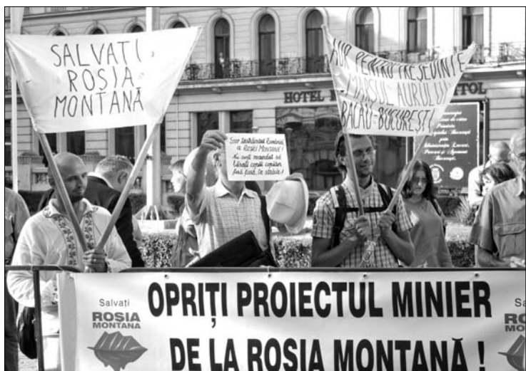
Bukarestben ért véget a moldovaiak aranygyűjtő zarándoklata

A román királyi család mintegy kétszáz személyes tárgyát, karórákat, kintüntetéseket, okleveleket, festményeket bocsátanak árverésre Bukarestben. (Adevărul) ► A Nemzetközi Valutaalap számításai szerint Románia évi 50 millió eurót veszít csak amiatt, hogy nincsen Brassó Bukaresttel összekötő autópálya. (România liberă) ► A kedvező időjárásnak köszönhetően idén, hosszú idő után először valósággal megszállták a turisták, jobbra a sporthorgászok a Duna-deltát. (România liberă) ► Míg évekkal ezelőtt tartályszámra lopták munkahelyükről az üzemanyagot a fővárosi közszállítási vállalat dolgozói, ma kisebb műanyag palackokban csempészik ki. (Evenimentul Zilei)