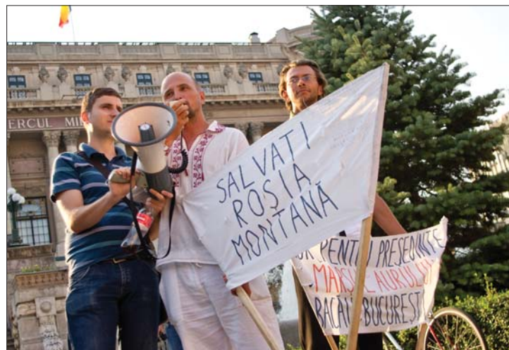
A verespataki bányatervezet ellen tüntettek tegnap Bukarestben.

vevőjét, akik szeptember 19-én indultak el gyalog Bákóból, hogy a 300 kilométeres út során felhívják a figyelmet a verespataki bányatervezet negatívumaira. 3. oldal ▶