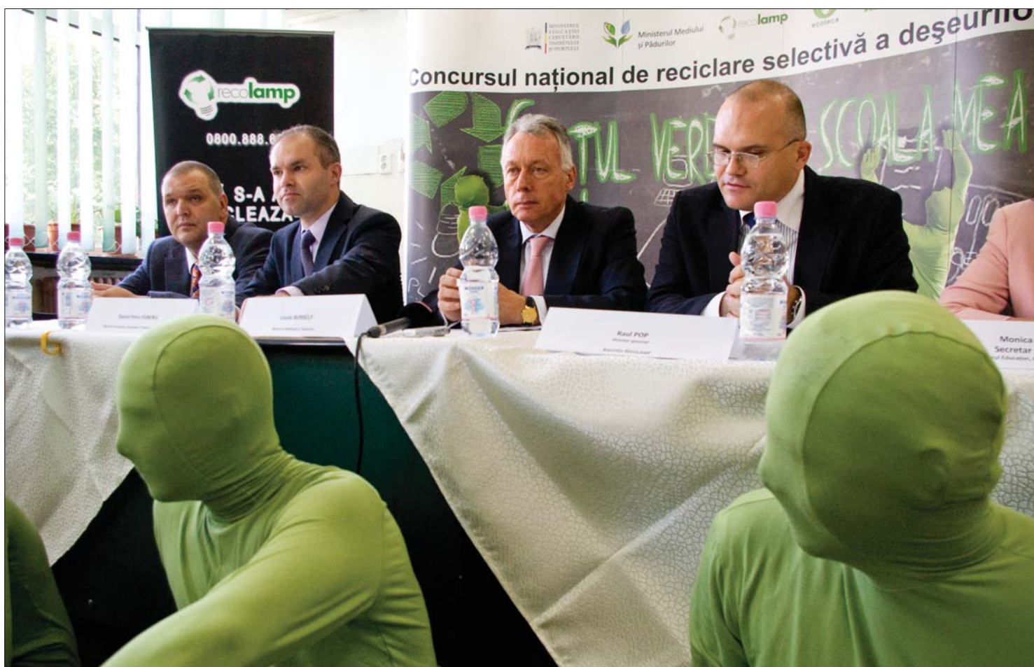
A zöld emberkék már sok helyre elkísérték Borbély László minisztert, aki a tegnapi bemutatón az ökoegyesület kabalfiguráival jelent meg.

Új iskolai öko-barát programot indított el a környezetvédelmi minisztérium