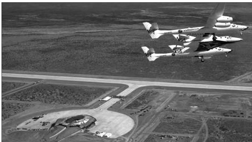
Várja az űrturistákat az első kereskedelmi célú űrrepülőtér. Határ: a csillagos ég – árban is

A SpaceShipTwo névre keresztelt űrhajó a két pilóta mellett hat utas szállítására alkalmas. A tavaly október elején megtartott próbarepülés volt az első, amikor a 18 méteres űrhajó levált hordozó-repülőgépről, és önállóan végzett siklórepülést. A tesztelek során számos további önálló próbarepülés következett, és mert ezek rendben le-