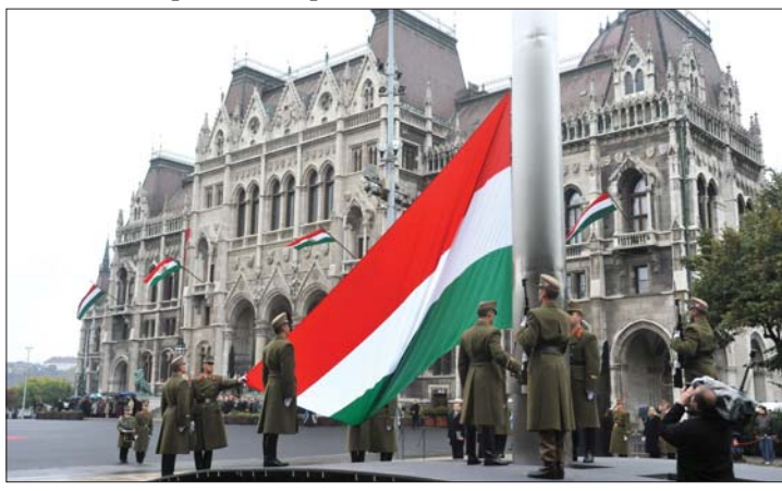
Budapesti megemlékezés: lobogófelvonás a Kossuth Lajos téren

külön köszöntötték az évfordulót, központi ünnepséget nem rendeztek. Több ezren vettek részt az Egymillióan a sajtószabadságért elnevezésű Facebook-csoport tüntetésén. 2. és 8. oldal ▶