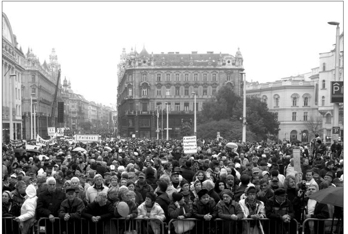
A központi ünnepség elmaradt, helyette spontán tüntetést tartottak. A sajtószabadság kivívása is 56 célja volt.

Budapesten és az ország számos nagyvárosában tartottak