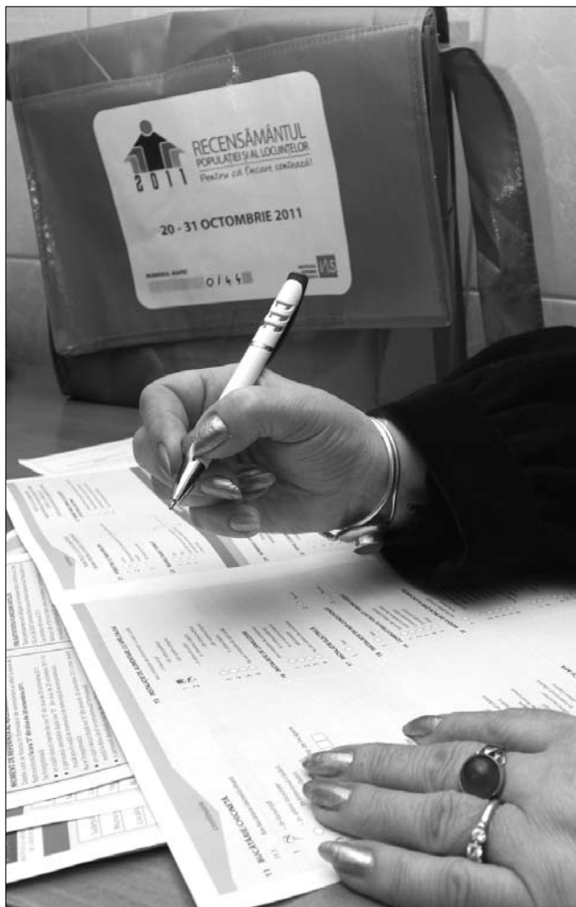
A panaszosok szerint túl sok a visszaélés az idei népszámláláson

A személyi számot nem kötelező bediktálni a kérdezőbiztosoknak, az adatkiszolgáltatásának megtagadása miatt pedig nem rónak ki büntetést – nyilatkozta a hétvégén Vladimír Alexandrescu, az Országos Statisztikai Hivatal szóvivője. Georgică Severin szociáldemokrata képviselő vetette fel a hét végén, hogy a személyi számok rögzítése lehetőséget nyújt a választási csalások előkészítésére, erre a vádra reagált a statisztikai intézet a szóvivő állásfoglalásával. Alexandrescu az adatrögzítés menetével kapcsolatban elmondta, hogy a lakosság többsége együttműködik a kérdezőbiztosokkal, bár gyakori, hogy a kérdezőbiztos az előzetes egyeztetések ellenére sem találja otthon az adatközlőket. „Ebben az esetben annyiszor kell visszatérni az érintett háztartáshoz, ameddig az adatszolgáltatás meg nem történik” – emlékeztetett a szóvivő, aki hozzátette, az információk visszatartása miatt még nem bírságotlalt meg senkit. Elvileg 4500 lejig büntethető az, aki nem nyilatkozik a számlálóbiztos által feltett kérdésekre, Vladimír Alexandrescu szerint azonban ez a lehetőség csupán „elrettentésként” szolgál, és csak a „legvégső esetben” bírságotlalt meg. ◀