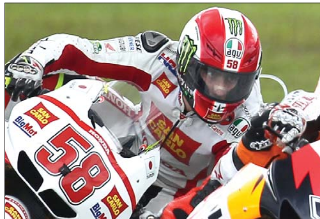
Marco Simoncelli néhány perccel a végzetes baleset előtt