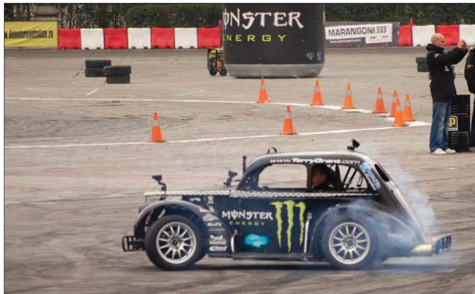
A bukaresti Drift Grand Prix-n a profi versenyzők mellett autóépítők is drifteltek

Marco Simoncelli 24 éves volt, 2008-ban megnyerte a 250-es világbajnokságot, tavaly óta ment a GP-ben. Magas termete ellenére igen tehetségesnek tartották, idén kétszer már pole pozíciót szerzett, Brnóban dobogóra állhatott, egy hete Ausztráliában érte el legjobb eredményét a kategóriában, második lett. 250-ben 12, 125-ben két GP-t nyert, összesen 31-szer végzett az első háromban. 2009-ben indult két Superbike-futamon is, az egyik harmadik lett. Agresszív stílusa miatt sokat esett, több társa nem igazán kedvelte, utközött Dani Pedrosával és Jorge Lorenzóval, Casey Stonerrel is akadt nézeteltérése, Andrea Doviziosoval különösen rossz viszony volt. Egy pilóta volt igazán a barátja, épp Valentino Rossi. ◀