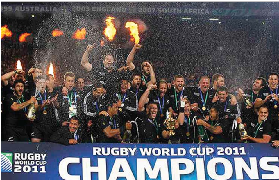
Új-Zéland rögbi-válogatottja második világbajnoki címét szerezte meg, ezúttal házigazdaként

A labda a franciáknál maradt, akik a 47. percben a bal