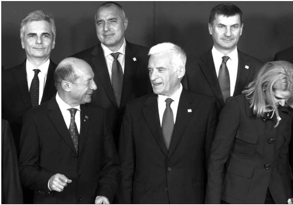
Traian Băsescu (alsó sor, balra) arra hívta fel a figyelmet, hogy Románia túl nagy árat fizetett a válság miatt

Az ugyancsak szombaton megtartott külügyminiszteri ülésen az EU alapszerződéseinek esetleges újabb módosításáról is szó esett. A Németországot képviselő Guido Westerwelle megerősítette, hogy hazája elkerülhetetlennek és sürgősnek látja ezt a lépést az euróövezet stabilitásának garantálása érdekében. ◀