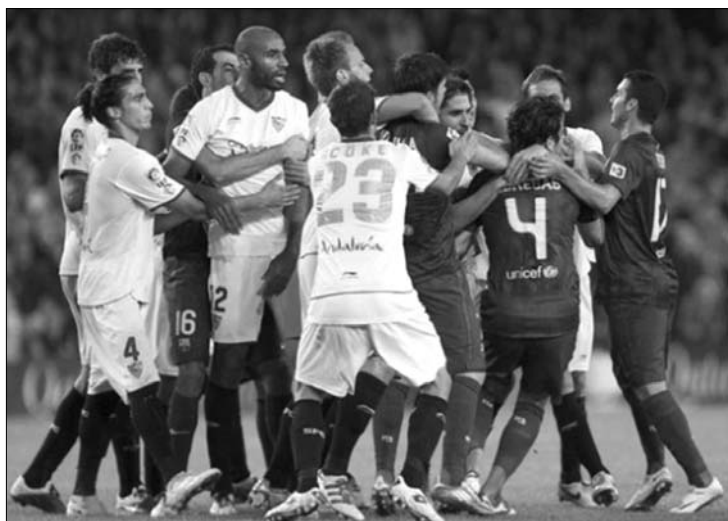
A Barcelona–Sevilla mérkőzést pár perces kakaskodás szakította meg

helsea 1-0, Blackburn–Tottenham 1-2, Arsenal–Stoke 3-1, Fulham–Everton 1-3, Liverpool–Norwich 1-1, Aston Villa–West Brom 1-2, Bolton–Sunderland 0-2, Newcastle–Wigan 1-0, Wolves–Swansea 2-2.