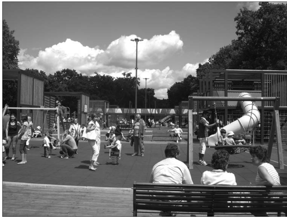
Dorin Florea polgármesternek biztosan megtérülnek a marosvásárhelyi luxusjátsszótérek

jelent: egymillió euróval járultak hozzá megépítéséhez a marosvásárhelyiek. Az olasz tervező által megálmodott – és sokak által biztonsági és esztétikai szempontból is kifogásolt szabadidőközpont – bejáratánál hatalmas kinagyított képen Dorin