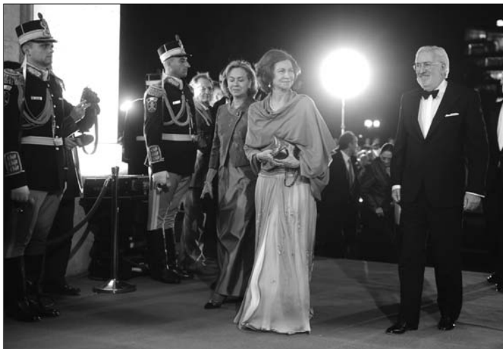
Zsófia spanyol királynő (középen) is felköszöntötte Mihály királyt.

Elemzők szerint Băsescu viszonya 2009-ben romlott meg az uralkodói familiával, amikor Radu herceg, a királyi család tagja bejelentette, hogy indulni kíván a soron következő elnökválasztáson. Azóta az államfő több alkalommal is ellenségesen nyi-