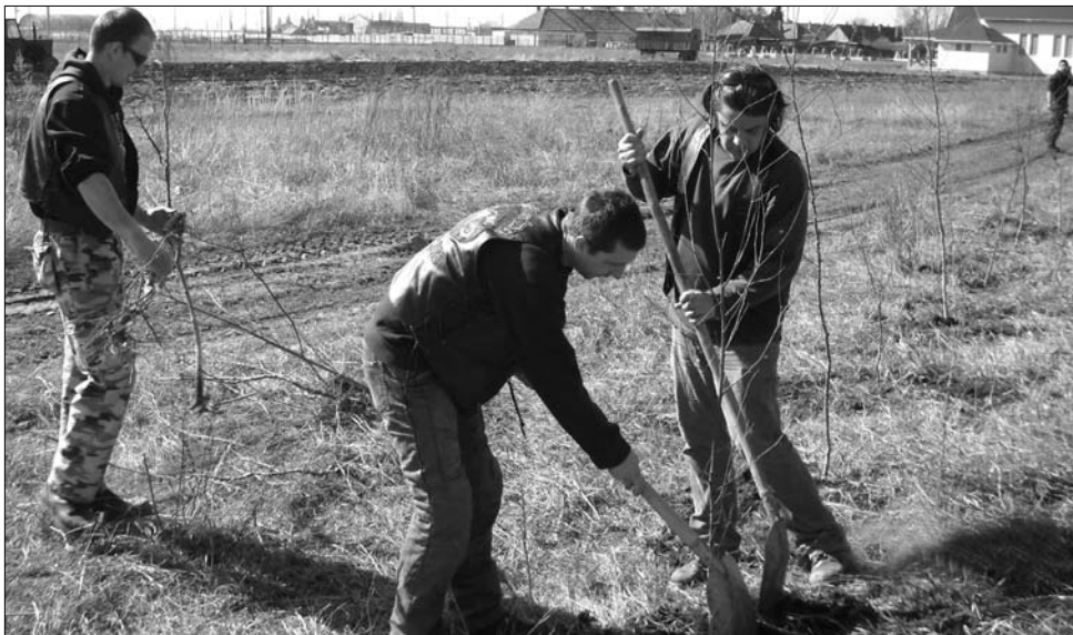
A szőlőtelepítések után ma inkább gyümölcsfák ültetését javasolják a szakemberek