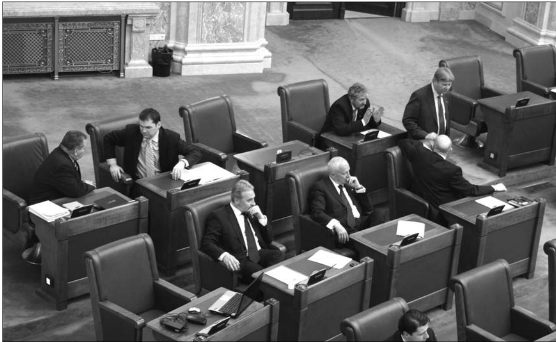
Nem az RMDSZ-en múltott. A szövetség szenátorai lelkiismeretesen részt vesznek a felsőház ülésén.