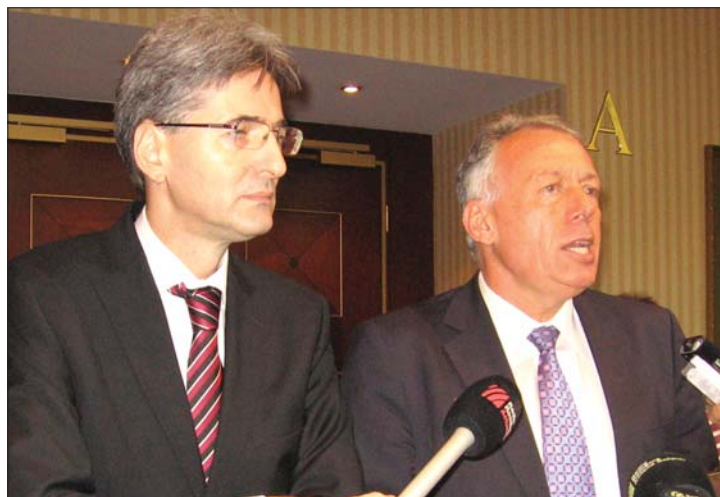
A számonkérés pillanata. Leonard Orban és Borbély László

▶ Borbély László környezetvédelmi és Leonard Orban EU-pénzekért felelős miniszter tegnap kérdőre vonta azoknak a megyéknek a képviselőit, amelyek elhanyagolták az integrált hulladékkezelési infrastruktúra kiépítését. Magyarok lakta megyék nem szerepelnek a „feketelistán”. 6. oldal ▶