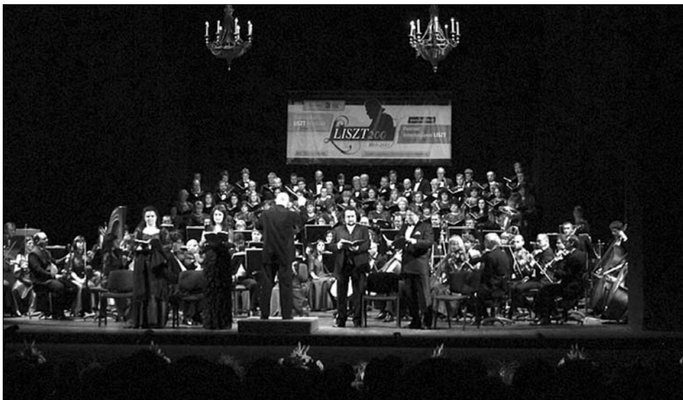
A szervezők elégedettek a Liszt 200 fesztivállal, azonban nem teszik évenként ismétlődő rendezvényé

Liszt Ferenc 1879-ben, barátjával gróf Zichy Géza zeneszerzővel és zongoraművésszel érkezett Kolozsvárra. A látogatáshoz kellemetlen emlék is fűződik, ugyanis a zeneszerző jelenlétében előadott Szent Erzsébet legendája az énekes szólisták és a kórus felkészületlensége miatt botrányba fulladt. A „csúfos oratóriumbotrányról” Brassai Sámuel így írt: „Mi pedig ígérjük meg ünnepélyesen, hogy ha még egyszer valamikor nagy művészhez lesz szerencsénk, nem fogjuk az ő darabját saját füle hallatára előadatni. Mert bizony néha a nevetségestől: il n'y a qu'un pas. Liszt tündöklően szép zongorajátéka persze feledtette a Szent Erzsébet legenda disszonáns hangjait.”