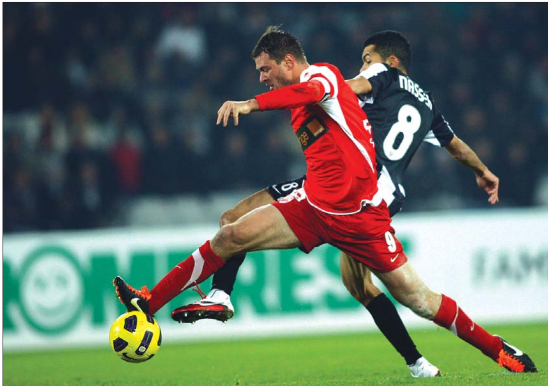
A házigazda kolozsváriak a döntetlennel is elégedettek voltak a Dinamo elleni találkozó után