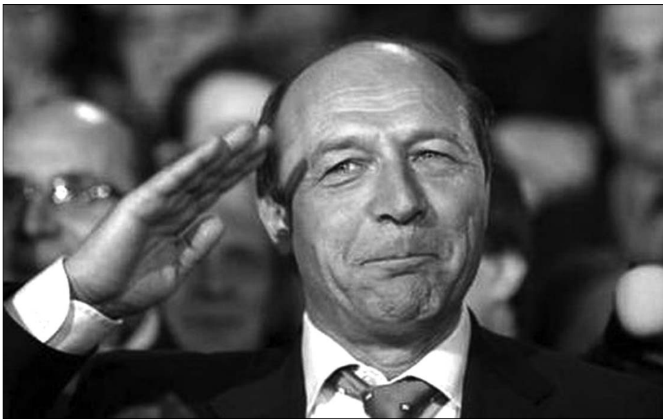
Traian Băsescu, az „országshajó” kapitánya. Minden kérdésre van válasza

Hasonlóképpen másra hátrította a konkrét választ a Népi Mozgalom néven körvonalazódó új politikai alakulat kapcsán is. Erről – szerinte – a mozgalom egyik fő szervezőjének tartott egykori államfői tanácsosnak és volt munkügyi miniszternek, Sebastian Lăzăroiu-nak kell tájékoztatást adnia. Azt viszont nem tagadta, hogy a jobboldali politikai palettán létezik egy úr, amelyet a Demokrata Liberális Párt nem tud egymaga betölteni, így szükség lenne egy közép-jobboldali struktúrára. Egyben megfricskázta a királyság híveit is, arról beszélve, hogy a jelenleg időszzerűvé vált monarchista áramlatot a Kereszténydemokrata Nemzeti Parasztpárt könnyűszerrel a maga hasznára fordíthatja, kiváltésképpen, hogy a királypártiak fő támogatója ez idő tájt Ion Iliescu, Petre Roman és Cătălin Voicu. Ezúttal azt is elárulta, hogy ő maga nem számíthat a monarchista választói táborra. „Nekem itt semmi esélyem nincs. Sajnos!” – nyilatkozta. ◀