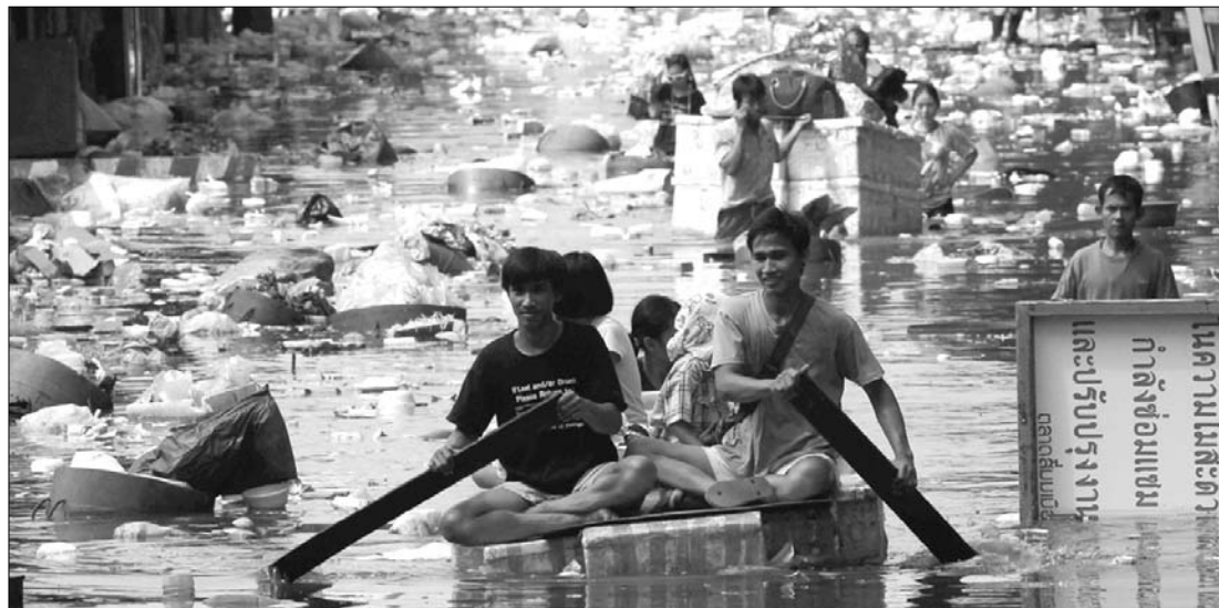
Ahogy tud, úgy menekül mindenki Bangkokból. Az emberek nem a víztől, hanem a krokodiloktól tartanak

A Reuters nemzetközi hírügynökség internetes oldala szerint a legmagasabb vízállás mára várható. ◀