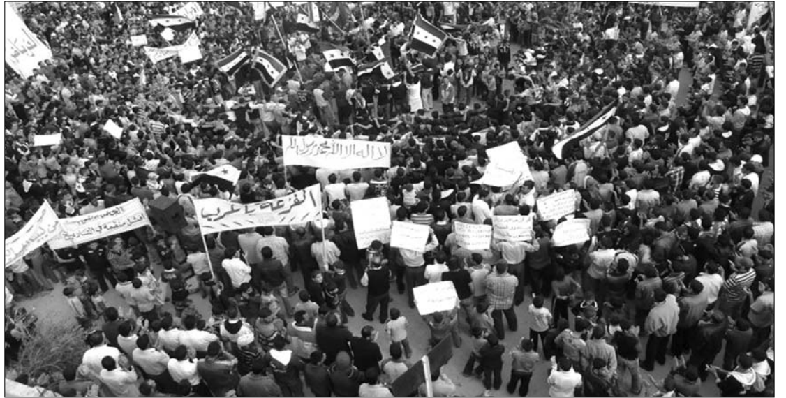
Szíriában is változásokat követel a tömeg. Aszad elnök szerint a katonaság csak az al-Kaida ellen harcol

Ha a nyugati hatalmak beavatkoznak Szíriában, „tízszeres Afganisztánnal” találhatják szemközt magukat – jelentette ki Basár el-Aszad tegnap. A szíriai elnökkel a The Daily Telegraph című brit konzervatív lap készített interjút. Aszad kijelentette: „ha bármiféle probléma” támad, akkor „lángba borul az egész térség”. Megmagyarázta azt is, hogy miért a katonaság tartja fenn a lakossággal szemben a rendet: „ez azért van, mert csak a katonaság