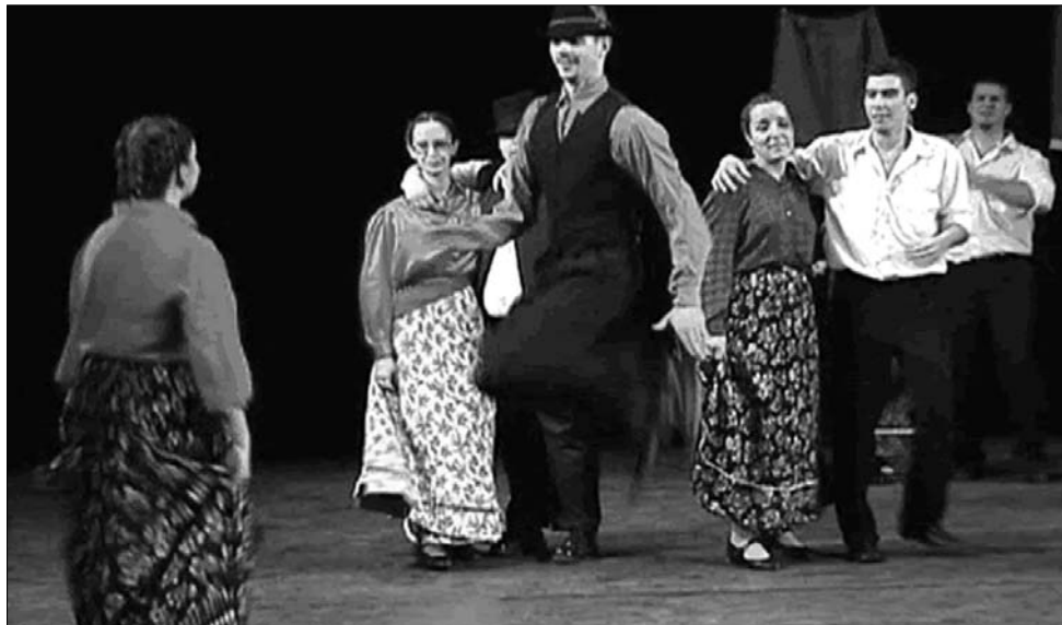
A székelyudvarhelyi Össztánc – Ősszel elnevezésű rendezvényen a térség táncosai lépnek fel