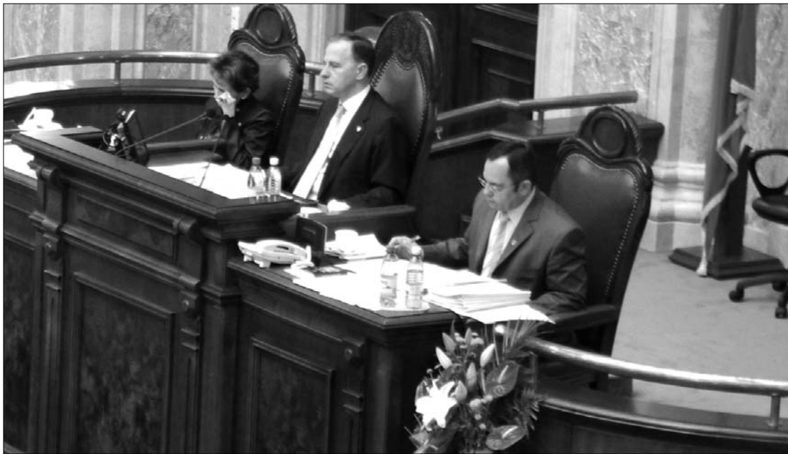
Mircea Geoană immár saját pártja sem látná többé szívesen a szenátus elnöki székében

Geoană a tengerentúlról is folytatta magánhaborúját, Facebook-bejegyzésben emlékeztette az USL vezetőit, hogy az ellenzéki szövetség alapjául szolgáló együttműködési szerződés értelmében az államfőjelölt személye nincs kőbe vésvé, a dokumentum szerint az USL „a felmérésekben legjobban álló politikusként indítja a tisztségért”. Saját pártja vezetői arra biztatták Geoanát, hogy igazoljon át a PNL-be, ha valóban államfő szeretne lenni, mert a protokollum értelmében a tisztség a liberálisokat illeti. ◀