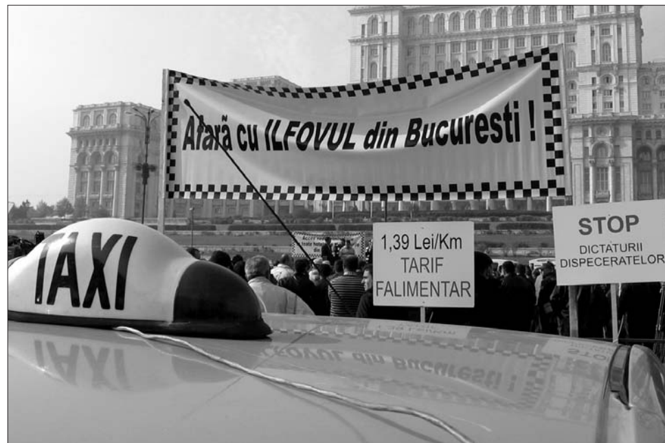
A bukaresti taxisok keveslik az 1,39 lejes viteldíjat, ezért újabb tüntetésre készülnek.