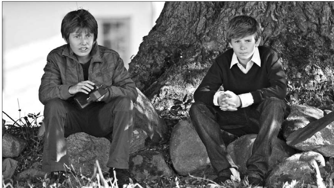
A ma kezdődő marosvásárhelyi Alter-Native ékesége Susanne Bier Egy jobb világ című Oscar-díjas filmje