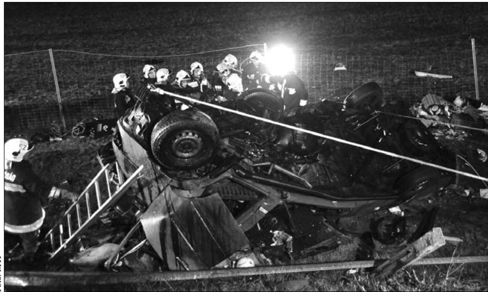
Roncs a sztrádán. Az eredetileg 8+1 férőhelyes kisbusz törvénytellenül szállított 15 utast

Az utóbbi években igen gyakran okoztak balesetet Magyarországon romániai járművek. 2007 júliusában hét román állampolgár halt meg 16 pedig súlyosan megsérült, amikor autóbusszuk Makó és Szeged között kamionnal ütközött. Két év múlva, januárban hét sebesültet követett egy romániai kisbusz és egy magyarországi személygépkocsi karambolozása Nyugat-Magyarországon. Egy hónap múlva romániai kisbusz és kisteherautó ütközött, a mérleg: egy halott és három sebesült. Szeptemberben ismét magyarországi személygépkocsival ütközött romániai kisbusz okozott nyolc sérülttel járó balesetet, ezúttal Magyarország déli felében. 2010 januárjában újabb romániai kisbusz rohant személyautóba Bihar-keresztes és Mezőpeterd között, hét személy megsebesülését okozva. Márciusban Magyarország északkeleti felében román kisbusz csúszott meg a havas úton, kilenc utasa közül három komoly sérülést szenvedett. Júniusban egy halálos és négy sérült áldozata volt alig 30 kilométernyire a román határtól a két romániai kisbusz és egy autóbussz által okozott karambolnak. Egy év múlva a romániai Atlassib cég busza ütközött szlovák kamionnal az M 70-esen. Öt személy meghalt, 25 megsebesült. Idén szeptemberben 28 utas sérült meg, amikor Debrecen és Mikepercs között román kamion ütközött autóbusszal. ◀