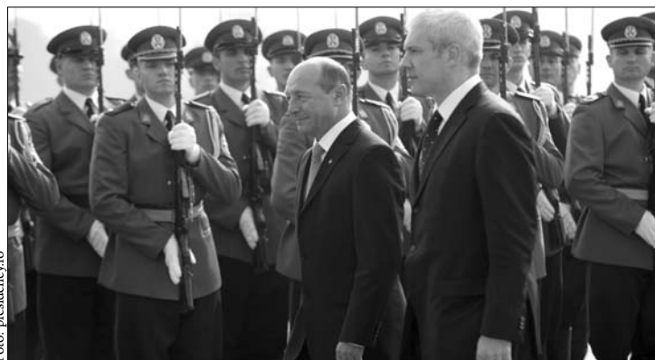
Băsescut Belgrádban Tadic fogadta. Mindketten aggódnak a kisebbségekért

Románia nem köti a Szerbiában élő román kisebbség helyzetéhez az EU és Belgrád közötti társulási megállapodás jóváhagyását – biztosította Traian Băsescu tegnap Borisz Tadicstól. A román államfő kétnapos hivatalos belgrádi látogatása keretében tárgyalt a szerb elnökkel a két ország viszonyáról, illetve Szerbia uniós kilátásairól. Băsescu emlékeztette vendéglátóját arra, hogy a román parlament még nem ratifikálta Szerbia és az EU megállapodását, és reményét fejezte ki, hogy a Belgrád uniós csatlakozásáról döntő december 9-i EU-csúcsig ez megtörténik. „A Szerbiában élő vlahok helyzetét a még hátralévő időben amúgy sem lehetne megoldani. Feltétel nélkül támogatjuk a szerb uniós csatlakozást” –