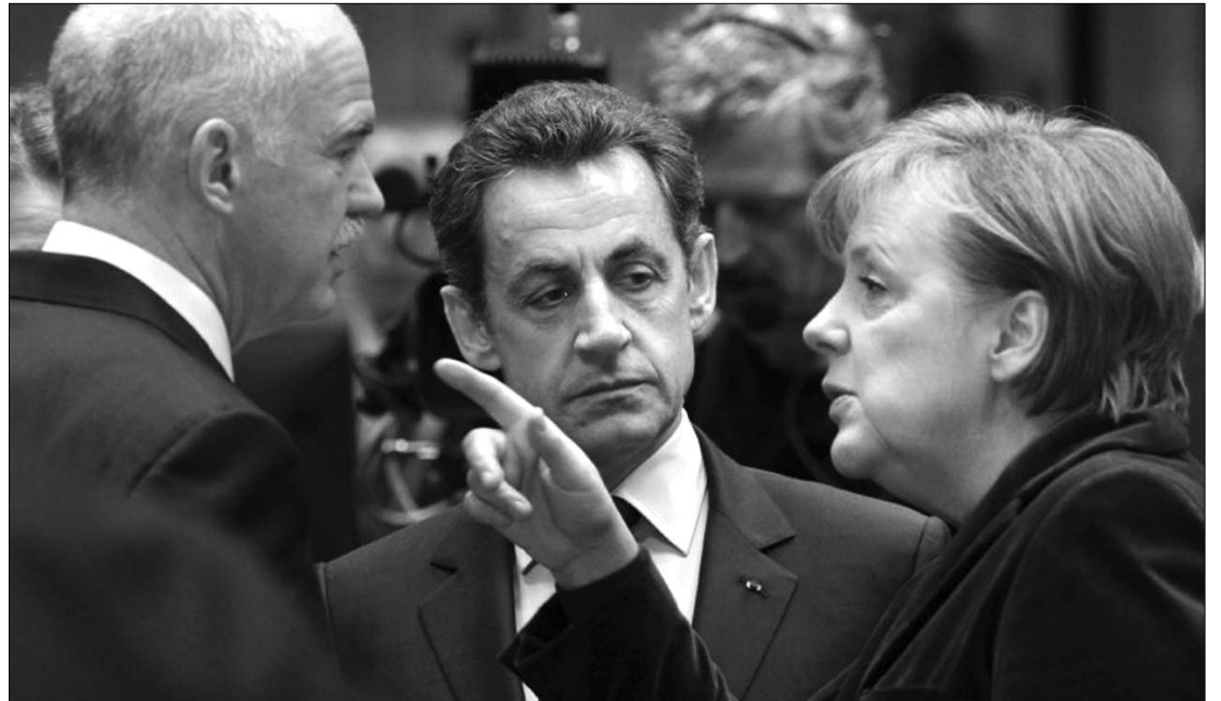
Angela Merkel (balra) és Nicolas Sarkozy (középen) „kioktatta” Papandreut. A jelek szerint nem használt az intés

A piac gyorsabban reagált, mint a politikusok. Papandreu bejelentése eladási hullámot indított be az európai tőzsdéken,