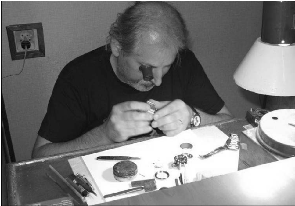
Számos kisvállalkozó a Kogălniceanu-programnak köszönhetően tudta meg, hogy hitelképes