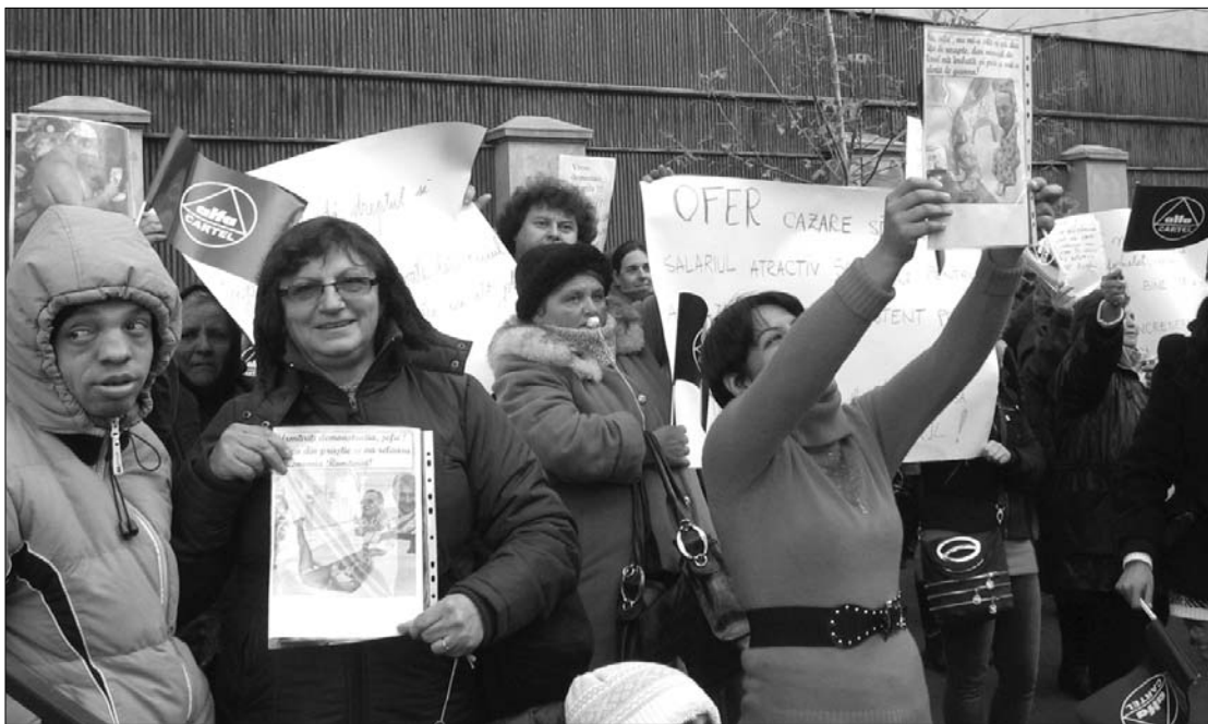
Szociális gondozók és ellátottjaik tüntettek tegnap a támogatások késése miatt a munkaügyi tárca előtt.

részét, egyeseket pedig megszüntet. Határt szabnak a pénzügyi kedvezmények felső szintjének, ha az ellátásban részesülő személy egy időben több típusú kedvezményre jogosult. A jogosultak köre várhatóan a jelenlegi 8-12 millió személyről 4-6 millióra csökken. A kormány számításai szerint a jogszabály bevezetésével 950 millió eurót takarít meg az állam 2013-ig. A törvényt januártól alkalmazzák a Boc-kabinet, viszont a jogszabályt még a képviselőház plénumának is meg kell szavaznia. A törvénytervezetet az RMDSZ is támogatja, mert sikerült elfogadtatnia számos javaslatát, amelyeket a szociális szolgáltatást nyújtó romániai magyar nonprofit szervezetekkel való konzultálás után terjesztett elő. ◀