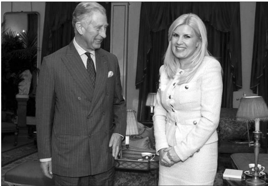
Elena Udrea turisztikai miniszter Károly herceget a román turizmus csodálatos nagykövetének nevezte

A Travel Channel csatorna Wild Carpathia című műsorában a brit