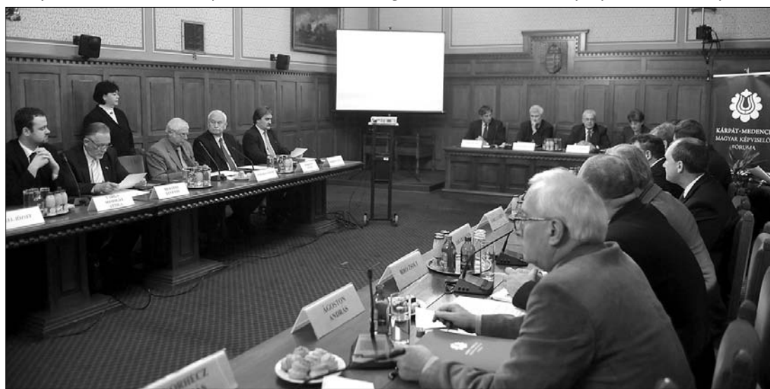
Megalakult Budapesten a Kárpátaljai Magyar Képviselők Fórumának szakcsoportja. Schengennel is foglalkoztak

rosvásárhelyi Orvosi és Gyógy-szerészeti Egyetemen zajló történésekre, amelyek szerinte ékesen bizonyítják, Romániában még nagyon messze állnak attól, hogy megnyugtatóan rendezni tudják az anyanyelvű oktatás helyzetét. ◀