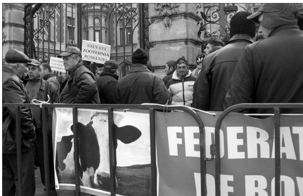
„Az istállóinkban ülő állatok menthetik meg az országot” – állítják a tüntetők

„Több oka is van annak, hogy kénytelenek voltunk utcára vonulni, ahelyett, hogy gazdaságainkban dolgoznánk. Nem kaptuk meg az állattartásért járó anyagi támogatást, az országban nincs piaca a tejtermékeknek, bár