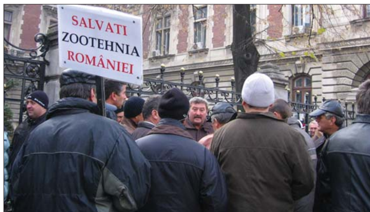
Az állattartók „uniós körülményekért” tüntettek Bukarestben

mét az ágazat gondjaira. Ha gondjaikra nem találnak megoldást, az elszánt farmerek hajlandóak Brüsszelig menni. 6. oldal