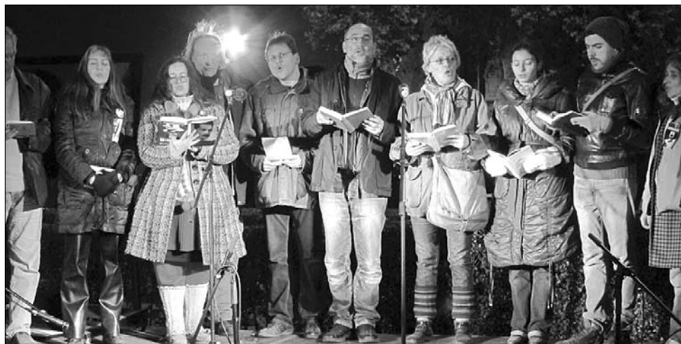
A József Attila-szobor áthelyezése ellen 32 óra 40 perces versmaratonnal tiltakoztak Budapesten

kedves vagy fontos verset, írást, vallomást elmondjon, eljátsszon, elénekeljen, eltáncoljon vagy akár megrajzoljon József Attilától. A 32. születésnapja után háromnegyed évvel elhunyt József Attila emlékére 32 óra 40 percig tartó versmaraton civil kezdeményezésésként valósult meg, a rendezvényen összegyűlt adomány a költségeknek körülbelül a felét fedezi – közölte Faragó Zsuzsa, hozzátéve: a szervező csoportnak nincs hivatalos támogatója, nem kötődik sem pártokhoz, sem egyéb szervezetekhez. Az eseményt tiltakozásul szervezték azért, mert a Kossuth tér 1944 előtti képzőművészeti arculatának visszaállításáról döntő országgyűlési határozat alapján József Attila szobrát máshová kell áthelyezni. ◀