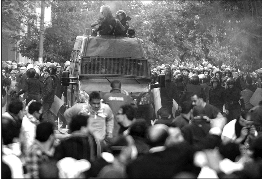
Kiújultak az összecsapások Kairóban. A rendőrök könnygázt használnak az egy hete tartó zavargásokban

Elítélte az egyiptomi hatóságok erőszakos fellépését a kairói tüntetők ellen Catherine Ashton, az