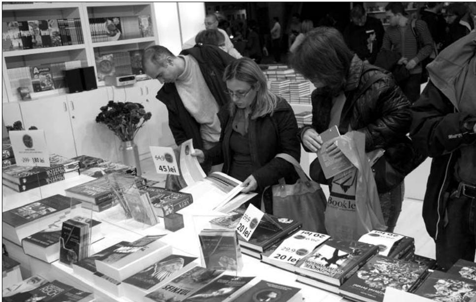
A 18. Gaudeamus Nemzetközi Könyvvásárra a szervezők százezer érdeklődőt várnak