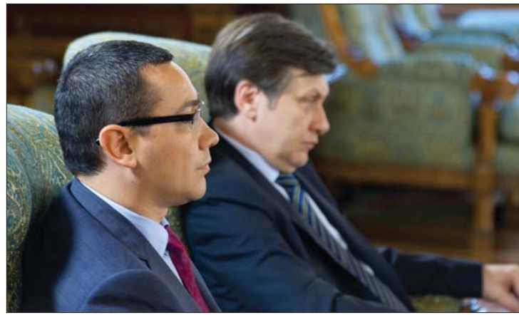
Victor Ponta és Crin Antonescu, az ellenzéki szövetség vezetői.

▶ Újra szembe kell néznie a függesztés lehetőségével Traian Bănescunak, ha az ellenzéki Szociál-Liberális Szövetség (USL) két társelnökének, Crin Antonescunak és Victor Pontának sikerül kezdeményeznie az államfő menesztését. 3. oldal ▶