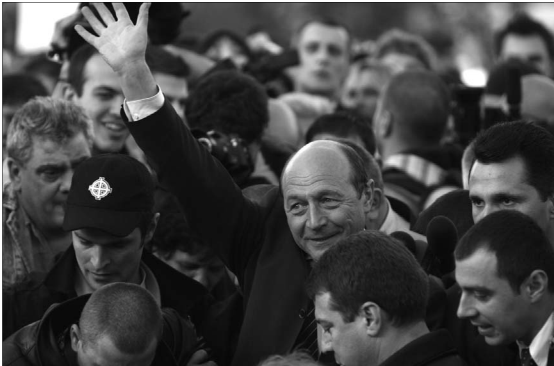
Traian Băsescu államfőt 2007-ben egyszer már felfüggesztették, de a népszavazáson győzelmet aratott

A hatályos törvények szerint az államfő felfüggesztéséről a parlament dönt. Népszavazást viszont csak akkor írhatnak ki, ha az Alkotmánybíróság nem talál kivétnevet a törvényhozás határozatában.