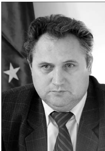
György Ervin háromszéki prefektus

► Cáfolta tegnapi sajtótájékoztatóján György Ervin, hogy magyar vonatkozású ügyekben a román alprefektusra hárítaná a felelősséget. A háromszéki prefektus szerint véletlen volt, hogy Valentin Ionașcu írta alá azt a levelet, amelyben felszólítják a megyei tanácsot: vonja vissza határozatát az egységes Székelyföldről szóló népszavazásról. György Ervin magyarázata szerint nem tartózkodott a városban, amikor a levél született, ezért megbízta helyettesét, hogy írja azt alá. A prefektus leszögezte: magyarként is a román kormányt képviseli, és vissza kell vonatnia a megyei tanács törvénytelen határozatát. A háromszéki kormányhivatal jogászai a székelyföldi népszavazásról azt állapították meg, hogy az önkormányzat nem tartotta be a vonatkozó procedúrát, amely szerint egy határozatot a tanácselnök, vagy a tanácsstagok egyharmada kezdeményezhet, ez esetben pedig egy képviselő csak a vita során csatlakozhat, amit nem vettek figyelembe. György Ervin szerint a másik kifogás az volt, hogy a népszavazásról szóló határozatot nem bocsátották 30 napos közzétételük után. A kormányhivatal véleménye szerint egyébként a megye határainak módosítására csak az államelnök vagy a parlament írhat ki népszavazást, meglátásuk sze-