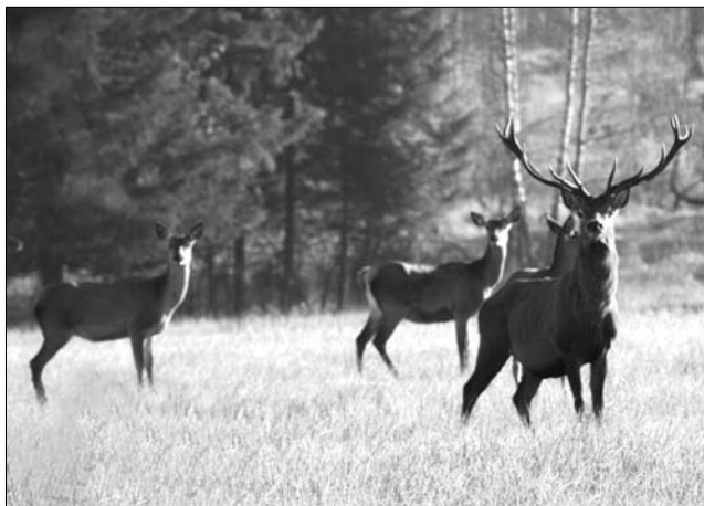
A vadsparkokban természetbarát gazdálkodás zajlik

A Honor által működtetett, Székelyudvarhely közelében levő 320 hektáros Ivó Vadspark állatállománya gím- és dámszarvasokból, őzekből, muflonokból és vaddisznókból áll, míg a 350 hektáron elterülő Kézdialmási Vadspark elsősorban vaddisznó tenyésztésre szakosodott. A Kovászna megyei Lemhény falu mellett ugyanakkor mangalicákat nevelnek egy hagyományos, szabadtéri biofarmon. A vadsparkban való kirándulás mellett lehetőség nyílik lovas túrára és vadhúskóstolóra is, de a vadászszезонban a létesítmény nyitva áll ezen