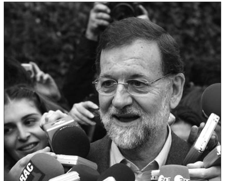
Mariano Rajoy. A szocialista Zapaterot váltja a spanyol kormány élén

A mostani parlament mandátuma és José Luis Zapatero szocialista miniszterelnök megbízata eredetileg 2012 márciusáig szólt volna, ám a leköszönő kormány éppen a gazdasági válság miatt döntött a voksolás előrehozásáról. ◀