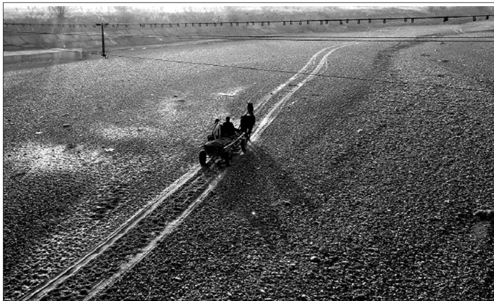
Szekérrel a Dunában. Rekordot döntő alacsony vízállás

csatorna pedig helyenként olyan szűk, hogy a hajóvontak csak egy uszályal haladhatnak át a szokásos hat helyett. Fel sem tudom mérni a veszteségeinket” – mondta az általános helyzet jellemzőiként a bolgár szakember. A kikötők ugyancsak csökkentett kapacitással működnek. A Duna bolgár és román partja között (ahol egyébként határfolyó) a két kompjáratot a leállás veszélye fenyegeti, ami elkerülhetetlenül bekövetkezik, amint az ukrán államter alá süllyed a vízállás. Az ukrán határ közelében fekvő Galac kikötőjének hatóságai csak intenzív kotrasi műveletek révén tudják fenntartani azt a minimális vízmélységet, ami elengedhetetlen a hajók manőverezéséhez. (Sokan emlékeznek még arra, hogy az évezred elején helyenként gázlók alakultak ki, és szekérrel is át lehetett kelni az egyik oldalról a másikra.) Bukarestben attól tartanak, hogy Cernavodán le kell állítani az ország egyetlen atomerőművének az egyik reaktorát, ha a Duna vízszintje tovább apad. A reaktort, amelynek hűtését a már említett magyarországi Pakshoz hasonlóan a Duna vizével