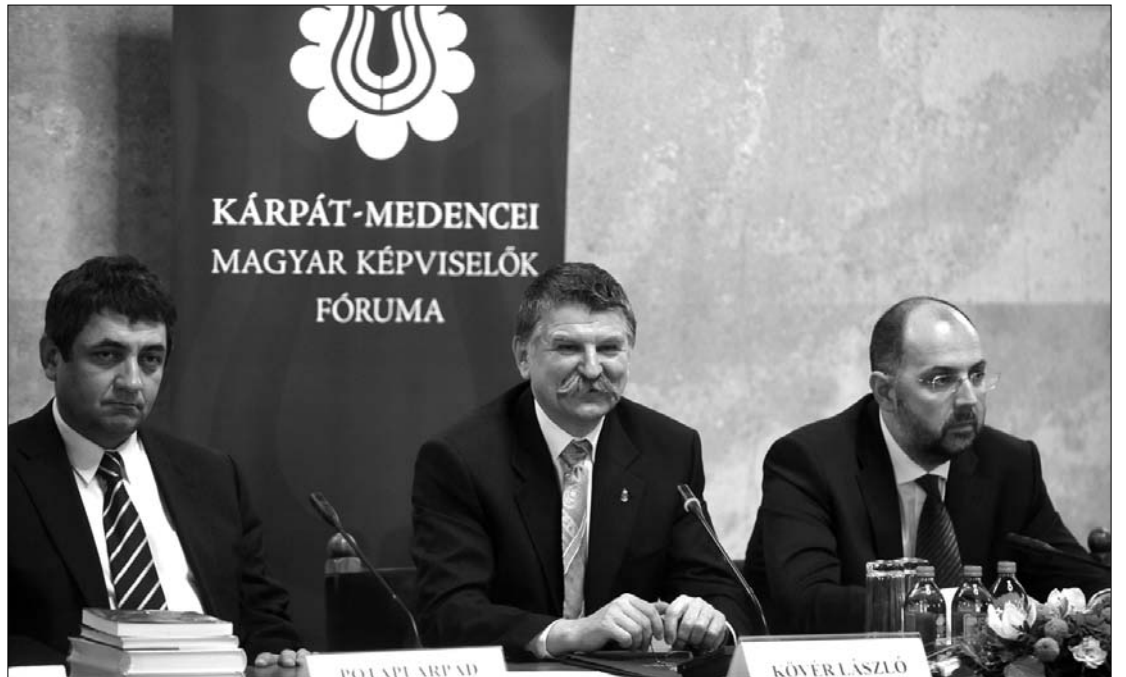
Potápi Árpád parlamenti képviselő, Kövér László országgyűlési elnök és Kelemen Hunor RMDSZ-elnök