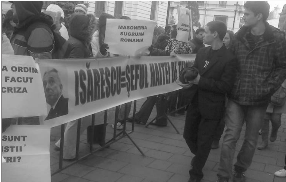
A bukaresti tüntetők Isărescu- és „világkormány”-ellenes jelszavakat skandáltak