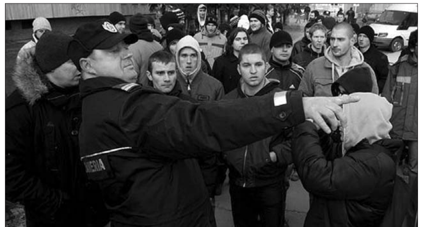
Szélsőséges megnyilvánulások tarkították a december 1-jei erdélyi rendezvényeket. Csíkszeredában egymásnak asszisztáltak a Noua Dreaptă (balra) és a HVIM tagjai (jobbra)

alpolgármester azt válaszolta: a testület nincs kellő eszközök birtokában, és az érvényben lévő jogszabályok is hézagosak. „Nem tudjuk előre minősíteni a rendezvény jellegét, nem tudhattuk, hol fognak felvonulni a Noua Dreaptă tagjai, és ha tudnánk is, mit tehetnénk, hogy állíthatnánk meg őket, mondjuk a város határában?” – kérdezett vissza az előljáró.