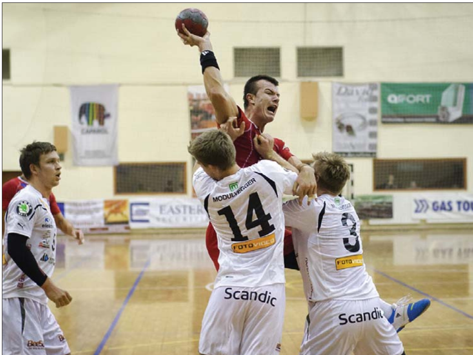
A norvégok (fehér mezben) nem adták olcsón a bőrüket Székelyudvarhelyen

Bűcsűzött viszont az EHF Kupától a Tatabánya, amely múlt vasárnapi, hazai veresége (26-28) után szombaton idegenben is kikapott a cím-