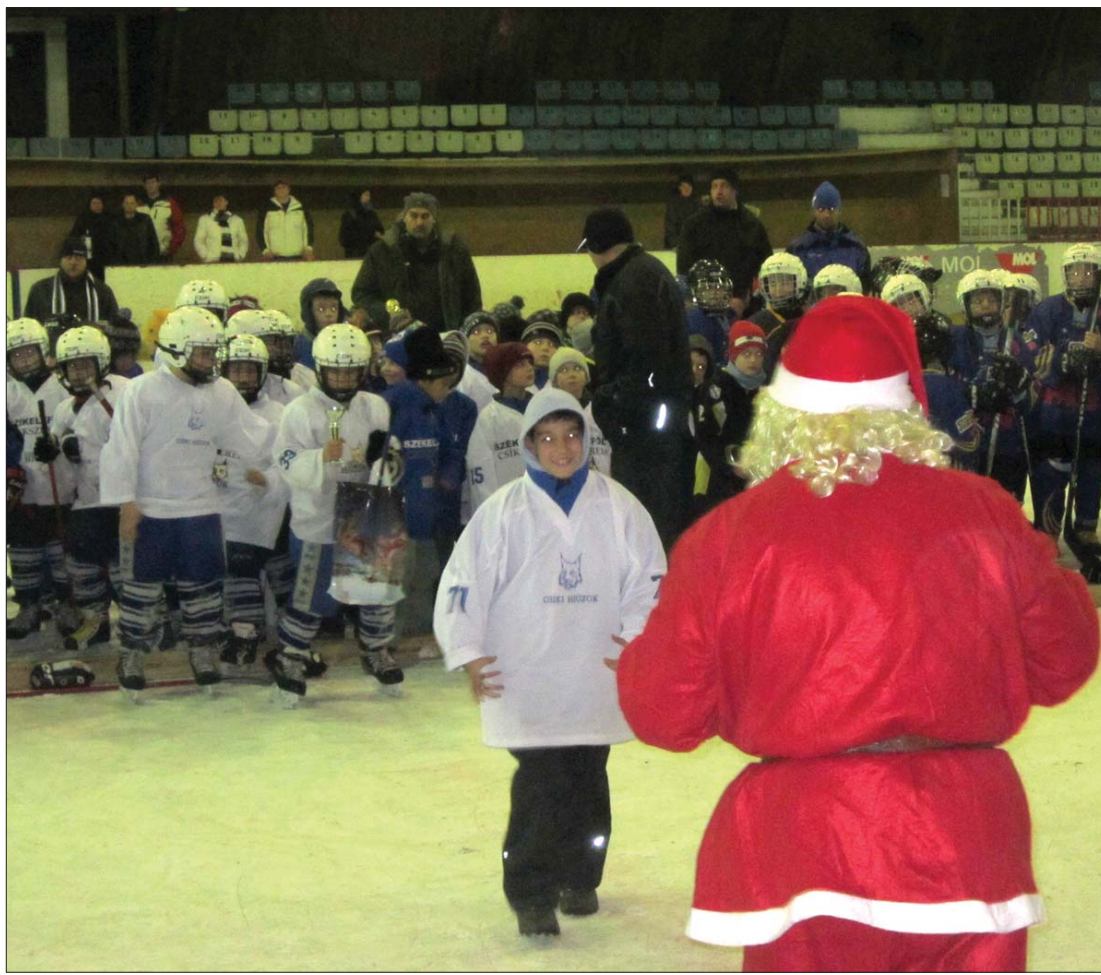
Elsőként a gyergyói hokis kölyöksapat tagjaihoz jött el a Mikulás, a többi gyermeknek máig még várnia kell

kói. A szervezők nagy figyelmet fordítottak a kicsikre, akik a hét végén gyermek-táncszobába mehettek és Mikulás-meséket hallgathattak. 8. oldal ►