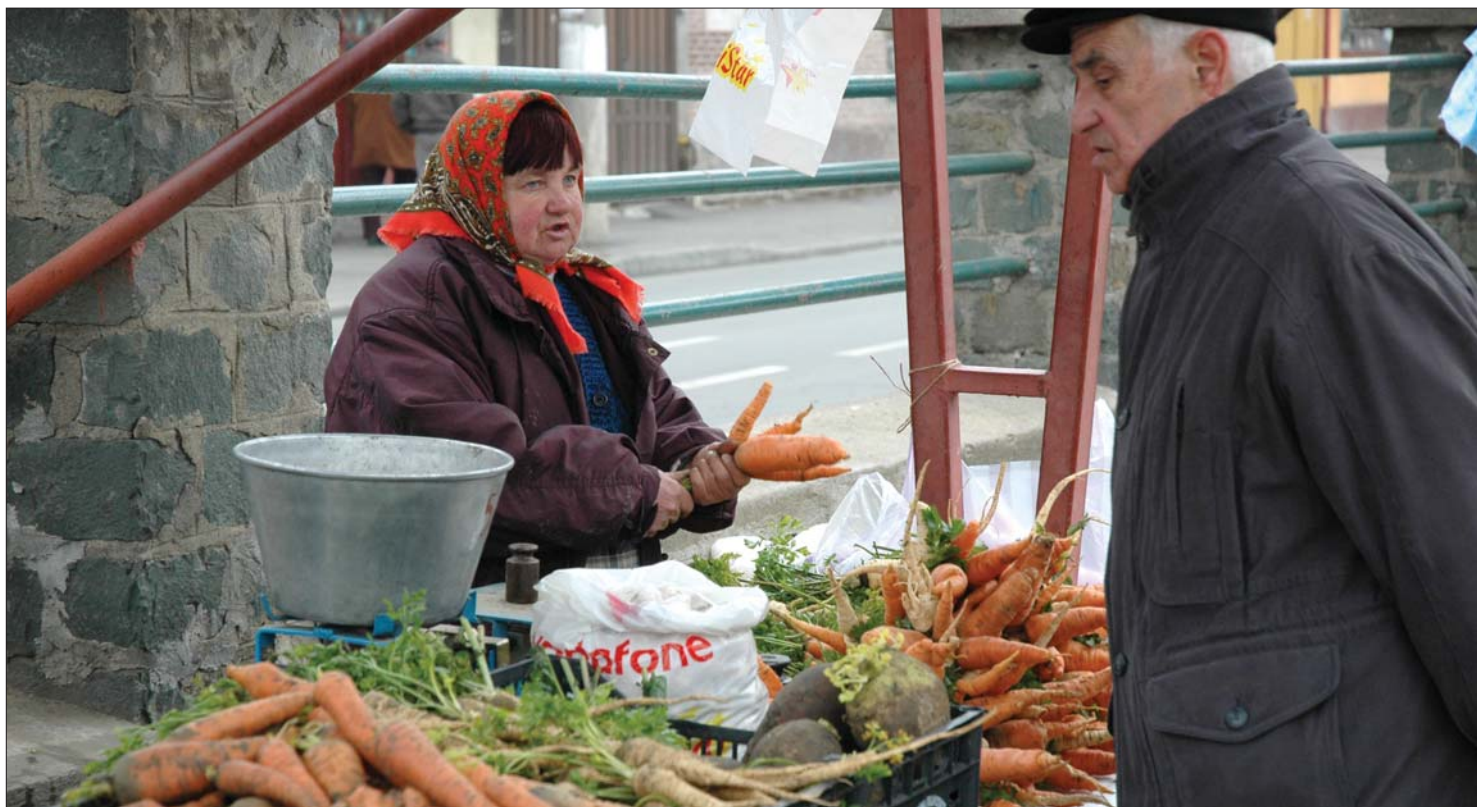
A piaci kofákat is sújtaná az új adó: jövő évtől nettó jövedelmük után tizenhat százalékos adó fizetésére kötelezhetik a hazai kistermelőket

Tizenhat százalékos illetéket szedne a kormány a mezőgazdasági kistermelőktől