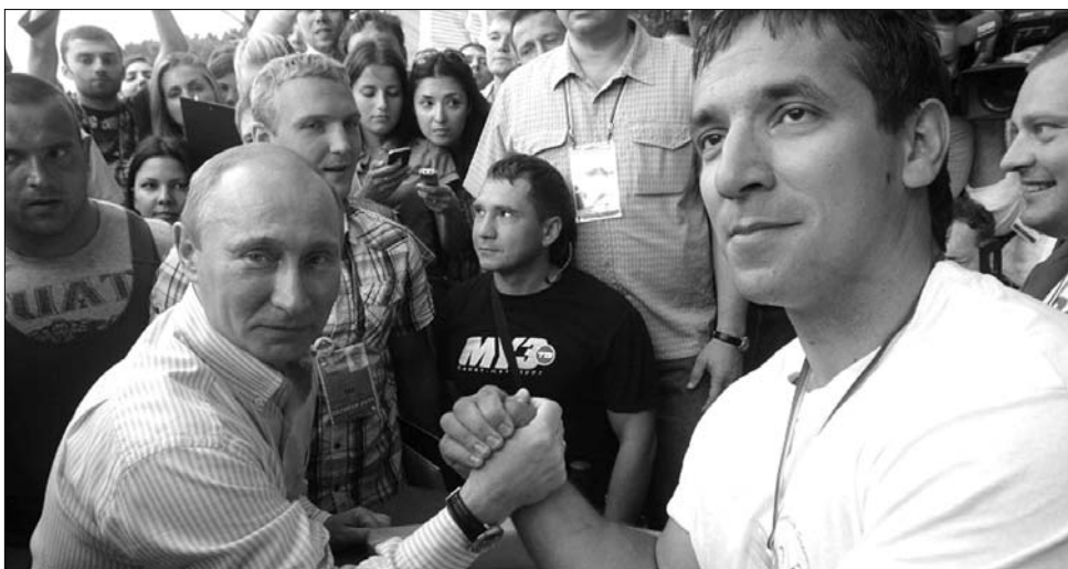
Vlagyimir Putyin (balra). Fizikai erőpróba – a politikai megmérettetést megelőző kampányban

Az államfővé megválasztott akkori miniszterelnök, Dmitrij Medvegyev új arcként jelent meg, Vlagyimir Putyin ugyanis az akkori alkotmány értelmében harmadszor nem jelölthette magát. Időközben azonban változott a törvény, így elhárult az akadály Putyin visszatérése előtt. Putyint voltaképp az „államalapító” Boris Jecsin „találta ki”: az egykori KGB-ügynöknek az ezredforduló hajnalán, 1999 szilveszterén adta át a hatalmat. A most 59 éves politikus a je-