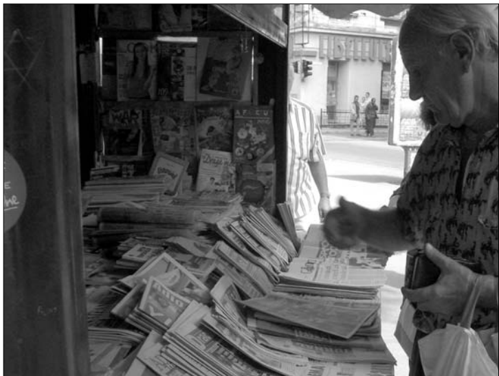
Romániában évről-évre kevesebb fogy a nyomtatott lapokból.

alatt, hanem piacvezető pozícióját is. Az Adevarul Holding lapcsaládjához tartozó napilapból a tavalyi harmadik negyedévében még közel százezer, 91 006 példány fogyott naponta, idén július-szeptember között azonban csak napi 33 706 darab kelt el belőle, ami több mint 60 százalékos visszaesést jelent.