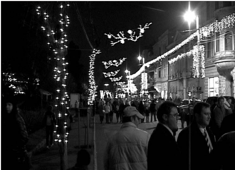
Az erdélyi városok is ünneplőbe öltöztek: 23 millió villanykörte világított tegnap Marosvásárhelyen

A játékboltok, karácsonyi vásárok eladói is megerősítették: idén az olcsó és egye-