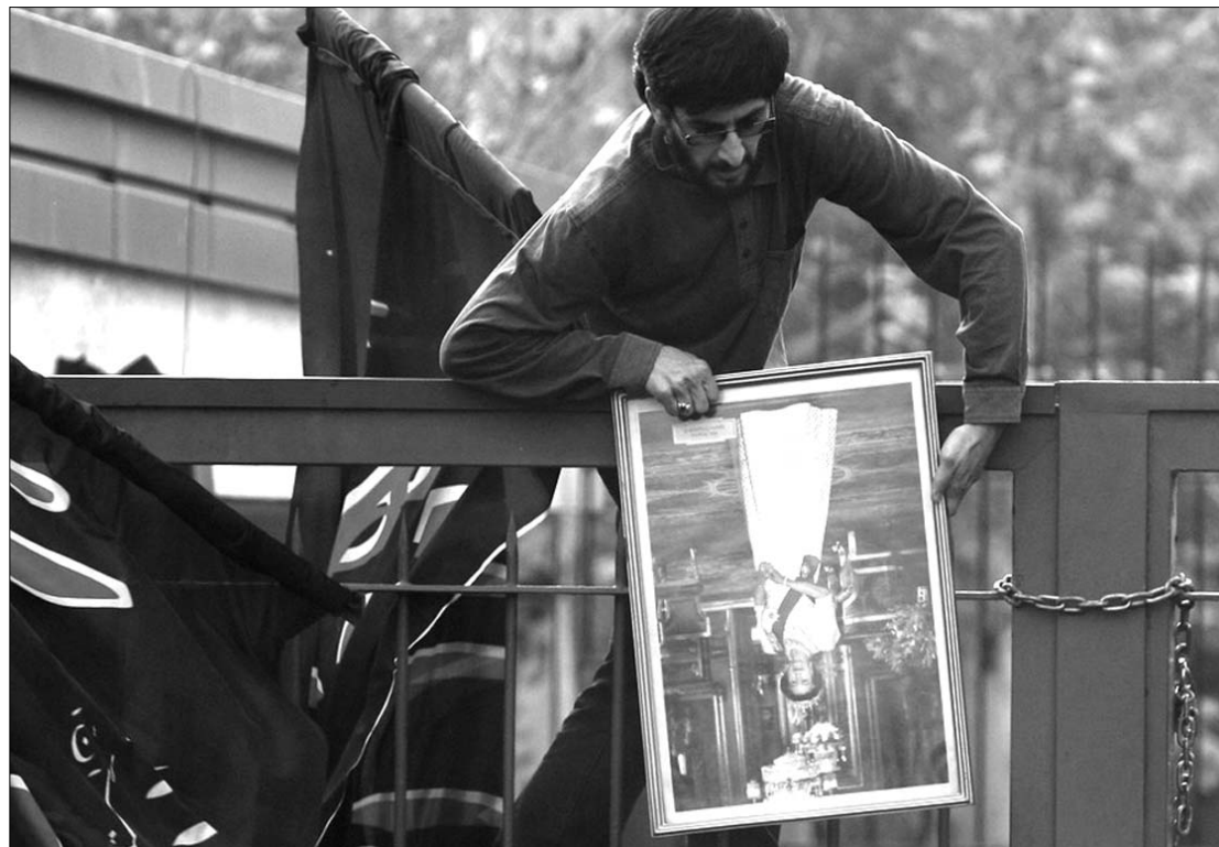
Megrohamozták a brit nagykövetséget Teheránban. Az akció mögött az Iszlám Gárdát sejtik

A teheráni brit nagykövetség elleni támadásban egy tüntetés nyomán mintegy félszáz embernek sikerült behatolnia az épületbe, amelyről eltávolították a címet, letépték és az iráni tüntetők ki a brit zászló helyére, iratokat és brit lobogókat égettek el, míg odakint a tömeg összetűzött a kivezényelt rohamrendőrökkel. A tüntetők eredetileg azok ellen a szankciók ellen tiltakoztak, amelyeket London a vitatott célú iráni atomprogram miatt léptetett életbe a minap. ◀