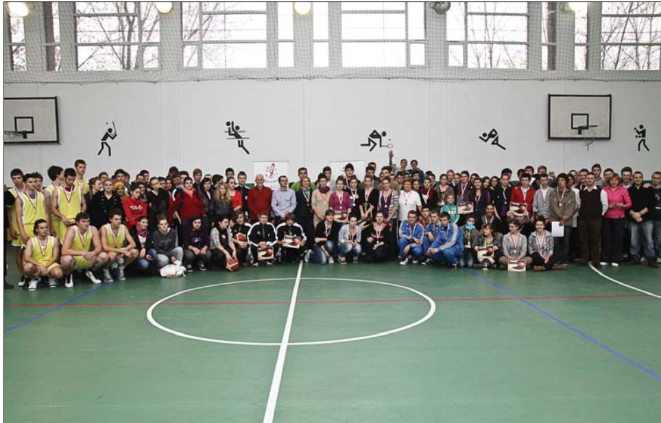
Kolozsváron együtt volt az erdélyi magyar középiskolák kosárlabda kérmje

A fiúknál a hét csapatot két csoportba osztották, az elsőbe a tavalyi győztes kolozsvári Báthory István Elméleti Líceum, az aradi Csiky Gergely Főgimnázium és a marosvásárhelyi Bolyai Farkas Elméleti Líceum, a másodikba pedig a brassói Áprily Lajos Főgimnázium, a gyergyószentmiklósi Salamon Ernő Gimnázium, a nagybányai Németh László Elméleti Líceum és a szatmárnémeti Kölcsey Ferenc Főgimnázium együttese került. A körmérkőzések eredményei: Kolozsvár–Arad 59-22, Kolozsvár–Maros 62-21, Maros–Arad 50-13, Brassó–Gyergyószentmiklós 42-38, Brassó–Szatmárnémeti 38-33, Brassó–Nagybánya 37-26, Gyergyószentmiklós–Szatmárnémeti 43-42, Gyergyószentmiklós–Nagybánya 54-42, Szatmárnémeti–Nagybánya 46-