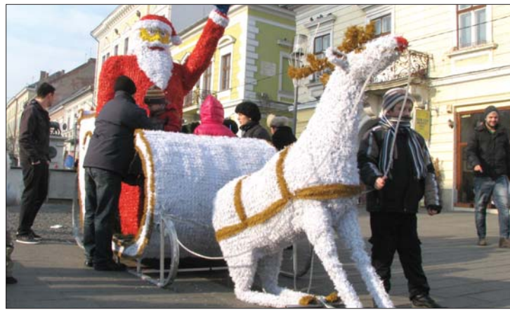
Műmikulás műrénszarvassal Kolozsvár központjában

▶ Az önkormányzatok központi ünnepségekkel köszöntötték tegnap a Mikulást, a szülők és a pedagógusok szerény kiadások-