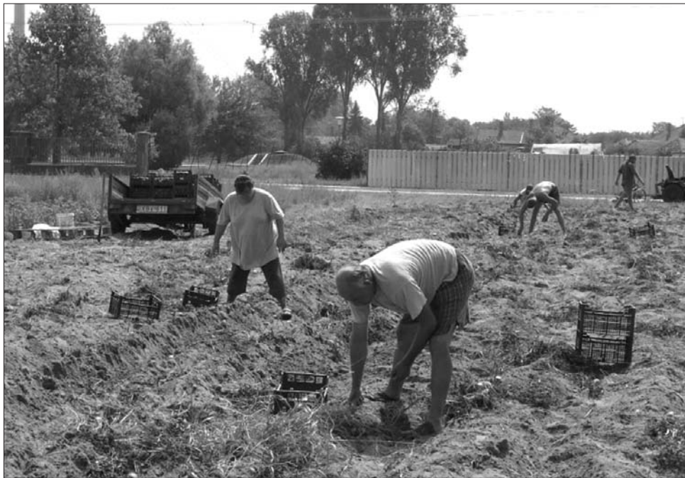
A többnyire minimális nyereséggel dolgozó kistermelőket is „megsarcolni” a kormány

Valeriu Tabără mezőgazdasági miniszter a Mediafax kérdésére leszögezte: a tervezett módosítás szerint nem vezetne árdráguláshoz, ám