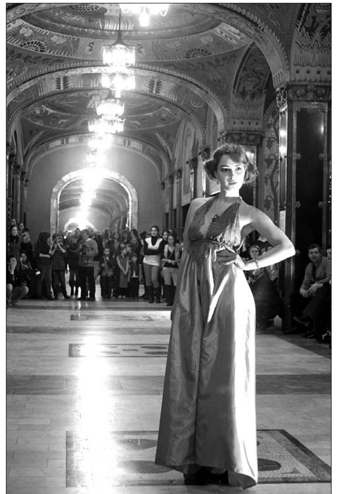
A romantika ihlette ruhákat mutattak be Vásárhelyen