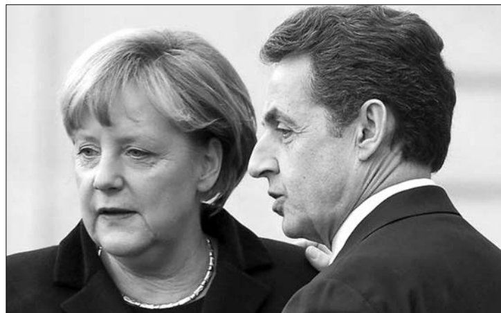
Merkelen és Sarkozyn látszik, hogy aggódik Európa jövőjéért

„Merkozy” – így nevezte el a nemzetközi sajtó a két politikus párosát – tegnap ismertette a javaslat legfőbb elemeit, hangsúlyozva, hogy az euróövezeti kötvények kibocsátása semmilyen esetben sem jelentene megoldást a válságra. A javaslatot elsősorban Berlin utasította el, de az elképzelésért még a nyáron harcoló