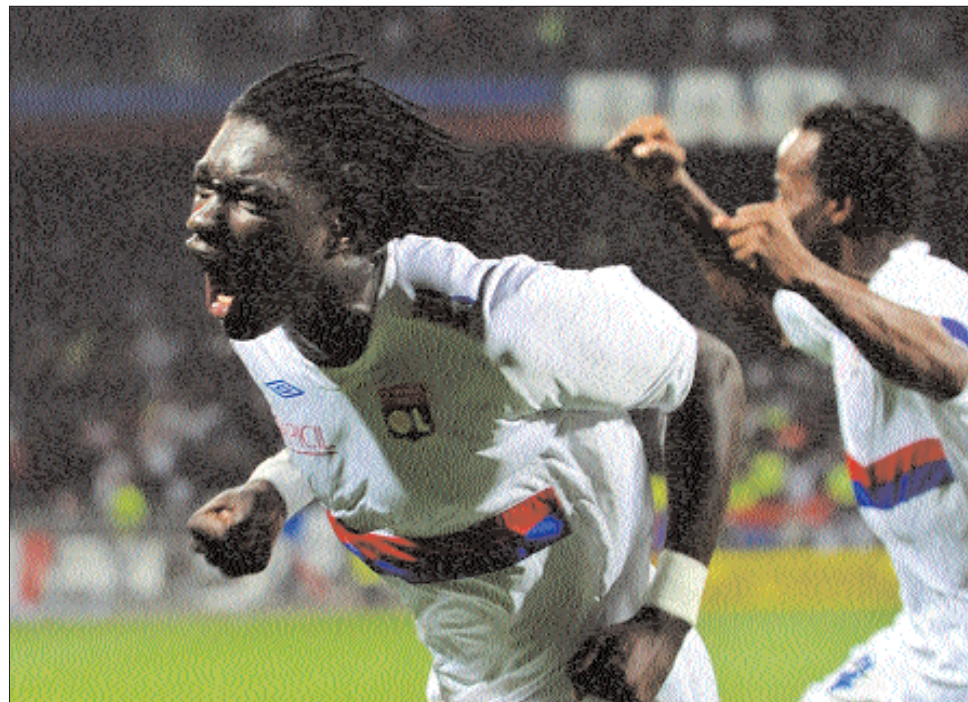
A szenegali Bafetimbi Gomis négy gólt lőtt a horvát bajnoknak a gyanús zágrábi mérkőzésen

Már biztos csoportgyőztesként a B betűjelű kvartettben, az Internazionale 2-1-re kika-