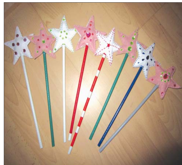
Hétfégi mellékletünk Életmód és Csodavár oldalait Orosz Anna szerkesztette