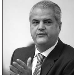
Adrian Năstase – „nem hiszek a véletlen egybeesésekben”

A múlttal előítéletek és gátlások nélkül akarunk szembenézni. De nem szeretnénk, ha a múlt magyarázatát híján, vagy manipulációk eszközével szolgálva elzárna előlünk a jelen alternatíváit. A másikban partnert akarunk látni: az eszmékben, a cselekedetekben és a mindennapi együttélésben. Nem akarjuk, hogy a mi provinciánk ezután is egy harmadrangú ország másodrangú tartománya legyen.