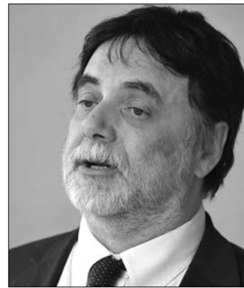
Matolcsy György gazdasági miniszternek kellene távoznia. A Jobbik szerint az Orbán-kormány

A szocialista politikus úgy vélekedett: a háttérben nem Fellegi Tamás feladatainak sokasága áll, hanem feltehetően az, hogy nem kíván tovább azonosulni „a magyar utas, dilettáns, idióta gazdaságpolitikával”, amelyet Matolcsy György és Orbán Viktor másfél éve folytat. Mesterházy Attila úgy véli, inkább