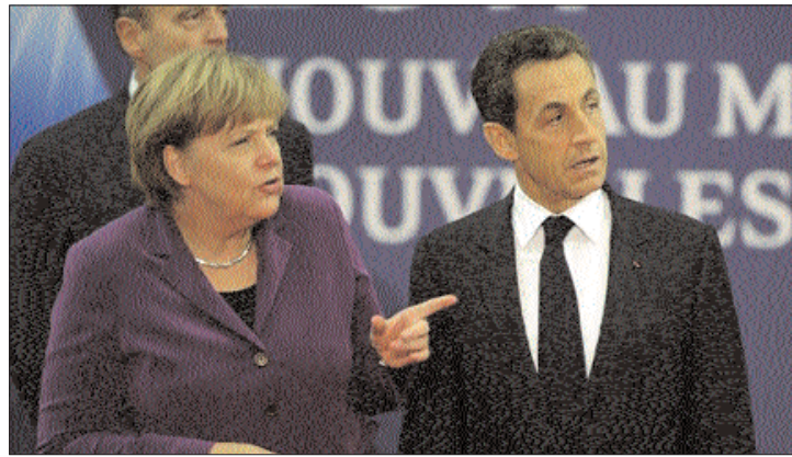
Tandemben. Angela Merkel és Nicolas Sarkozy az EU-csúcsertekezleten

▶ Informális vacsorával megkezdődött tegnap az EU állam- és kormányfőinek sorsdöntő csúcsertekezlete. Az érdemi tárgyalásokra ugyan csak ma kerül sor, de megfigyelők szerint az érdemi dolgok ilyenkor, fehér asztal mellett dőlnek el. 2. oldal ▶