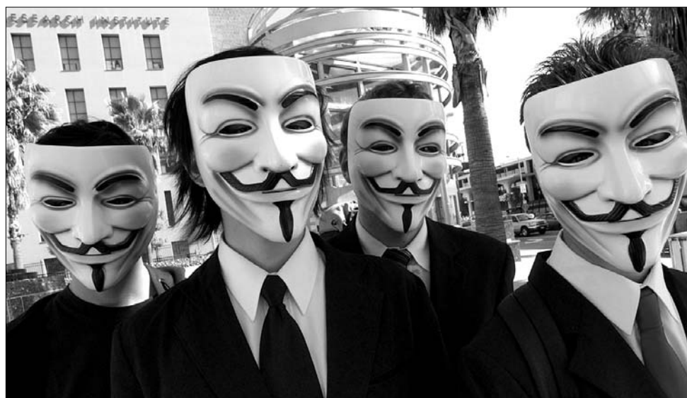
Guy Fawkes maszkja, egyben az Anonymous internetközösség ismertető jele

Négy évvel később viszont azt eszelte ki, hogy nem csak Jakab királyt kell megölni, hanem fel kell robbantani az egész parlamentet. A terv nem volt túl bonyolult, és később még tovább egyszerűsödött, amikor kiderült, hogy a katolikus hit elszánt védelmezői nem tudnak alagutat ásni az épület alá, ezért arra kényszerültek, hogy egész egyszerűen pincéket vegyenek helyette bérbe. Catesby, élve a remek lehetőséggel,