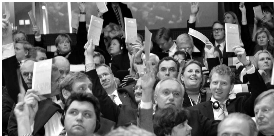
A szerdán este elfogadott kongresszusi dokumentum támogatja az egyéni vállalkozókra vonatkozó terveket

Az Európai Néppárt következő kongresszusát 2012. október 16–17-én Bukarestben tartják, ekkor fogadják el az EPP új politikai programját. Kovács az ÚMSZ-nek elmondta: az RMDSZ célja, hogy az őshonos nemzeti kisebbségekre külön fejezet térjen ki a dokumentumban. A főtitkár tájékoztatása szerint Wilfried Martens, az EPP elnöke határozott ígéretet tett szeptemberben arra, hogy a Néppárt programjának a módosításakor támogatja az RMDSZ-t abban, hogy a nemzeti közösségek jogai, az autonómia kérdése, mindazok a közösségi jogok helyet kapjanak a dokumentumban. ◀