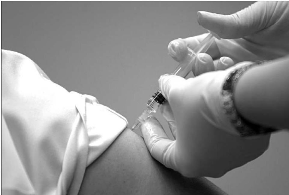
Különösen veszélyeztetettek a gyerekek: szigorítják a kanyaró és a rózsahimlő elleni oltásrendet