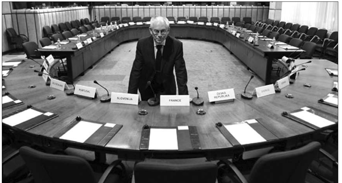
Herman van Rompuy már készülődik Brüsszelben. Az Európai Tanács elnöke nehéz feladat vár a vita vezetésében

Nicolas Sarkozy francia államfő tegnap úgy vélekedett: ha ma nem születik megállapodás az eurózóna gazdasági kormányzásáról, Európának nem lesz „második esélye”. „Azonnal dönteni kell. Minél tovább halogatjuk a döntést, annál drágább és kevésbé hatékony lesz” – fogalmazott Sarkozy Marseille-ben, az Európai Néppárt kongresszusán elmondott beszédében. „Európára még soha nem volt ekkora szükség, de Európa sem volt még ekkora veszélyben. Soha ennyi or-