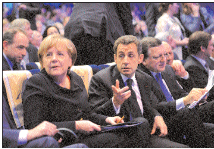
Angela Merkel, Nicolas Sarkozy és Manuel Barroso. Traian Basescu – takarásban

▶ Az EU-tagországok állam- és kormányfőinek péntek délután befejeződött, csaknem húszórás brüsszeli találkozásán arról született döntés, hogy új kormányközi szerződést készít az euróövezet 17 országa. A megállapodást Orbán Viktor magyar kormányfő nem írta alá, Traian Basescu román államfő viszont nagy támogatója az európai uniós pénzügyi fegyelem szigorítását célzó új szabályozási egyezménytervezetnek. Basescu – a hazai közvélemény és politikai szereplők megkerdezése nélkül – el is kötelezte Romániát az új kormányközi egyezmény mellett. 2. és 4. oldal ▶