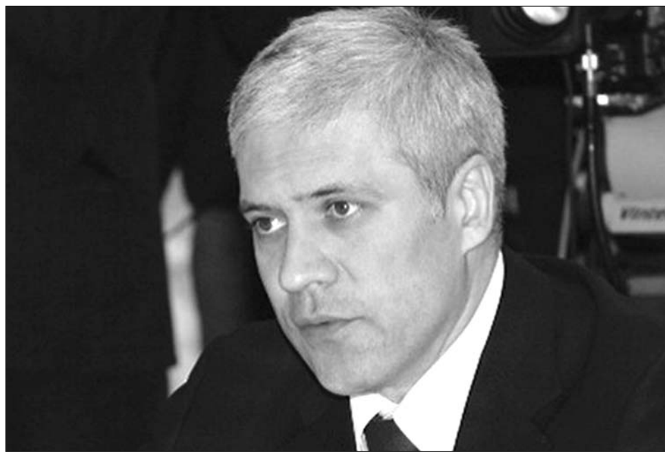
Boris Tadić, Szerbia elnöke: Szerbia útja az Európai Unióba vezet Szerbia jövője

„Pozitív döntés született a mai napon: az Európai Unió kapuja nyitva áll Szerbia számára” – nyilatkozott Schöpflin György fideszes EP-képviselő az uniós állam- és kormányfők döntése nyomán. „Örömmel üdvözlöm, hogy Szerbia tagjelölti státusának kérdését az EU nem utasította el, hanem legkésőbb márciusban hozza meg erről a döntését. Bár Szerbia sokat tett a feltételek teljesítéséért, az EU ténylegesen szeretne meggyőződni Szerbia Koszovóval való jó kapcsolatáról, épp ezért a megkezdett Belgrád–Pristina-párbeszédet folytatni kell” – hangsúlyozta Schöpflin.