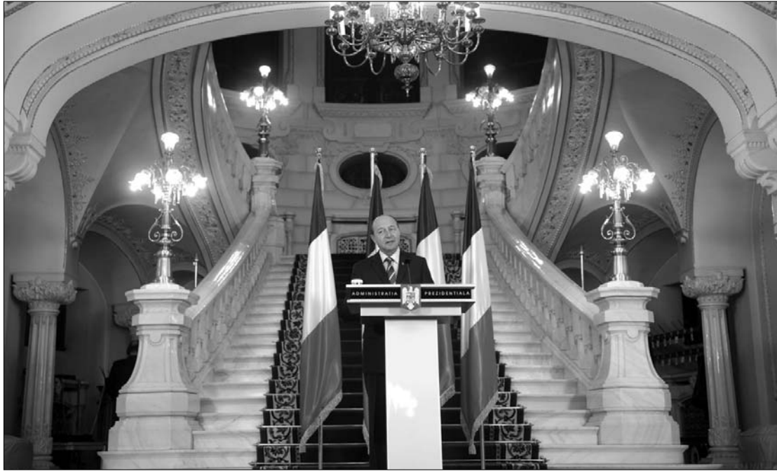
Traian Băsescu csak azután hívta konzultációra a pártokat, hogy előzőleg már elkötelezte az országot