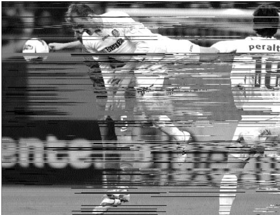
Kapetanosz gólt fejt a CFR első és – mint utólag kiderült – utolsó nagy helyzetéből.

A szombati esti Steaua-CFR 1907-mérkőzésre 45 ezernél is többen voltak kí-