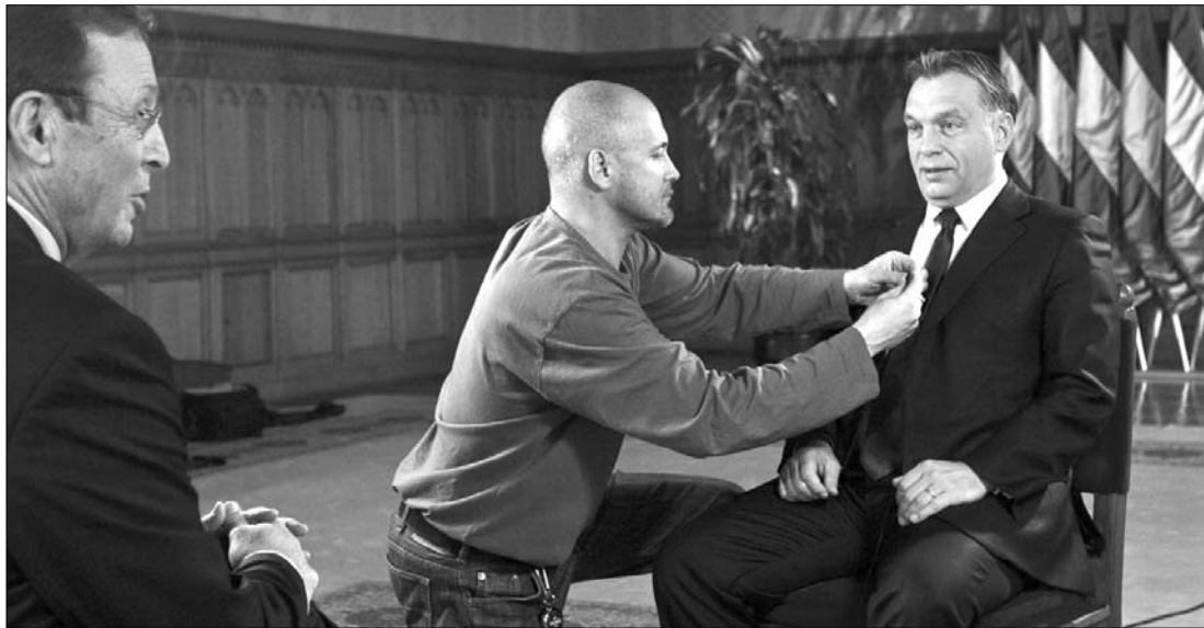
Orbán Vikort tévéinterjúra készítik. A magyar kormányfő nem akar lemondani Magyarországot szuverenitásáról.