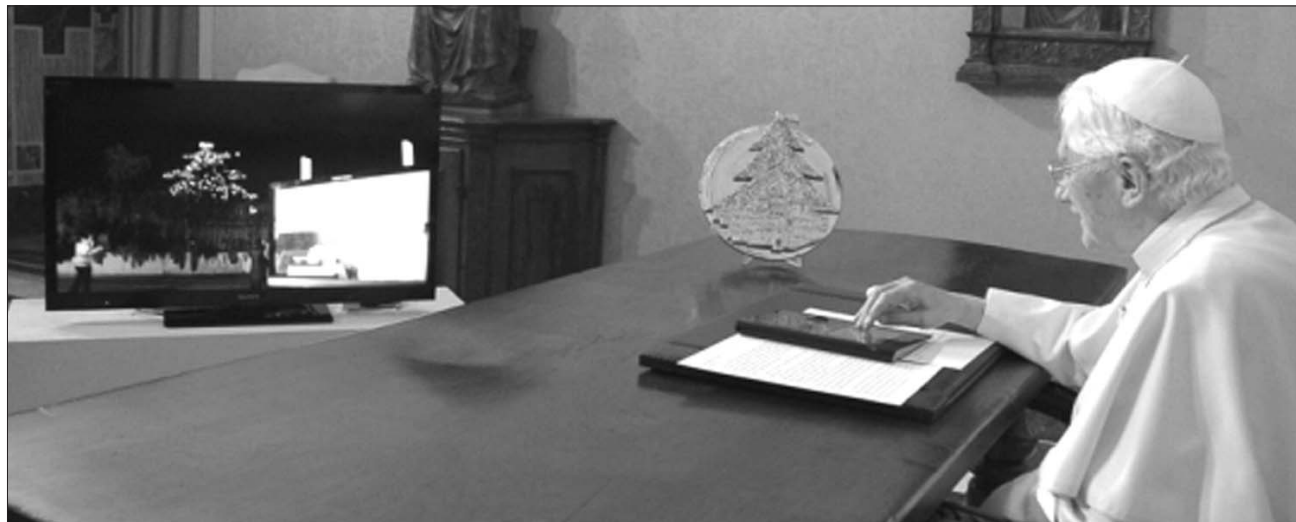
A „technika ördöge” sem fogott ki a pápán. XVI. Benedek egy táblagép segítségével gyűjtötte meg a gubbiói karácsonyfa díszkivilágítását