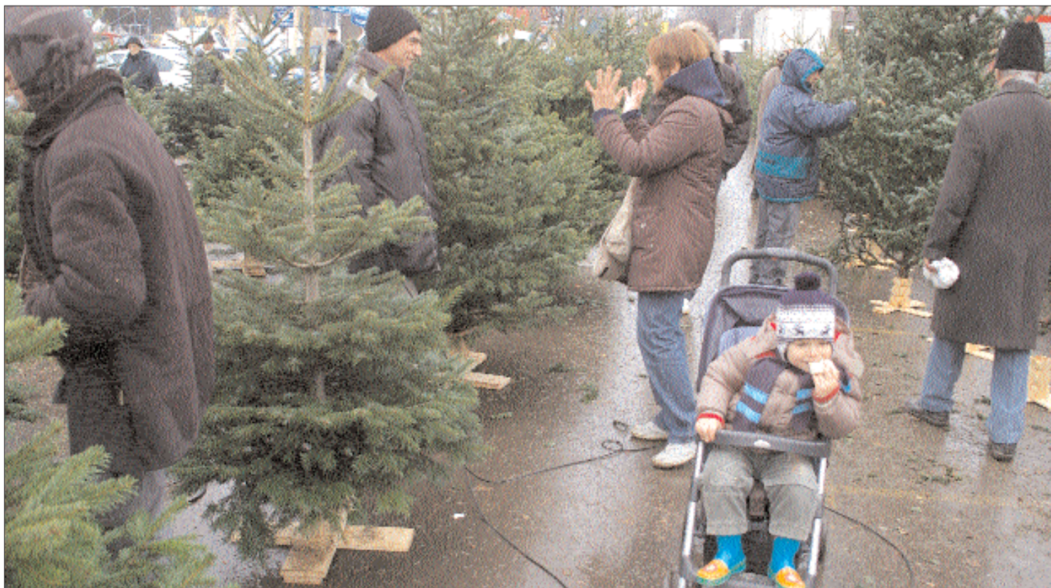
Az angyal napok múlva jön, de a karácsonyfát már ki lehet választani. A bukaresti Obor-piacon tegnapi ottjártunkkor nagy volt a nyüzgés.

Rendszabályozni igyekeznek a karácsonyfa-kereskedelmet a hatóságok