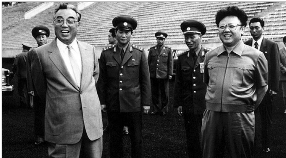
A két Kim együtt. Balra a Szeretett Kim Ir Szen, jobbra a Kedves Kim Dzsong Il

nem fogadták, nemkívánatos személy volt. Ezeket az utazásait is csak utólag hozták hivatalosan a köz tudomására, esetleg az amerikai kémhálózatok felvételei leplezték le, hogy a titokzatos szerelvény elhagyta Phenjan. Ez a páncélvonat amolyan védjegyévé vált, és mi csoda tréfája a sorsnak: a végzetes szívinfarktus is luxusmódra fölszerelt vagonjában érte, menet közben, ismeretlen úti céllal; állítólag „szokásos vidéki szemleútján”. A 69 éves korában elhunyt észak-koreai vezető, hivatalosan a Nemzetvédelmi Bizottság elnökét, mivel az államfői tisztséget névleg a parlament elnöke viseli, helyi idő szerint szombat reggel (közép-európai idő szerint péntek éjjel) érte a halál – közölte az állami televízió bemondója, könnyeivel küszködve. A KCNA állami híregyénység közlése szerint a Kedves Vezetőt (ez volt állandó eposzi jelzője, mivel a Szeretett Vezető megszólítás apját, az „államalapító” Kim Ir Szent illette meg, és máris fölvetődik a kérdés: vajon mi-