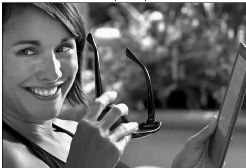
Az elektronikus könyvvel rendelkezők fele szívesen lemond a hagyományos könyvekről

A könyvkereskedéseket a megszűnés fenyegeti – vélik a Creative Strategies szakemberei, akik szerint az e-könyvek felfutása növeli az emberek érdeklődését az olvasás iránt. A felmérések azt mutatják, hogy akinek van e-könyve, többet költ olvasásra. ◀