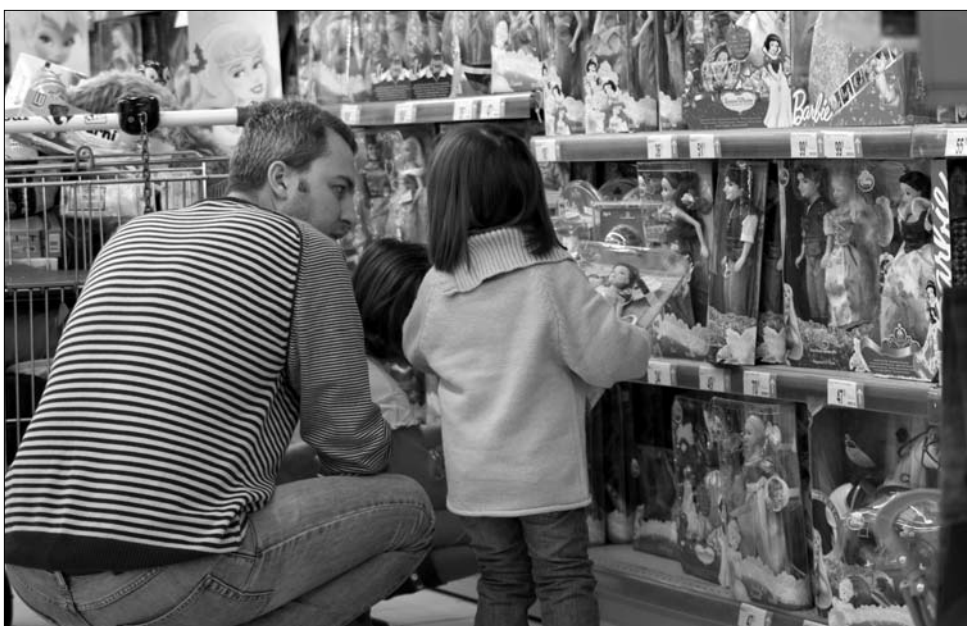
Sok szülő egyhavi minimálbérenek megfelelő összeget költ karácsonykor játéokra

Anélkül, hogy pontos ada-tokkal szolgáltak volna (a konkurencia miatt), a Diverta üzletláncolat mű-ködtetői a Ziarul Financiar megkeresésére elmondták: a tavalyihoz képest 5-7 száza-lékos forgalomnövekedésre számítanak idén. A Smart Toys játékgazdálkodó képvise-lői úgy nyilatkoztak: az el-adások a karácsonyi ajándé-kozási hajrában megközelít-hetik a 200 ezer eurót – szemben az év többi hónap-jában elért 20 ezer euróval, ami tízszeres növekedést jelent. Igaz, az ügyfelek becsa-logatása érdekében a marke-tingsztályok is mélyen a zsebükbe nyúlnak: decem-