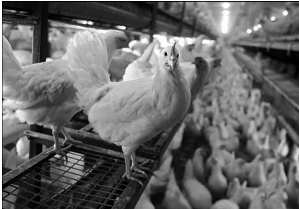
Az uniókonform 3-as jelzésű tojás immár „luxuskörülmények” között, boldogabb tyúkoktól jön világra

„A csalást nem lehet ki-zárni, azonban remélem, az ellenőrzések, illetve a termelők egymás közötti versen-gése hatékony eszköz lesz majd arra, hogy kizárjuk a feltételeket be nem tartókat” – fejtette ki lapunknak Csutak Nagy László. Az Országos Állategészség-ügyi és Élelmiszerbiztonsági Hatóság alelnöke elmondá-sa szerint a tojók életkörülményeinek jobbá tételére vonatkozó felkészülés már évek óta zajlik az országban, hisz másként nem lehet egyik pillanatról a másikra