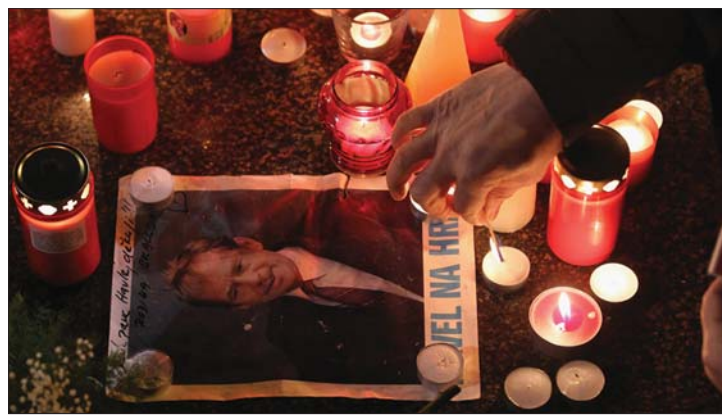
Gyertyák gyúltak Václav Havel emlékére a prágai Vencel téren

csehek, hanem az egész világ gyászolja. Traian Băsescu a bukaresti cseh nagykövetségen róttá le kegyeletét. 2. oldal