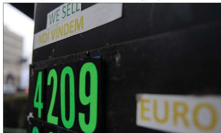
Az euró árfolyama a 4,2 lejes szint alá süllyedhet a napokban

süllyedhet. Jeffrey Franks valuta-alapi küldöttségvezető ugyanakkor attól tart, hogy nyomás alá kerülhet a lej, ami tőke kivonásokkal is együtt járhat. 6. oldal ▶