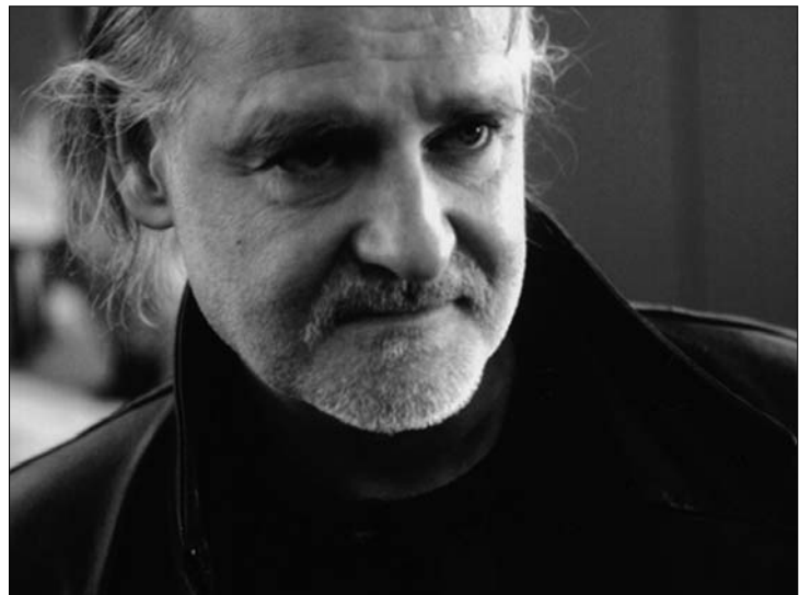
Tarr Béla egységes egésznek tekinti a magyar mozgóképkultúrát

vánja az egész magyar mozgókép-kultúra minden területét, nyitni kíván a mozgóképes szakma minden irányába, és határozottan kíván fellépni ezek védelmében. Mint írták, a szövetség új vezetése a magyar mozgókép kultúrát egységes egésznek tekintti, minden filmműfajnak és minden mozgóképes megjelenési formának, valamint a filmgyártáson túl a forgalmazásnak, a moziknak és a szaksajtónak is érdekképviselője kíván lenni. A több mint ötven éve működő szervezet „konstruktív és offenzív magatartást” ígér a jövőben. „A szövetség meggyőződése, hogy a magyar mozgókép a magyar nemzeti kultúra elválaszthatatlan és az európai kultúra integráns része, ezért kötelességének tartja ennek védelmét és az ehhez szükséges normális működés feltételeinek megteremtését” – áll a kommunikében. Hangsúlyozták azt is: a Magyar Filmművészek Szövetsége mindent meg kíván tenni annak érdekében, hogy a filmszakma megőrizhesse autonómiáját, méltóságát és tisztességét. ◀