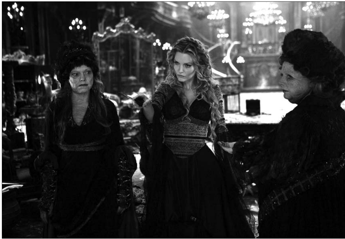
A köztévék olcsóbb filmekkel és ismétlésekkel, a kereskedelmiek viszont hollywoodi produkciókkal karácsonyoznak