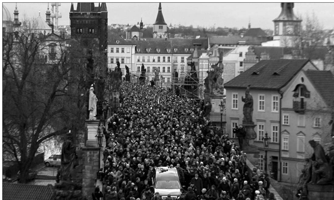
Tízezrek kísérték Václav Havel gyászmenetét a prágai Várba. A koporsót cseh állami zászlóval takarták le

Václav Klaus a kegyeleti aktus végén elmondott beszédében hangsúlyozta: Havel neve örökre összefonódott a szabadsággal, s az egész világban jelképe lett a kelet-európai rendszerváltásnak.