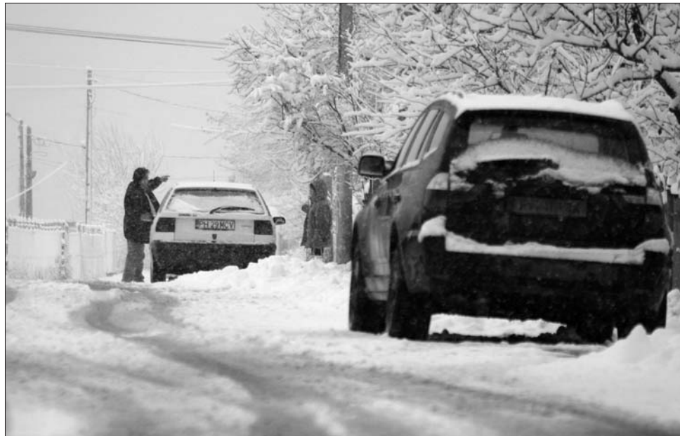
Ahhoz képest, hogy a hó későn hullott le, sok a téli közlekedésre alkalmatlan autó.

„Idén későn köszöntött be a havazás, jellemző, hogy a hóesést olvadás, majd újabb fagyás váltja fel, az újabb havazás pedig eltakarhatja az időközben keletkezett jégpáncélt. Ez okozhatja a legtöbb gondot” – nyilatkozta Ion Păun brassói meteorológus, aki a karácsonyi-szilveszteri szünet alatt téli üdülésre készülőknek azt tanácsolja: csakis jó műszaki állapotban