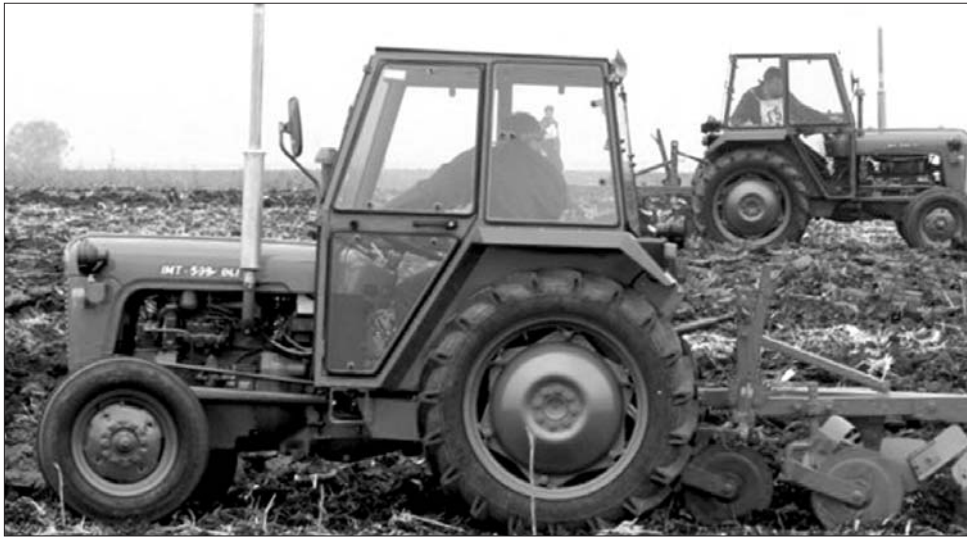
A hazai gazdák a válság dacára sem mondtak le arról, hogy mezőgazdasági gépekbe ruházzanak be

A dolog különös jelentősége az, hogy éppen abban a megyében kellett idén 28 mezőgazdasági szaktanfolyamot indítani – amelyen 650 személy szerzett diplomát –, ahol az elmúlt években a megművelhető területek csaknem egyharmada paragon hevert. A számok reménykeltő növekedése arra utal, hogy az élelmiszeráraknak az utóbbi időben tapasztalt nagyarányú növekedése ösztönzőleg hat a gazdálkodókra: egyre többen mondják, hogy most már érdemesebb több búzát, kukoricát, zöldséget, gyümölcsöt, tejet termelni. Ráadásul az egész világra kiterjedő pénzügyi-gazdasági válság és a velejáró munkanélküliség is arra készteti a vidékhez kötődő embereket, hogy a tulajdonukban lévő földből hasznot hajtsanak.