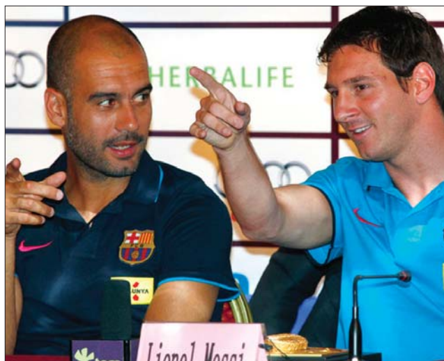
Az Év edzője és az Év játékos: Pep Guardiola és Lionel Messi

A tekintélyes magazin díjátadóján elismerést kapott még a brazil FC Santost erősítő Neymar, aki az Év legjobb fiatal futballistája lett. A World Soccer 1982 óta ír ki szavazást, tehát az idej volt a 30. a sorban. ◀