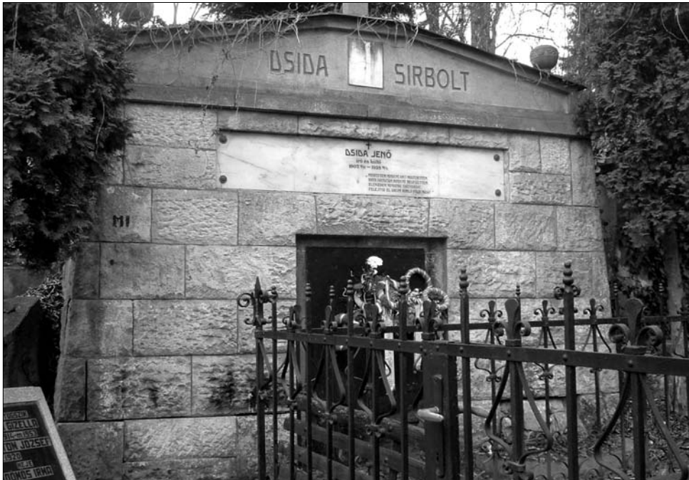
A Házsongárdban bekövetkezett rongálás után közel 400 sírhelynek biztosítanak kiemelt védeltséget

„A polgármesteri hivatal folyamatosan akadályozta a munkánkat. Mióta kérvényeztük a műemlékké való nyilvánításokat és listán nevesítettük a sírokat, azóta mint valami bűnözőket követnek a polgármesteri hiva-