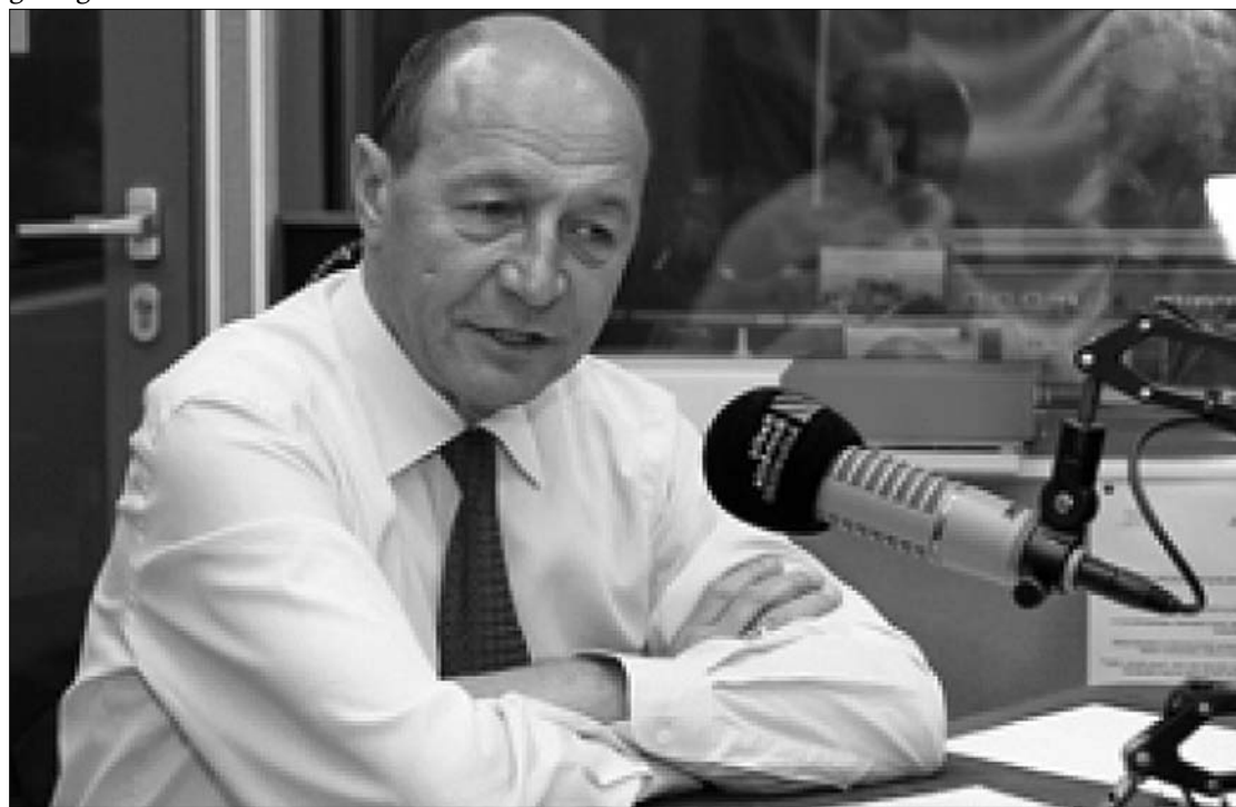
Traian Băsescu a rádióban. Az államfő a reformok kerékkötőjének tartja az RMDSZ-t

Az államfő már nem ragaszkodik ahhoz, hogy a jövő év végéig Románia alkotmányába foglalják a legutóbbi EU-csúcson körvonalazódó kormányközi megállapodás előírásait. Traian Băsescu a közszolgálati rádióban elmondta, azt szeretné, ha az előírások csak 2015-ben, Románia euróövezethez történő csatlakozásának évében kerülnek be az alaptörvénybe, és ezt már jelezte az EU-tagállamok bukaresti nagyköveteinek is. Az államfő a pártokkal folytatott konzultáción vonta le azt a következtetést, hogy – bár a kormányközi megállapodást valamennyi politikai alakulat támogatja – az alkotmánymódosítás „hosszadalmas alkudozás” tárgya lesz. „A pártok mindenféle feltételekhez kötik az alkotmánymódosítást” – tette hozzá. Többek között arra utalt, hogy a nagyobbik kormánypárt máris jelezte: azt szeretnék, ha egy füst alatt az egykamarás parlamentre vonatkozó előírás is az alkotmányba kerülne.