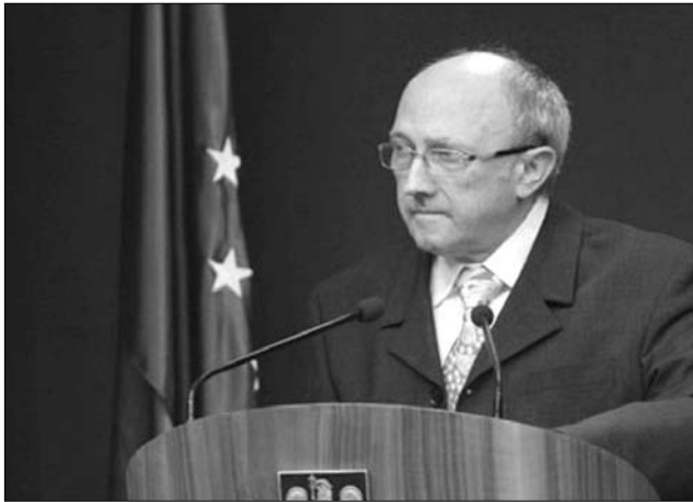
Ritli László egészségügyi miniszter. Üllő és kalapács között?

A Valutaalap szakértői azonban általánosságban megállapítják: az elnöki hivatal-féle jogszabály több előírása homályos és pontatlan; nem rendezi az egészségügyben felhalmozódó adósságok kérdését, nem írja körül a pénzügyi ellenőrzési mechanizmusokat, nem ad megoldást az egészségügyi szolgáltatások színvonalának emelésére. Az IMF nehezményezi, hogy a törvény szerint az egészségügyi ellátásban továbbra is aránytalanul nagy szerep járul a kórházakra és kis szerep jut a megelőzésnek. A szakértők hangsúlyozzák, a törvény kerettörvényről van szó, csupán a másod-