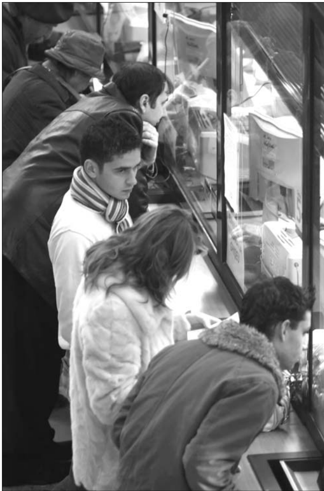
Sok helyen még a jelenlegi adókat is alig tudja befizetni a lakosság

Mint korábban beszámoltunk róla, az erdélyi önkormányzatok nem terveznek jövőre adóemelést, ellenkezőleg: igyekeznek adókönyvnyitásokkal a lakosság segítségére sietni. A lapunk által