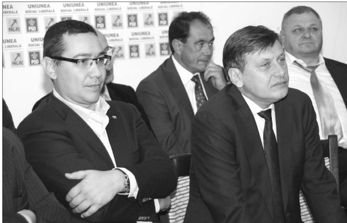
Crin Antonescu és Victor Ponta USL-társelnökök korábban 70 százalékos USL-győzelmet jósoltak maguknak

Az IMAS adatai szerint könnyen elképzelhető, hogy a választások kimenetelét nem a szavazati joggal élők, hanem a távol maradók döntenek el. Pontosabban az lesz rendkívül fontos mindkét fél számára, hogy passzív támogatóit milyen mértékben tudja rábírní a voksolásra. A közvélemény-kutatás azt mutatja, az utóbbi két év alatt 10 százalékkal – 25-ről 35 százalékra – nőtt azoknak az aránya, akik nem szavaznának, vagy nem tudják, hogy kire szavaznának. ◀