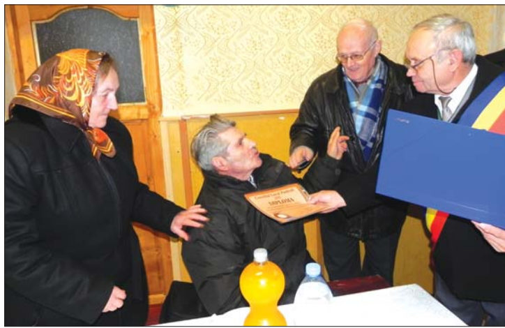
Az ünnepeltek Hűség-diplomát kaptak a polgármestertől

▶ Hagyományteremtő módon ötven aranylakodalmas házaspárt köszöntött tegnap a Szatmár megyei Pálfalva önkormányzata. Az idős házastársak Hűség-diplomát és csekély pénzajándékot vehettek át a polgármestertől. 7. oldal ▶