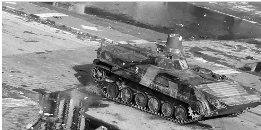
Homszban a kormányerők ismét a tömeg közé lőttek. Szíriában nem csillapodnak a rendszerváltást követelők

harmadik napja ostromlott Homsz városába, de a nem szűnő harcok miatt nem tudják végezni a dolgukat. Közben lelőtte egyik évfolyamtársát, négy másikat pedig megsebesített egy diák tegnap a Damaszkuszi Egyetemen – jelentette a SANA hivatalos szíriai hírügynökség. A közlés nem számolt be a lövöldöző diák indítékáról, jogvédő szervezetek azonban úgy vélik: rendszertámogató diákok akciójáról lehet szó.