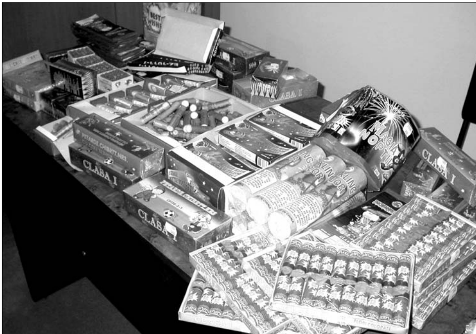
Elkobzott áru: a 3 grammnál nagyobb robbanóanyag-tartalmú tűzijátékok nem forgalmazhatók