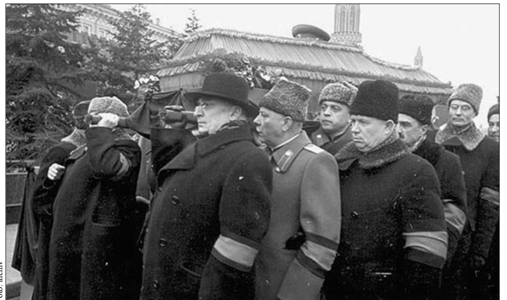
Pártvezérek Sztálin koporsójával. Szemüvegben Berija, kettővel mögötte Hruscsov, aki utóbb kivégeztette

Moszkva olyan volt, mint a felbolydult méhkas. Végelát-hatatlan tömeg hömpölygött a központ felé, hogy ott legyen a „vezér” temetésén. Az emberek többségének azonban nagyon is nyomott volt a hangulata. Dmitrij Jazov egykori szovjet védelmi miniszter akkor a leningrádi katonai körzetben szolgált, s a tiszteket már valamivel azelőtt összehívták, mint hogy a rádióban a híres bemondó, a moszkvai rádió ércecs zengésű „hangja”, Jurij Levitan megtörtén beolvasta volna a gyász hírt. „Mindannyian sírtunk. Frontot járt katonákként számunkra Sztálin nem egyszerűen egy név volt. Ő volt a főparancsnok, a védelmi bizottság elnöke, hadügyi népbiztos, és csak ezután főtitkár. Vele indultunk rohamra: a Hazáért és Sztálinért! Egyetlen olyan aljas ember volt csupán képes meggyalázni ezt a nevet, mint Hruscsov. De maguk, fiatalok, nem érthetik, mit je-