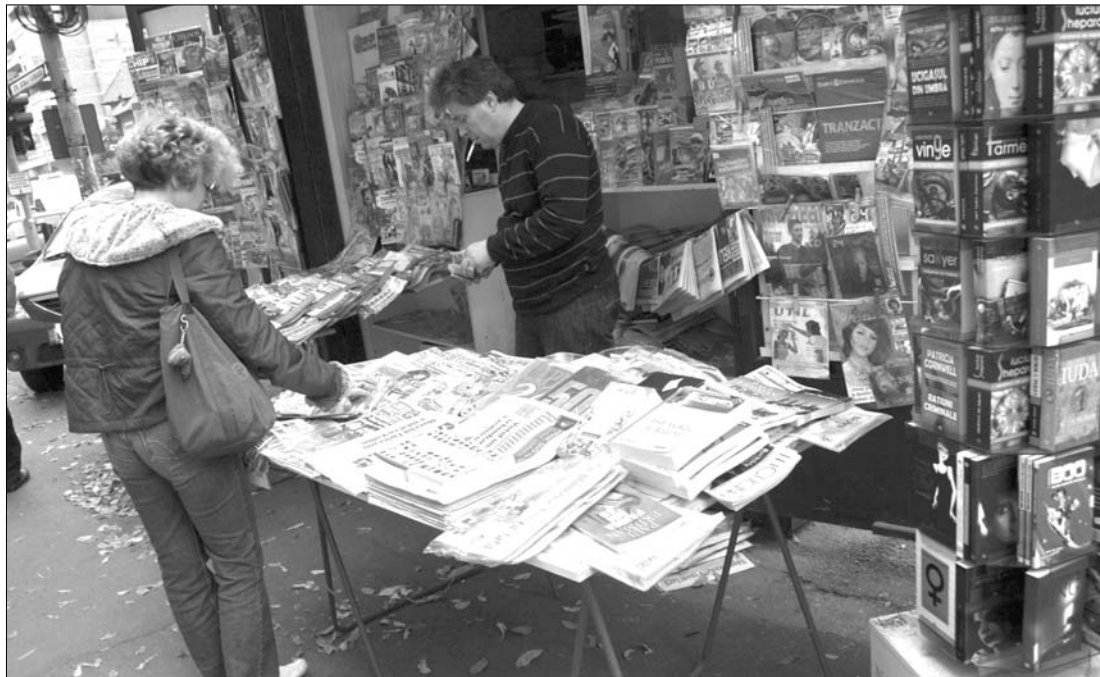
„A szakmán belül érvényesülő szelekció” példányszámcsökkenéssel tizedelte idén az írott sajtót

Csaknem száz év után, 2011. január 28-án magyar nyelvű újság jelent meg Maroshévizen, Maroshévízi Hírlap címmel. A Hargita megyei kisvárosban az első helyi újságot 1895-ben adták ki Top-