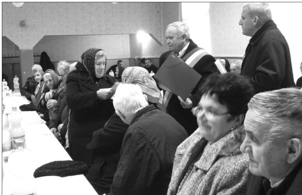
Az ünnepeltek – bevallásuk szerint – nem a pénznek, hanem a figyelemnek örvendtek

Az idős házaspárok köszöntése jó hangulatban elköltött közös ebéddel zárult. ◀