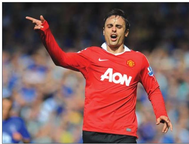
Dimitar Berbatov triplázott hétfőn este a Wigan otthonában

Zsinórban harmadik bajnokiján játszott 1-1-es döntetlent a Chelsea, amely nem bírt hazai pályán a Fulhammal. Az élvonal Manchester City 0-0-ra végzett a West Bromwichcsal, így a