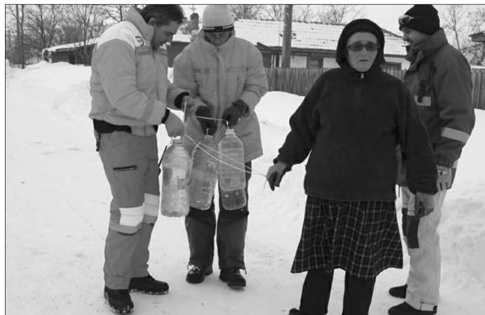
Az Erdély Mentőcsoporthoz tartozó tagjai vizet osztanak a Buzău megyei Lunca faluban