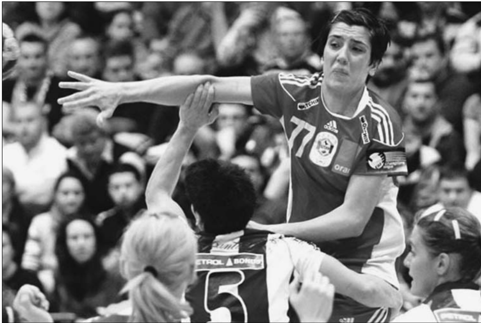
A Buducnost blokkolta az Oltchimet, a román bajnok tíz góllal maradt alul

A férfi Bajnokok Ligájában már korábban eldőlt, hogy a Szeged nem jut tovább a csoportból, de a magyar szurkolók így is örültek Skaliczki-gárda hétvégi 31-21 arányú Belgrádi Partizan elleni győzelmének. A Szeged jövő vasárnap a León vendégeként zárja a sorozatot, s bár matematikailag elérheti a Montpellier-t, az egymás elleni összevetésben rosszabb a francia alakulathoz. A D csoport állása: 1.