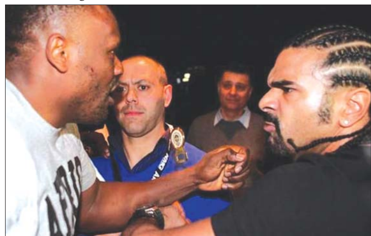
Derek Chisora (balra) mindenkibe belekötött a hét végén

Chisora amúgy már a bunyó előtt kapott egy büntetést, mert Jose Sulaiman, a WBC elnöke szerint szégyen, hogy megpofozta Vitalij Klicskót. A brit bunyóst ezért 50 ezer dollárra büntették, amit egy németországi és egy a WBC által alapított, gyermekeket támogató alapítványnak fogják utalni. ◀