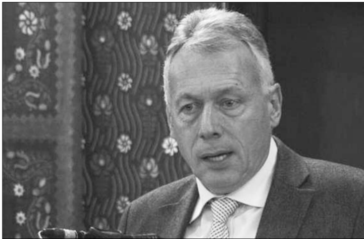
Borbély László miniszter, az RMDSZ politikai alelnöke

A népes hallgatóság kérdéseire válaszolva Kelemen Hunor ismertette az új kormányprogram és a megkötendő koalíciós megállapodás részleteit, hangsúlyozva, a lakosság életszínvonalának emelésére vonatkozó intézkedések közül a legfontosabb a fizetések és nyugdíjak emelése az első negyedév gazdasági és költségvetési adatainak megfelelően. Az RMDSZ elnöke elmondta, olyan komplex kormányprogramot állítottak össze, amely lehetővé teszi, hogy 2012 végéig, a parlamenti választásokig a kormány olyan intézkedéseket hozzon, amelyek könnyítenek az emberek életén, ugyanakkor jelen-