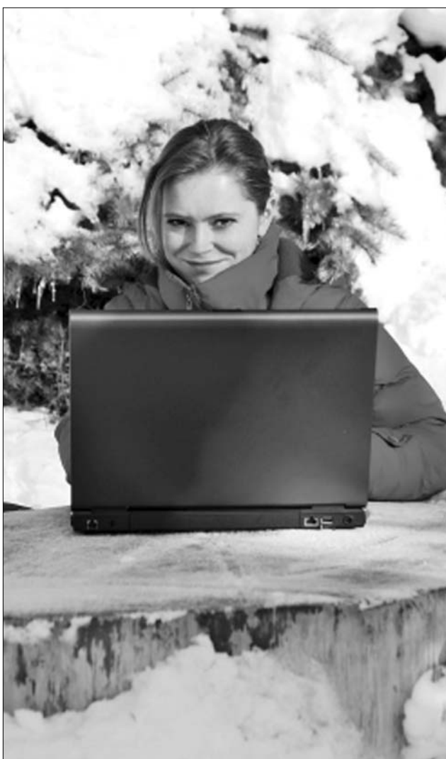
A számítástechnikai készülékek is érzékenyek a hidegre – a szó szoros értelmében lefagyhat a rendszer

Nehezebb feladat okostelefonjainkat megóvni a hideg hatásaitól, hisz azok mindennapjaink részeként mindenkor és mindenhol velünk utaznak. A beparásodást elkerülendő, érdemes ezen készülékeket is a meleg lakásba érkezéskor egy páraszegényebb helyre tenni – például az előszobába – ahol akklimatizálódhatnak. A pára az érzékeny nyomtatott áramkörök oxidációjához is vezethet, ez