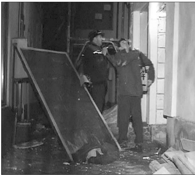
A második robbanás károkat okozott az épületben.

Az első robbanás helyi idő szerint hajnali egy óra körül történt, amikor a szórakozóhely női mosdójában egy lány cigarettára gyújtott. Ebben a robbanásban tizenhaten sérültek meg, valamennyien 16 és 23 év közötti lányok. Hat lány sérülései súlyosak, esetükben első-, másod-, és harmadfokú égé-