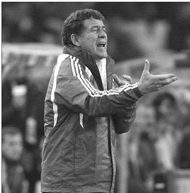
Otto Rehhagel 2004-ben Európa-bajnoki címig vezette a görögöket

Spanyolországban magabiztos győzelmet aratott a Real Madrid a Racing Santander felett az élvonalbeli labdarúgó-bajnokság 23.