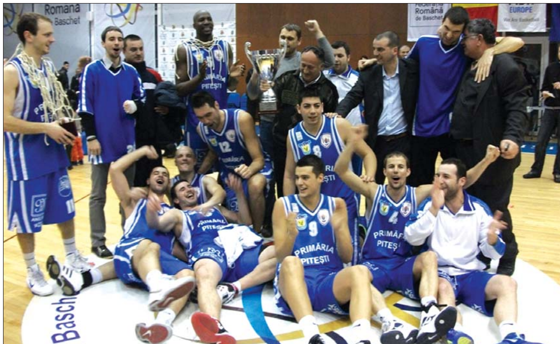
Öröm a pályán. A legkevésbé esélyes pitești-iek bravúros győzelmet arattak a Román Kupában

A bronzmeccsen a harmadik negyed végeredménye (26-13) döntött, a váradiai 77-74-re verték a CS Municipalt. A fináléban is váltakozó sikerrel szerepeltek a csapatok, a temesváriak 43-36-ra nyerték az első, a pitești-iek pedig 55-35-re az utolsó két negyedet – s vele együtt a mérkőzést, 91-78. A