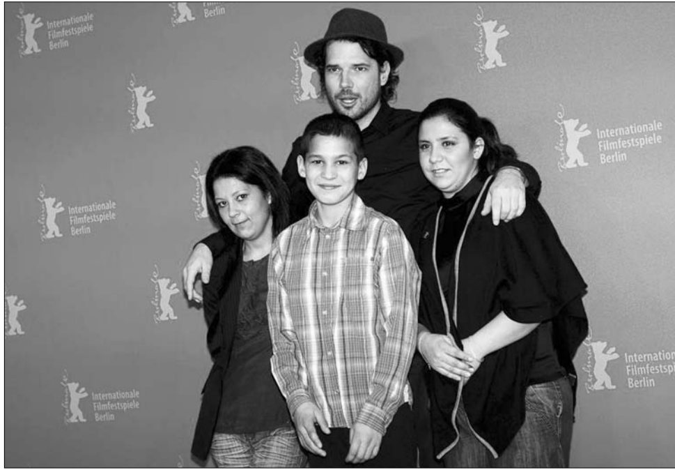
Fliegauf Bence a Csak a szél című filmben játszó amatőr színészekkel

Fliegauf Bence a második magyar rendező Tarr Béla után, aki megkapja ezt a rangos elismerést. A film egy roma család egyetlen fiktív nyári napját meséli el, amelyre feszültség és kiszolgáltatottság nyomja rá bélyegét, egészen a végkifejletig. A Csak a szél az Ezüst Medvétől kívül két független