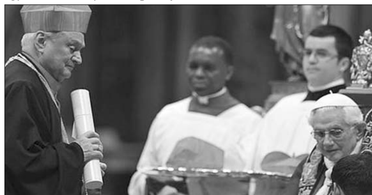
Lucian Mureșan átveszi a bíborosi kinevezést XVI. Benedek pápától

is. Közben a Financial Times legfrissebb információi szerint az éppen súlyos adósságválsággal sújtott Olaszországban a Mario Monti vezette szakértői kormány a katolikus egyházat, ezen belül a Vatikánt is megadóztatná. A radikális és egyben vakmerő lépéssel teljes egészében eltörölnék az egyház adómentességét, így a tulajdonában lévő kereskedelmi célokra felhasznált ingatlanokból – iskolákból, múzeumokból, könyvtárakból, kórházakból, hotellekből, utazási irodákból – több száz millió eurós bevételre tehetne szert az olasz államkassza. ◀