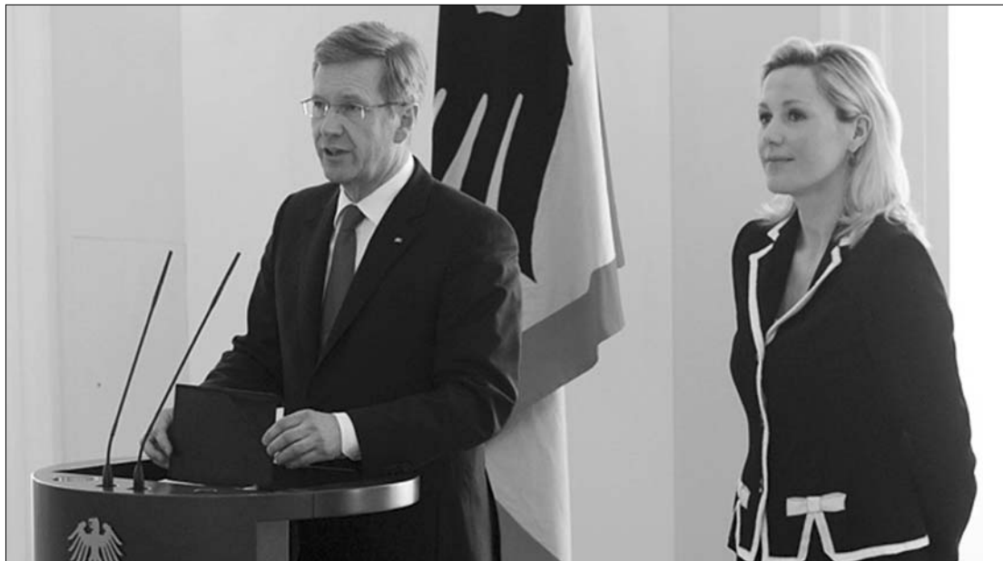
Cristian Wulff sajtótájékoztatót tartott lemondásáról. Feleségével, Bettinával azonnal távozott a rezidenciából