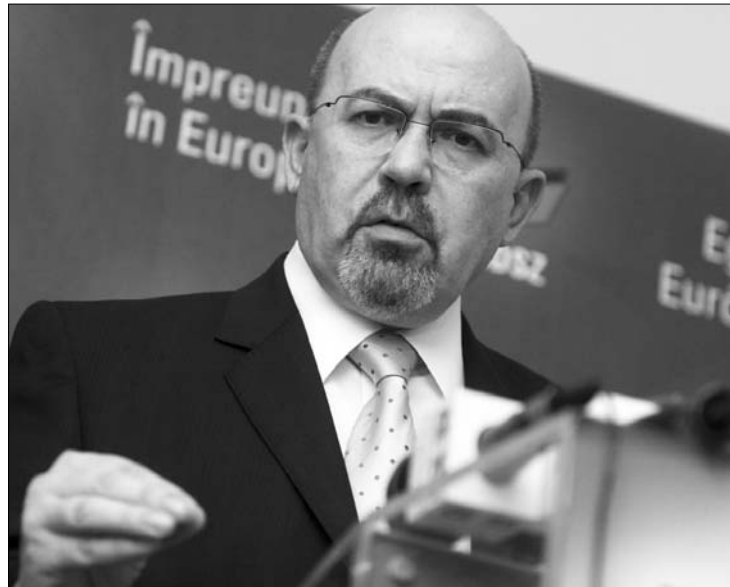
Markó Béla kész feltenni tisztségét a MOGYE érdekében

Mint korábban írtuk, a koalíciós alakulatok egy nappal korábban is asztalhoz ültek a MOGYE-ügy rendezése céljából. A hétfői tárgyalások után Markó Béla arról számolt be az Erdélyi Magyar Televíziónak (ETV), hogy a koalíciós tanácsban éles vitát folytattak a kérdésről. „Számomra teljesen világos: kormányhatározaton kívül más megoldás nincsen, az most már néhány nap kérdése, hogy ezt megoldjuk-e. Nincsen szó arról, hogy elfogadjam, valaki is akár heteket halogassa a megoldást” – fogalmazott a miniszterelnök-helyettes. Hozzátette: azt várja a partnerektől, hogy foglaljanak állást. „Vagy á-t mond, vagy b-t mond ez a koalíció, és attól függetlenül viszonyul az RMDSZ ehhez a kérdéshez. A mi álláspontunk nem változott: sürgősen kormányhatározattal kell ezt a kérdést rendezni” – nyilatkozta az ETV-nek Markó Béla, aki utalt a magyar tagozat létrehozása ellen szervezett hétfői marosvásárhelyi román diák-tüntetésre is.