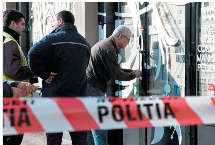
A bukaresti helyszínelők tizenegy töltényhüvelyt találtak

másik nőt, további hat személyt pedig megsebesített egy fővárosi fodrészben. Gheorghe Vlădan azt állítja, nem emlékszik a történetekre. 4. és 7. oldal ▶