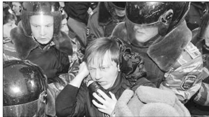
A karhatalom brutalitása. Országszerte tiltakozik az ellenzék