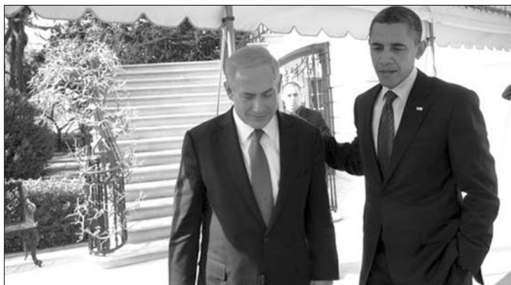
Netanjahu és Obama. Megakadályoznák, hogy Irán atomfegyverhez jusson

Eközben nyilvánosságra került, hogy egyéves szünet után ismét mozgásba lendülnek az atomtárgyalások Iránnal: miközben Izrael háborús fenyegetései egyre kézzelfoghatóbbá válnak, az EU annak a pártján van, hogy ismét fölvegyék a tárgyalások fonalát az iráni atomprogramról. Catherine Aston kül- és biztonságpolitikai főmegbízott abban reménykedik, hogy Teherán konstruktív szerepre törekszik, és kimutatja jóindulatát. Ugyanakkor egyes mérési eredmények, amelyekről mások mellett a Die Welt című német napilap is beszámolt, azt mutatják, hogy Észak-Korea 2010 folyamán két titkos kísérleti atombombarobbanást is végrehajtott, amelyek közül legalább az egyik iráni volt. ◀