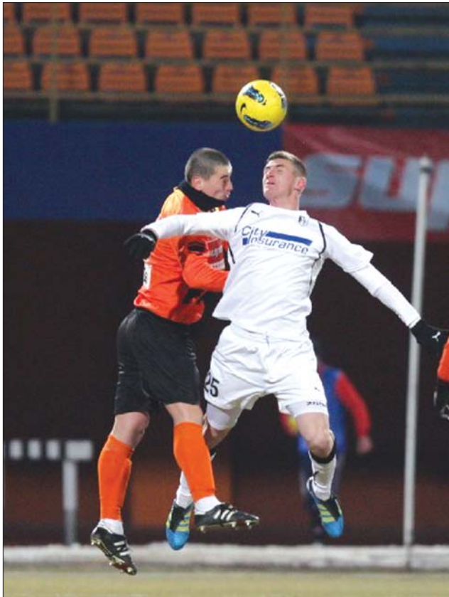
Megküzdött a három pontért a Sportul Studentesc

A 19. forduló 17 góljával a találatok száma 399-re nőtt, a megoszlás 225-174. Ploiești-i tizenegyesével a vaslui Wesley Lopes utolérte a góllövőlistát vezető Marius Niculaét (Dinamo), 14 alkalommal köszöntek be az ellenfeleknek. Dănciulescu (Dinamo) 9, Rusescu (Steaua) 7, Oprița (Petrol) és Weldon (CFR 1907) pedig 7-7 gólt lőtt, utóbbi azonban már nem léphet előrébb, hiszen Kinába igazolt Kolozsvárról. Öt játékos rúgott 6, további tíz pedig 5 gólt. Három játékos mellett egy edzőt