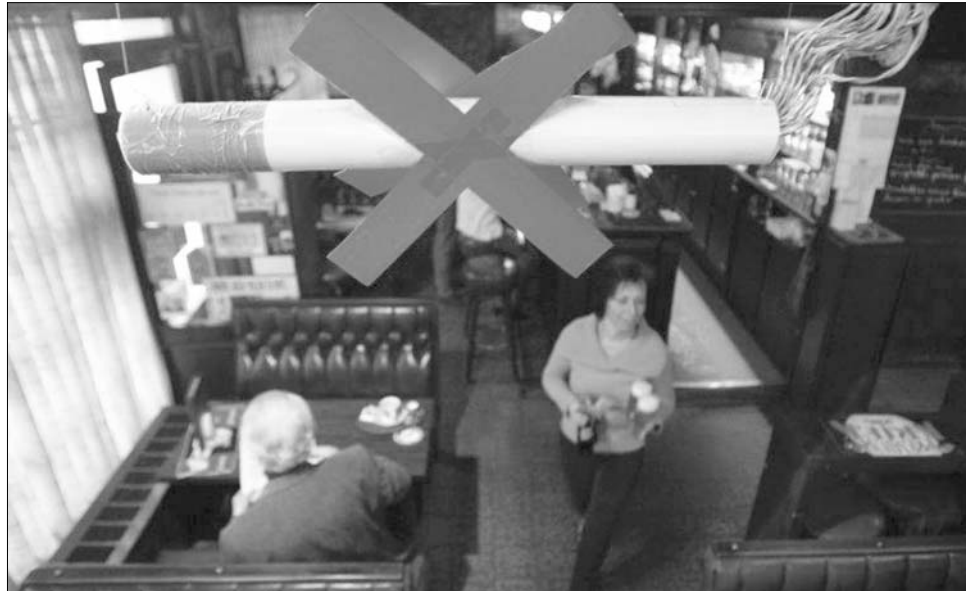
Az EU több tagállamában valamennyi zárt légtérű szórakozóhelyen tilos a dohányzás

A sajtótanácsos tájékoztatása szerint a minisztériumnak még nincs elkészült tervezete a jelenleg érvényben lévő jogszabály módosítására, ám ezek kidolgozása már folyamatban van. „Az egyik elképzelés a már Magyarországon és más EU-tagállamban alkalmazott modell átültetése lenne. Eszerint valamennyi zárt légtérű helyiségben megtiltánánk a dohányzást” – jelentette ki. Kinizsi emlékeztetett: a szomszédos ország dohányosai máris