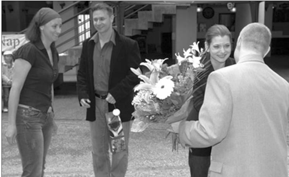
A virág mellett kitűnő ajándék lehet március 8-án a hölgyek számára a színház- vagy koncertjegy

Minden nő számára díjtalan a belépés március 8-án, csütörtökön este 19 órától a Parasztopera című darabra, amelyet a Marosvásárhelyi