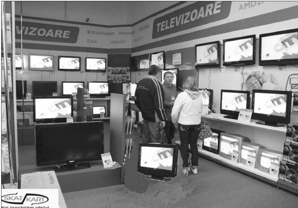
Elektronikai „fegyverkezés”: Románia le van maradva a háztartási és számítástechnikai gépek terén

Az elektronikai és IT-eladások javulását elősegíti az, hogy jócskán van hova növekedni. Amint a háztartási gépeket gyártó Indesit romániai igazgatója emlékeztetett, a hazai háztartásoknak az elektronikai felszereléseket illetően is komoly lemaradásuk van, nemcsak az európai uniós átlaghoz, de a régió más or-