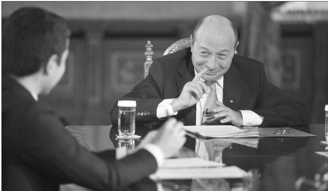
„Én tudom, hogy mit beszélek.” Traian Băsescu államfő tizenöt százalékos béremelést irányzott elő

A miniszterelnök felvetése azonnali reakciót váltott ki Traian Băsescu államfőben, aki az Evenimentul Zilei című kormányközeli napilapnak elmondta, a belső fogyasztás növelése érdekében inkább a közalkalmazotti béreket kellene emelni, és nem szabad módosítani a tb-járulékokon. Hozzátette: a múlt szerdai parlamenti beszéde előtt elemelte az ország gazdasági adatait. Ezekből kitűnt, hogy a kor-