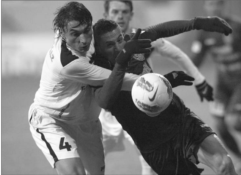
A "pandúrok" emberhátrányban mentettek pontot: a döntetlen igazságosnak mondható

A kettőtől ötezer euróig terjedő pénzbüntetések