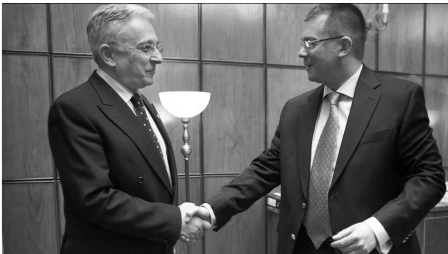
Mugur Isărescu jegybanki kormányzó és Mihai Răzvan Ungureanu kormányfő találkozásánál utóbbi közölte: az év első felében bért emel

A közalkalmazotti fizetések növelését helyezte kilátásba az államfő és a kormányfő