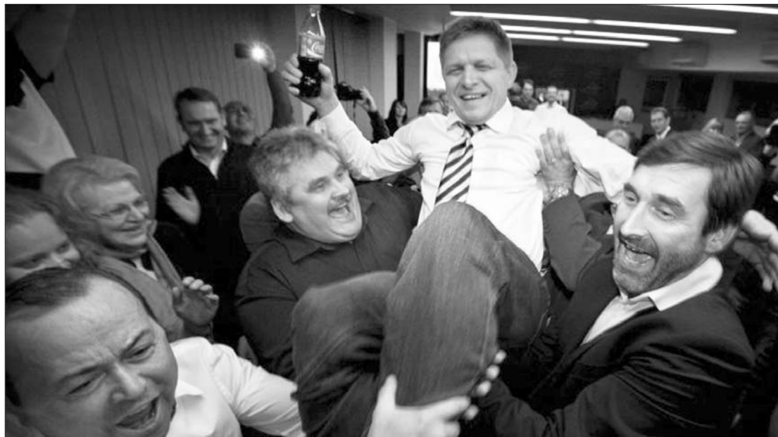
Ficónak van oka az ünneplésre. Másodszor alakíthat kormányt, előtte tárgyalna a parlamenti pártokkal

A Smer a szavazatok 44,41 százalékát kapta, így 83 képviselője lesz a 150 tagú pozsonyi parlamentben. Győzelmi beszédében Robert Fico – aki egyszer már volt kormányfő – arról beszélt, hogy győzelmükkel megvalósíthatják a szociális állam kialakítására és a közpénzek konszolidációjára vonatkozó, európai irányultságú programjukat. A törvényhozásba összesen hat párt jutott be. A második legjobb eredményt a jobboldali konzervatív Kereszténydemokrata Mozgalom (KDH) érte el, 8,32 százalékkal (16 képviselő). A parlament tagja lett a liberálisokból kivált heccpárt, az Egyszerű Emberek és Független Személyiségek (OLANO) is 8,55 százalékkal (16 mandátum). Beküzdötte még magát a parlamentbe 6,09 százalékos (11 helyet) szerezzve a Szlovák Kereszténydemokrata Unió – Demokrata Párt (SDKÚ-DS). A választói szavazatok 5,88 százalékát