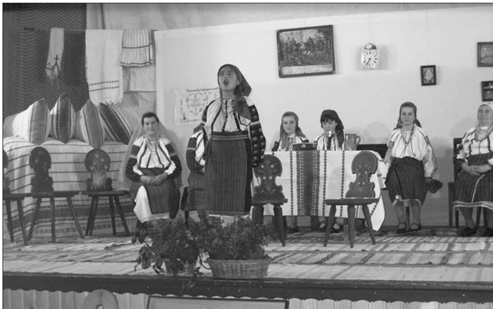
A pusztinai népdalénekesek a rangos elismerések közül ötöt vittek haza Szentegyházáról