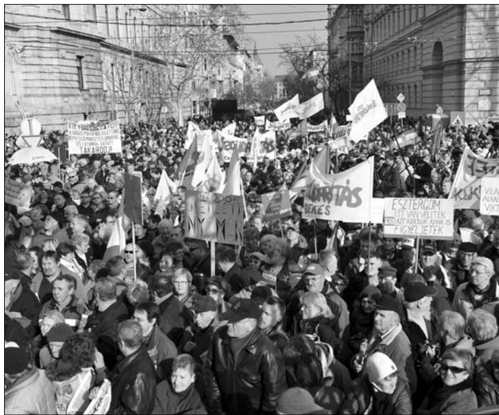
Tüntető, táblák, transzparensz. Önkényuralmat emlegetnek

A Der Spiegel című német hetilap ma megjelenő száma arról cikkezik, hogy a magyar kormányfő az elmúlt héten a Magyar Kereskedelmi és Iparkamara ren-