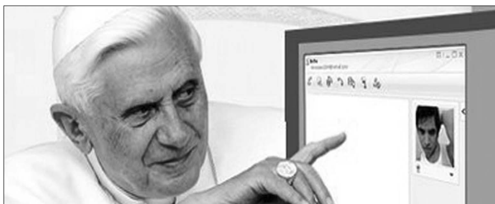
A cél szentesíti az eszközt: katolikus igehirdetés már interneten is

A kalózszervezet olaszországi képviselői blogjukon úgy érveltek, a támadás csupán válasz volt a „kizárólag haszon hajtotta egyház abszurd és anakronisztikus tanítására”. A hackerek „vádírata” hangsúlyozta, hogy