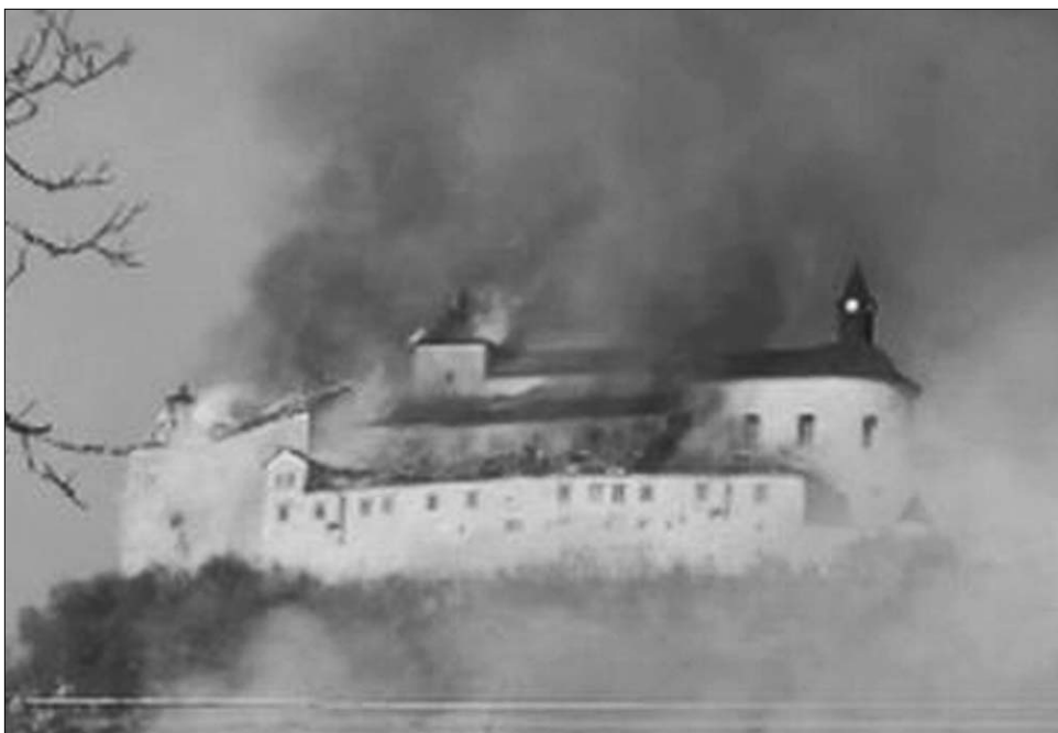
Krasznahorka büszke vára – ezúttal a lángokkal dacolva

A szlovák idegenforgalmi hivatal magyar nyelvű honlapja rendkívüli részletességgel ír a magyar történelem, a közös múlt páratlan műkincseiről. A Rozsnyói-katlan egy szembevető, nem erdősített hegycsúcsán, Rozsnyótól (Roznava) keletre emelkedik Krasznahorka vára (hrad Krásna Hôrka).