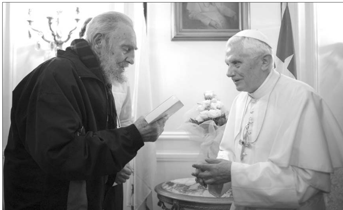
Fidel Castro könyveket kért XVI. Benedek pápától. A jelek szerint a kubai forradalom vezetője meg akar térni

Beszélgetésük során Castro elmondta, hogy a televízióban nézte a pápa kubai miséit, és úgy találta, fiatakkora óta sokat változott a liturgia. A kubai politikus ugyanis ministrált gyerekkorában, és jezsuita iskolába járt. Az egyházfő a szabadság és szabadságjogok témakörét hozta fel. Mivel mindketten 85 évesek, az