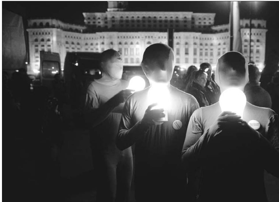
A Föld Órája a bukaresti parlament épülete előtt: az akcióhoz öt éve Románia is csatlakozott.

„Egyre több cég és magánvállalat kapcsolódik be a Föld Órája mozgalomba, eseményeket szerveznek ebben a szellemben” – magya-