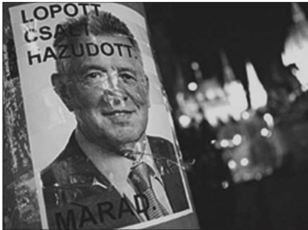
Schmitt Pál – marad? (plakát)

Németországban Karl-Theodor zu Guttenberg fülét-farkát behúzza, főjére hamut szórva visszalépett egy évvel ezelőtt. Nálunk a lelepleződött államfőnk távozása nem magától értetődő. A bizottság jelentése, a doki egyelőre marad doki, Schmitt meg az ország szimbóluma, aki be is jelentette: nem mond le. Pár pillanattal azután, hogy megérkezett a hír, lábra keltek az első gúnyrajzok, fotók és gondolatok az esetről, és a közösségi oldalaknak köszönhetően ellepték az internetet. Éljen a gerillamarketing, éljenek a mémek, éljen az internet, éljen a magyar szabadság, éljen a haza! Ime a legjobbak.