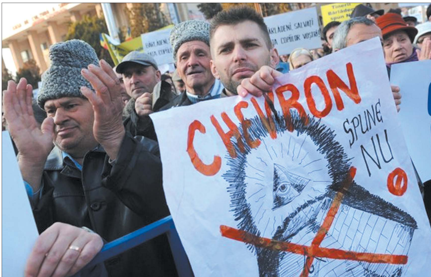
Chevron-ellenes tüntetés a Vaslui megyei Bârladon. A helyiek attól tartanak, hogy a palagáz kitermelése tönkreteszti környezetüket

Romániai lelőhelyek kitermelésének előkészítésére kapott engedélyt a Chevron