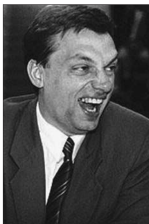
Orbán az igazság