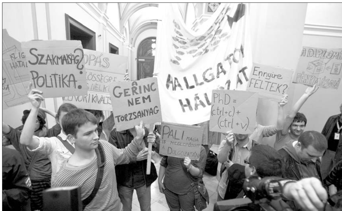
A Hallgatói Hálózat tagjainak demonstrációja. Kérdéses, hogy meddig maradhat még államfő Schmitt Pál