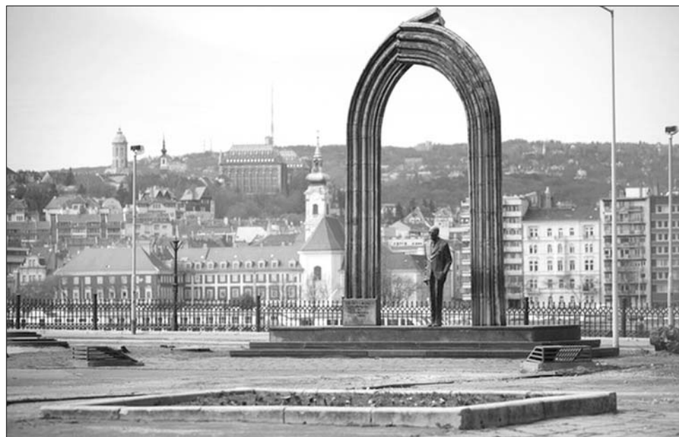
Károlyi Mihály szobra. Szerda hajnalig állt a budapesti Kossuth-téren

Károlyi Mihály volt az, aki 1918. november 16-án a Parlament lépcsőjén állva kiáltotta a Magyar Népköztársaságot. Nem tévedés: mint 1949 és 1989 között, hivatalosan népköztársaság volt Magyarország államformája, és csak egyszer, egy rövid időre 1946 és 1949 között volt korábban köztársaság, ezért a jelenlegi államformát hibás harmadik köztársaságnak minősíteni, mivel voltaképp még csak a másodiktól beszélhetünk. Mindenesetre a baloldali pártok és a baloldali értelmű emberek a köztársasági eszme hírnökét tisztelik Károlyi Mihályban, ezért tiltakoztak és tiltakoznak a művésziileg egyébként igényes szobor eltávolítása ellen; egyedül a Jobbik követelte ezt. A kétharmados Fidesz-többségű Országgyűlés pedig úgy határozott, hogy az országot reprezentáló Kossuth Lajos térnek, Magyarország főterének vissza kívánja adni eredeti, az 1944 előtti időket idéző arculatát,