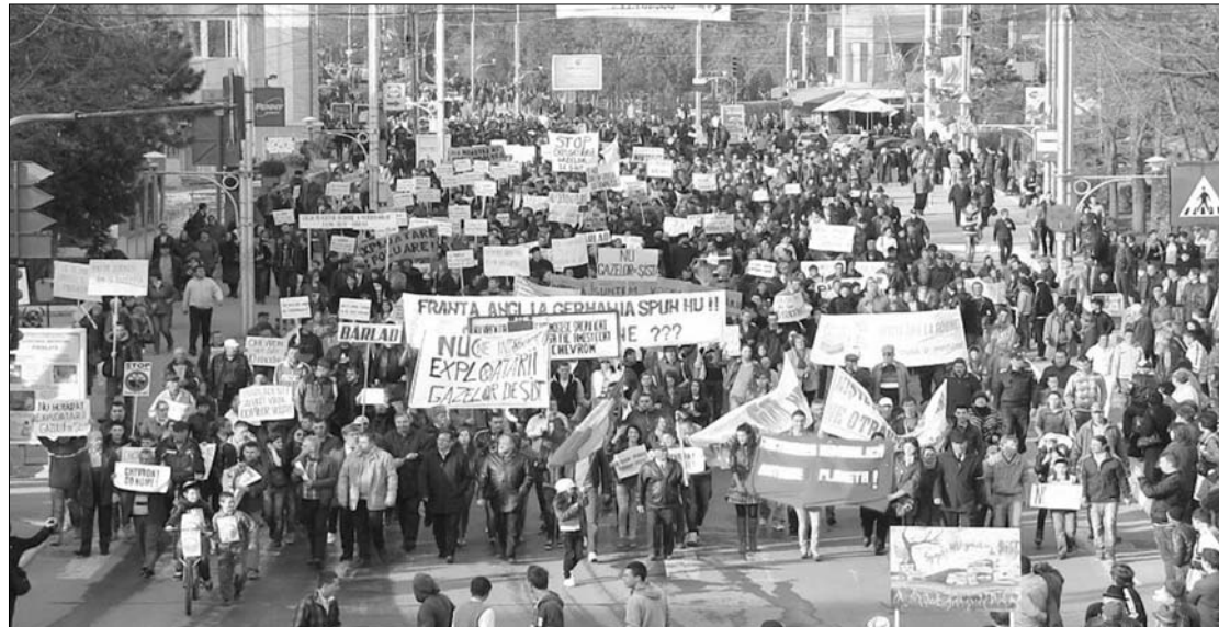
A Vaslui megyei Bârlad városban több ezres utcai tiltakozást váltott ki a Chevron esetleges megtelepedése