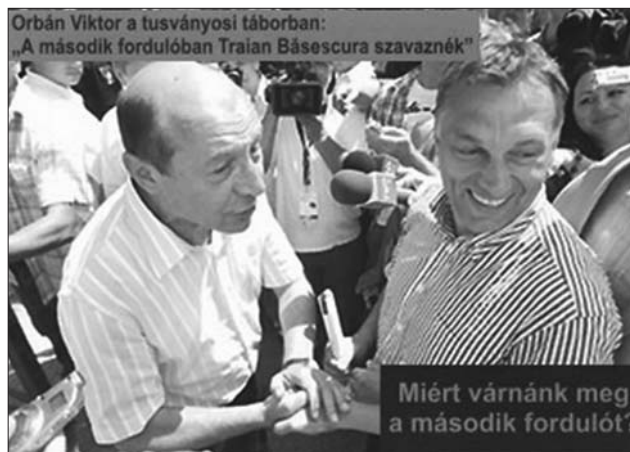
Már vénülő kezemmel... csip-csip csóka