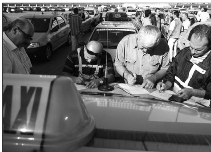
A bukaresti taxisok az ilfoviak kitértését kéri a fővárosból

nak, ahova a működési engedélyük szól. A tiltakozók az Ilfov megyei taxisoknak tüztek, akik ellepték a fővárost. 7. oldal ▶