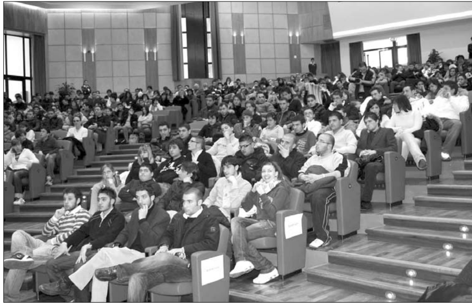
Május végére az egyetemeknek saját szabályzatot kell létrehozniuk az irányelvek alapján

„Daniel Funeriu korábbi oktatási miniszter kívánsága volt, hogy egy demokratikus