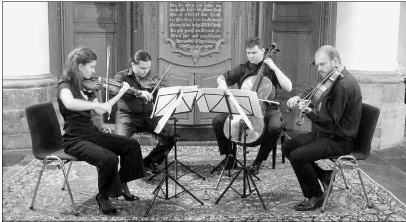
Az Arcadia négy zenésze az európai kontinens nagyvárosai után a szigetországon is turnéra indul

Londonban kapott elismerést a kolozsvári vonósnégyes