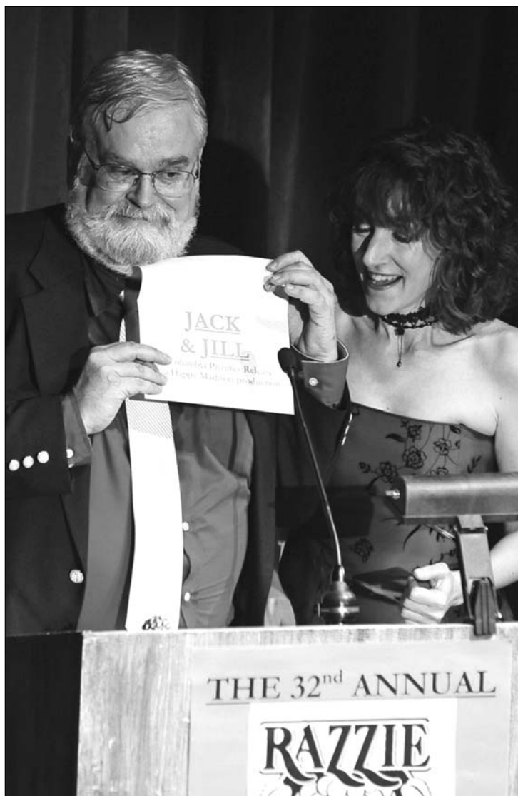
Rekordmennyiségű Arany Málna-díjat gyűjtött be a Jack and Jill című vigjáték

Az ünnepélyes átadást a rendezvény szerzőinek döntése nyomán most nem az Oscar-jelölések előestéjére, hanem stílszerűen április 1-jére, a bolondok napjára időzítették, természetesen a díjazottak, ahogy az előző években sem (csak ritkán), úgy most sem jelentek meg. A gálát egyébként egy kaliforniai, Santa Monica-i bűvészbolton tartották. Golfklubda nagyságú, körülbelül 5 dollár értékű, bizsuból készült szuper 8-as filmtekercsre helyezték, arany-sárgára lefűjt málnát készítettek elő Dennis Dugan számára is, egyrészt a Jack and Jill , másrészt a Just Go With It rendezéséért, ami