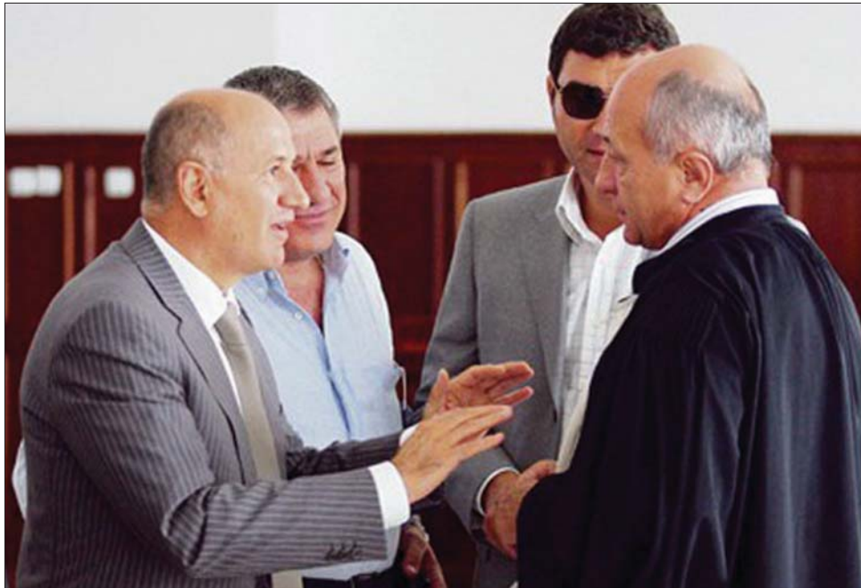
Az „átigazolási-dosszié” vádlottjai meggyőzték a bírót az ártatlanságukról

Az első fokú ítélet követeztében amúgy feloldották a „nyolcak” javainak zárolását, és a Dinamo, a Rapid, valamint a Gloria futballklubjai bankszámláinak zárolása is megszűnt. Ha az ítélet nem változik, a perköltségeket a román államnak kell kifizetnie. ◀