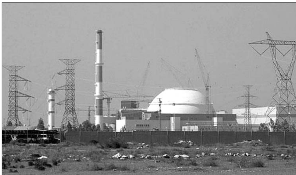
Irán – a bushehri atomerőmű. Nemzetközi szakértők szerint nem csak békés célokat szolgál