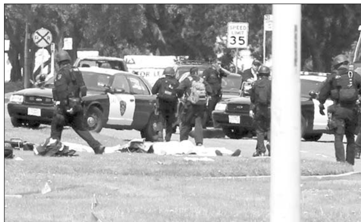
Ámokfutó Oaklandben. Az egyetem korábbi hallgatója a campusban lövöldözött

Hét embert ölt meg egy fegyveres egy oaklandi magánegyetemen az Egyesült Államokban, Kaliforniában. A férfi az egyik osztályteremben kezdett lövöldözni helyi idő szerint fél tizenegy előtt pár perccel az Oikos University nevű keresztény magánegyetemen. Az Oakland Tribune helyi lap internetes kiadásának beszámolója szerint a rendőrség utóbb a campustól mintegy öt kilométerre, egy közeli bevásárlóközpontban őrizetbe vette a lövöldözőt, aki nem tanúsított ellenállást, a bevásárlóközpont biztonsági őreinek egyszerűen megadta magát. Szemtanúk beszámolója szerint a támadó az osztályteremben felállt, mellbe lötte az egyik közelben álló diákot, majd tüzet nyitott a többiekre is. A lövéseket az egész épületben hallották, „mindenki nagyon megrémült” – számolt be egy angoltanár. Pánik tört ki, a diákok kirohantak az épületből.