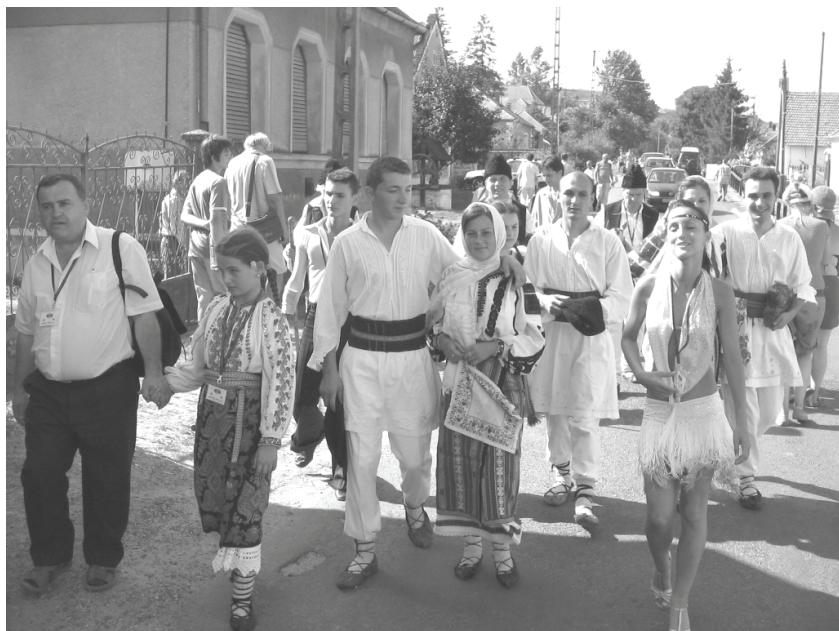
A román delegáció Taliándörögdön