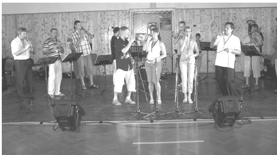
A szlovák Vistučanka Rézfúvós Együttes