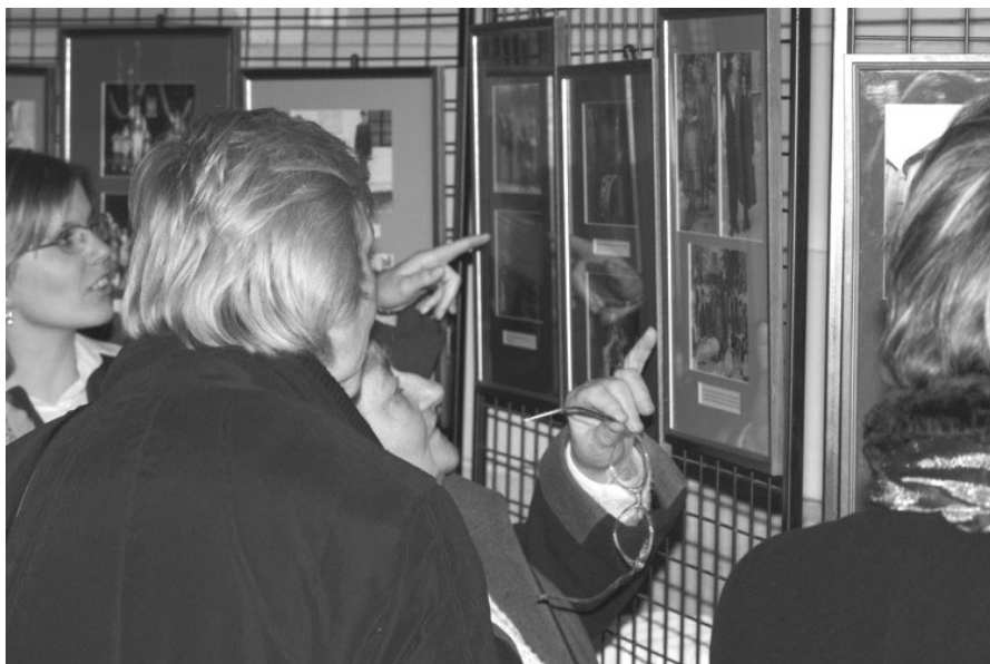
A Nemzetiségi Fotókiállítás megnyitóján

Magyarország sokszínű és gazdag kultúrájának szerves részét képezi mindaz a kulturális örökség, amelyet a tizenhárom, száz évnél régebben hazánkban honos nemzeti kisebbség a közös hazában létrehozott és őriz. Ennek a gondolatnak a szellemében a Magyar Művelődési Intézet fontos feladatának érzi, hogy elősegítse a magyar mellett a hazai a nemzetiségi kultúra tárgyi és szellemi értékeinek dokumentálását, megőrzését és minél szélesebb körben való megismertetését. Ezzel a céllal hirdette meg az Intézet nemzetiségi fotópályázatát, melynek ez évi kiemelt témája „nemzetiségeink múltja és jelene az épített kultúrában”.