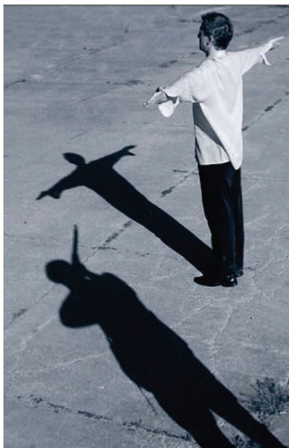
Vass László (Szeged): fotóillusztráció Nagy Gáspár: Söprök a reményt című Versére. Kiállítva: 1956 emlékére, Budapest (2006)

A Budai Vigadó látogatói, ha belépnek az épület kapuján először egy fotókiállítást pillantanak meg. Az aulában működik az Magyar Művelődési Intézet Fotógalériája, ahol a legtöbben láthatják az éppen aktuális tárlatot. Tíz esztendővel ezelőtt alakítottuk ki azért, hogy a tehetségkutató fotópályázatunkra beérkező több ezer fényképnek nyilvánosságot teremtsünk.