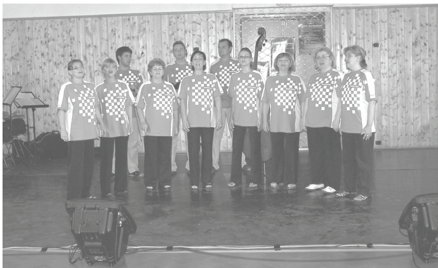
A horvát Karlovčanke énekegyüttes

pai Hálózata (ENCC), ahol sok más jelentős európai projekt mellett bemutatásra kerül az „Együtt Európában” találkozó és az arról készített dvd-film is, ami kiváló lehetőség lesz a projekt eredményeinek terjesztésére és új partnerek bevonására a további munkához. A projekt tehát még egyáltalán nem ért véget: folytatása garantáltan következik!