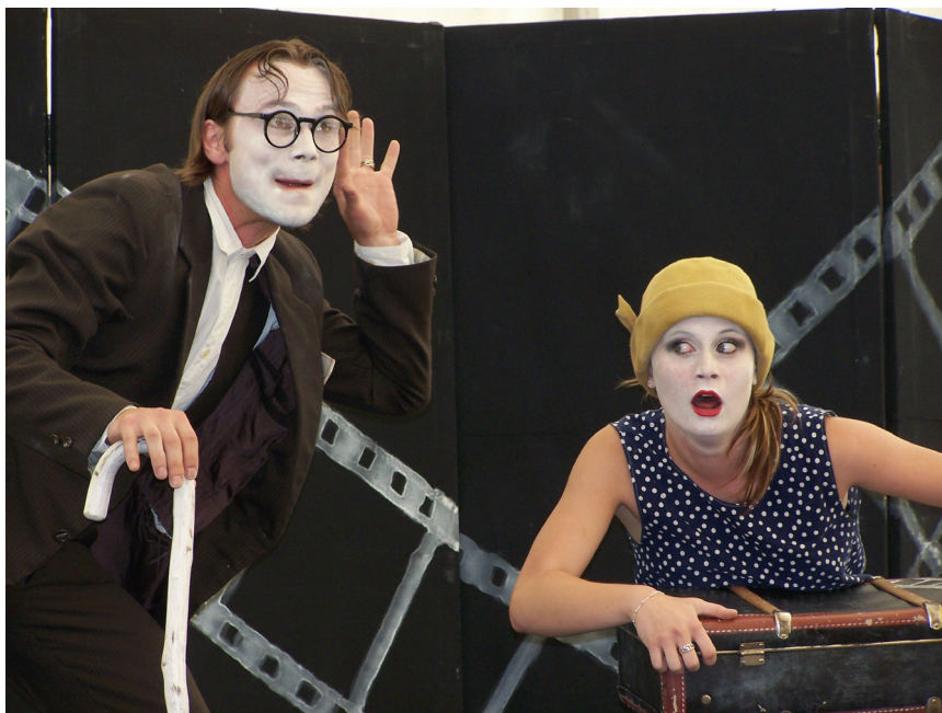
De Facto Mimo cseh pantomimegyüttes