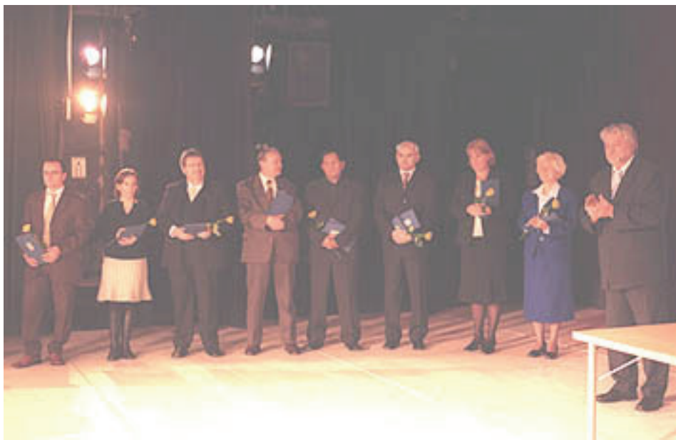
2006-ban a színpadok állók részesültek a PRO CULTURA MINORITATUM HUNGARIAE díjban

A Magyar Művelődési Intézetben szép hagyomány teremtődött, jó volna megtartani!