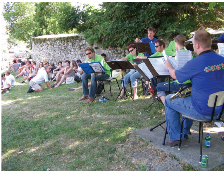
A szlovén Grewtown Pleh Band és közönsége árnyékban Taliándörögdön

2006 nyarán nagy lépést tettünk a nemzetközi (szlovén, román, cseh, szlovák és horvát) partnereinkkel való együttműködésben: lebonyolítottuk első igazi projektünket, az „Együtt Európában” nemzetközi amatőr-művészeti találkozót. Bár az eseményt igen alacsony költségvetéssel kellett megszerveznünk (egyetlen szponzorunk a Visegrádi Alap volt, akiknek ezúton is köszönetet mondunk), a 6 ország több mint 200 amatőr művészt felvonultató, és mintegy 4000 fős nézősereget vonzó rendezvény bebizonyította, hogy egymás kultúrájának megértése , sőt élvezete valóban lehetséges a mai Európában.