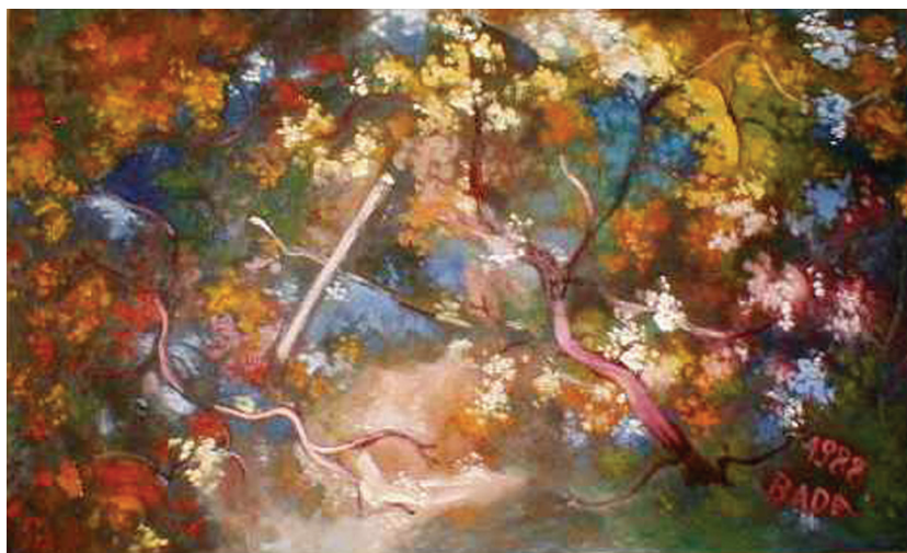
Bada Márta: Virágzó május 2

társ képzőművészeti élet nem kellő ismerése egyaránt hozzájárultak ahhoz, hogy jelentkezését elutasítottuk. Elzárkózásunk indította el az európai roma képzőművészeti élet legizgalmasabb pezsgését.