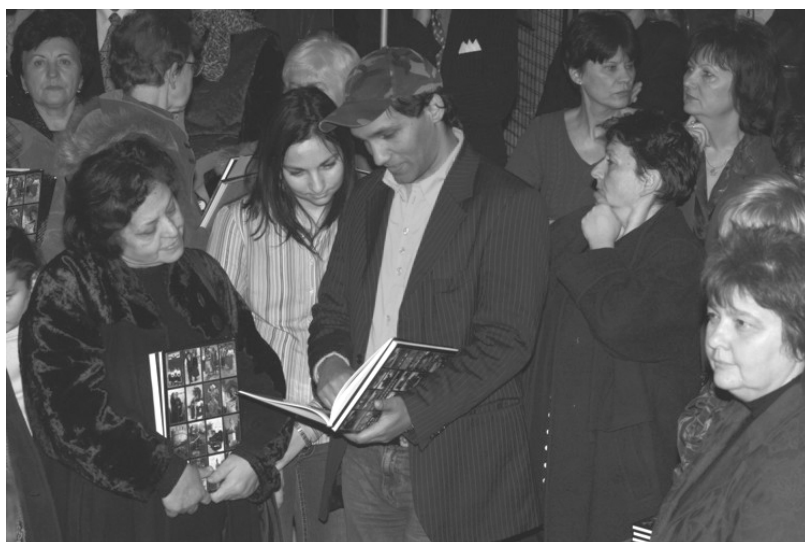
Nemzetiségeink képekben c. fotóalbum lapozgatása közben

A pályázatra beérkezett 49 szerző 503 alkotása közül választotta ki a nemzetiségi szakértőkkel együttműködő szakmai zsűri azt a 159 képet, amely a „Nemzetiségeink képekben” című fotókiállításon és az azonos címen megjelent albumban az egyes kisebbségek kultúráját reprezentálja.