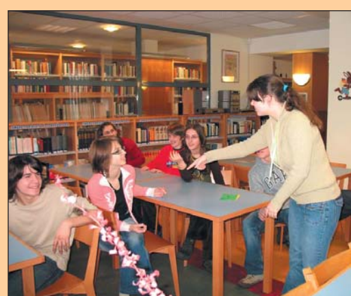
A Kodály Zoltán Általános Iskola diákjai a „Játékos Európa” programján rendezett vetélkedőn a Móricz Zsigmond Megyei és Városi Könyvtárban

is. A tájékoztató előadás utáni csapatversenyből pedig az is kiderült, hogy szinte mindent megjegyeztek a hallottakból.