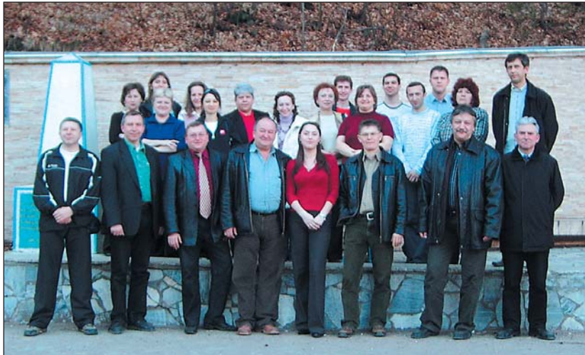
Csoportkép Európa középpontjában

A projekt közvetlen célcsoportját azok a szakemberek alkotják, akik részt vesznek a projekt keretében megrendezett konferenciákon és műhelytalálkozókon, s aktív közreműködésükkel szerepet vállalnak a projekt megvalósításában: Szabolcs-Szatmár-Bereg megyéből a 11 többcélú kistérségi társulás 1-1 képviselője, turisztikai szakemberek, valamint az Ügynökség munkatársai, Kárpátalja megyéből a 13 járás 1-1 képviselője, turisztikai szakemberek és az Ukrán-Magyar Területfejlesztési Iroda munkatársai (összesen kb. 40 fő).