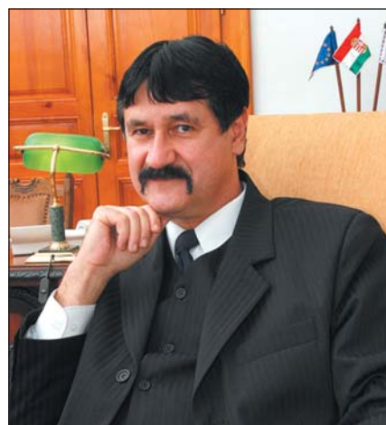
Fülöp István a Szabolcs-Szatmár-Bereg Megyei Területfejlesztési Tanács elnöke