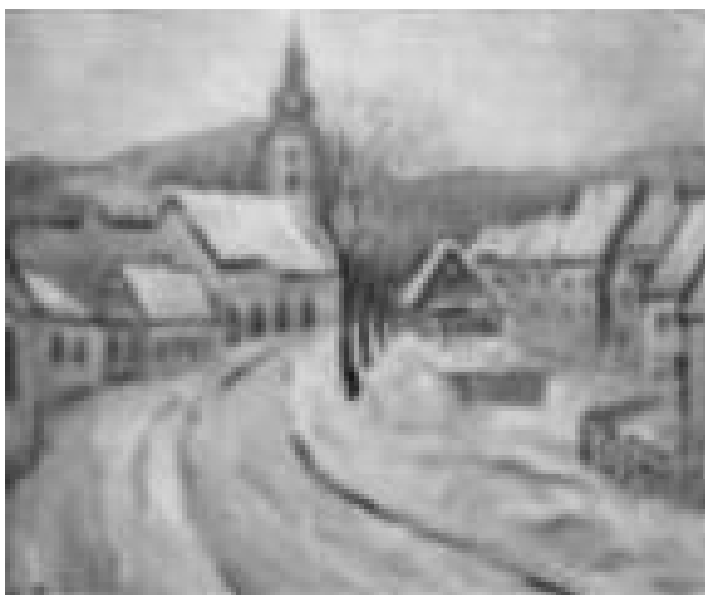
Kovács Péter festménye

Egy angyal érintette lelkem; Szent Karácsony, új Betlehem. Meváltónk itt él bennünk Felé hódolatot küldjünk. Imáink szálljanak egész évben, Krisztus eljöttét várva csendben. S majd leborulva imádjuk Őt, A vele egylényegűt, a Teremtőt.