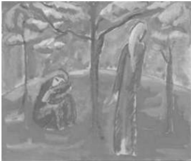
Bor István Iván festménye

Anyák napja a legszebb ünnep A gyermeki szívekben. Nyiladoznak virágok Gazdagon a kertekben. Énekeljünk, kis madarak, Énekeljünk közösen, Édesanyánkat áldja meg Minden jóval az Isten.