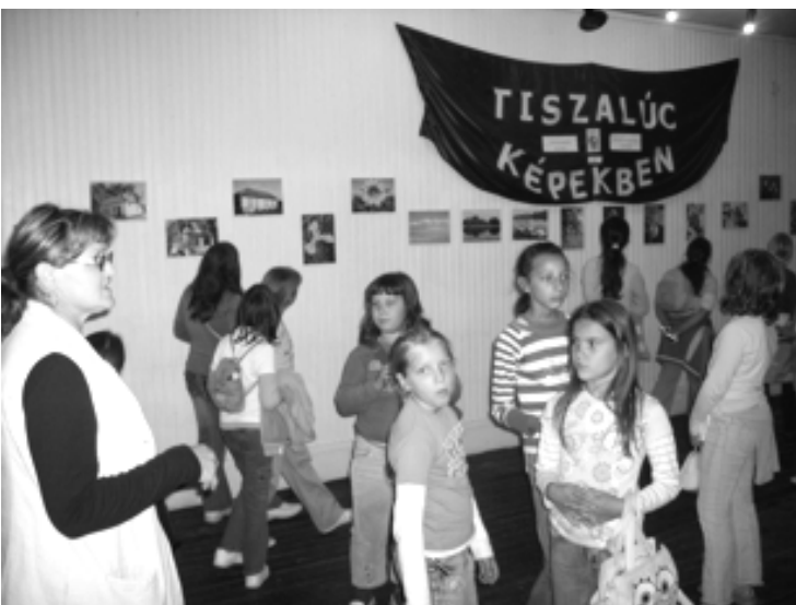
A kiállítás megnyitója