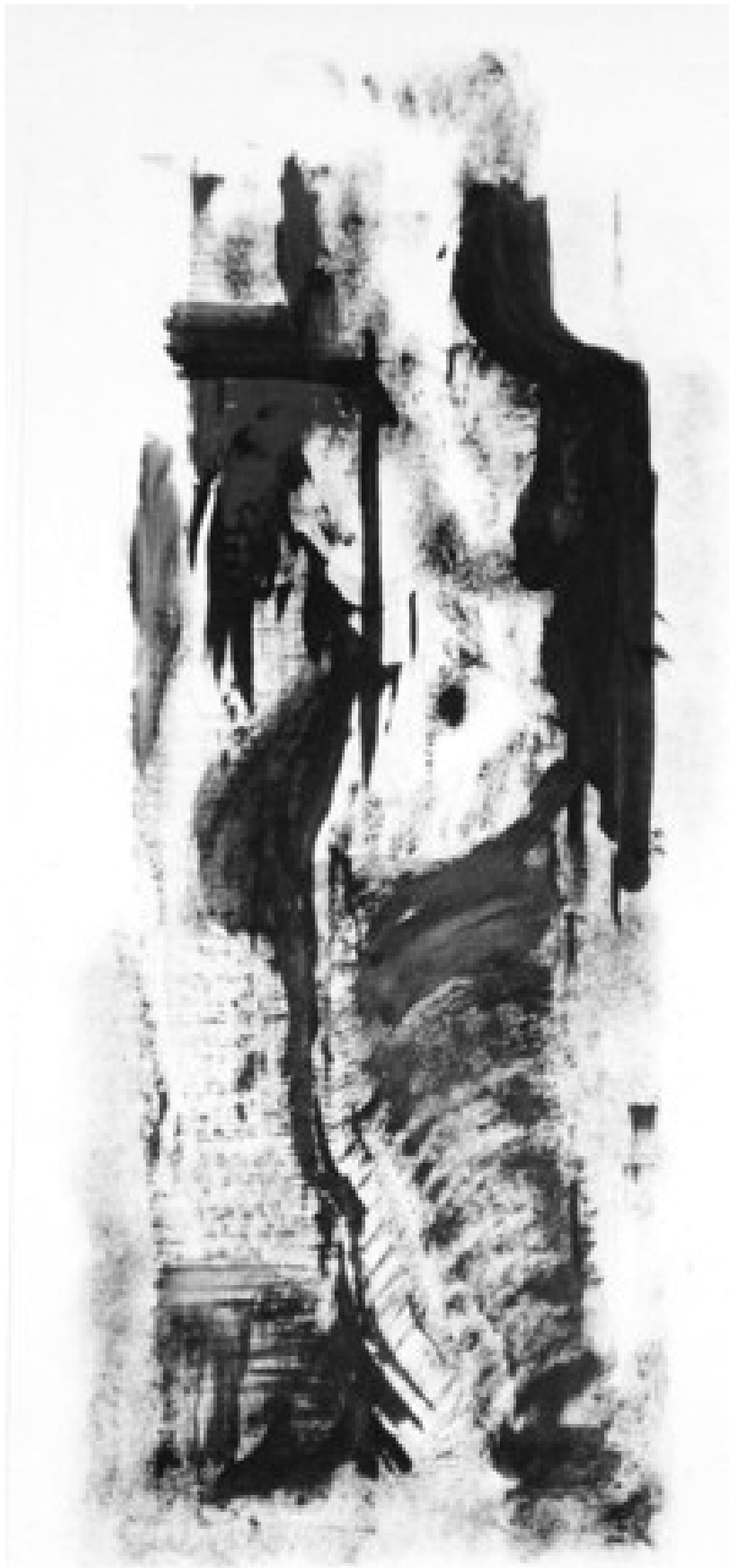
Bucsányi Endre Téren időn túl utoljára c. festménye