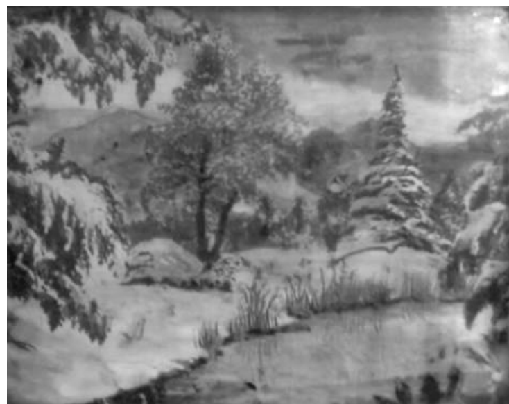
Mohácsi Józsefné Zsóka festménye

Ünnep volt a családban minden kenyérsütés, Szívünket boldogság töltötte el. Megvolt a betevő, a drága falat, Illata szétáradt, bejárta kicsiny falunkat.