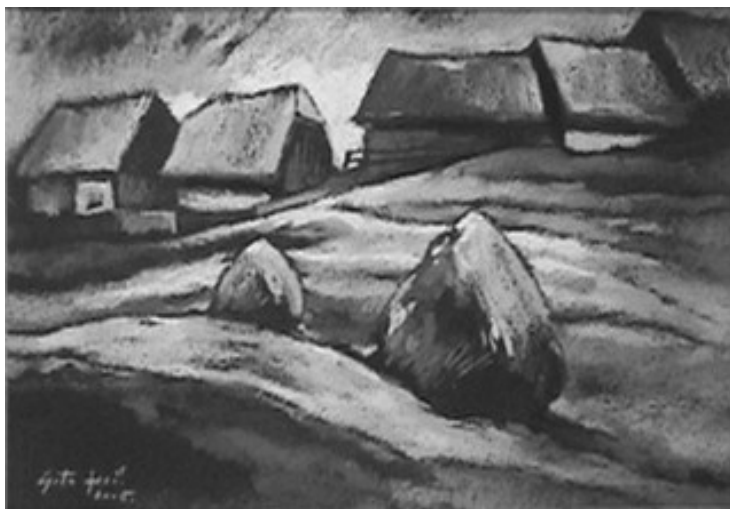
Csata Jenő festménye

Hópelyhekben alászállt a délután. Évezredes mozdulatával reményt adott az elősiető éjnek. Valaki megérkezett. Olvadni kezdtek a didergő lelkek jégcsapjai. Megenyhült a világ!