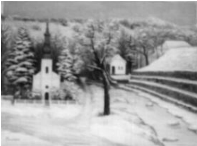
Varannai Margó festménye

a jelent s múltat majd a jövődöt vélttem elsuhanni a sötétben figyelő tekintetem nem pihent ébred álmodtam mint a mesékben