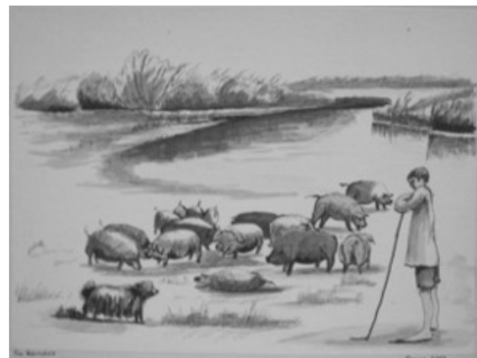
Barna András akvarellje

S kinn a szélen, tó szuszog. Avarra ölt partja nyelvet. S mint makacs napfény a jégre, egy vadkacsa pár totyog.