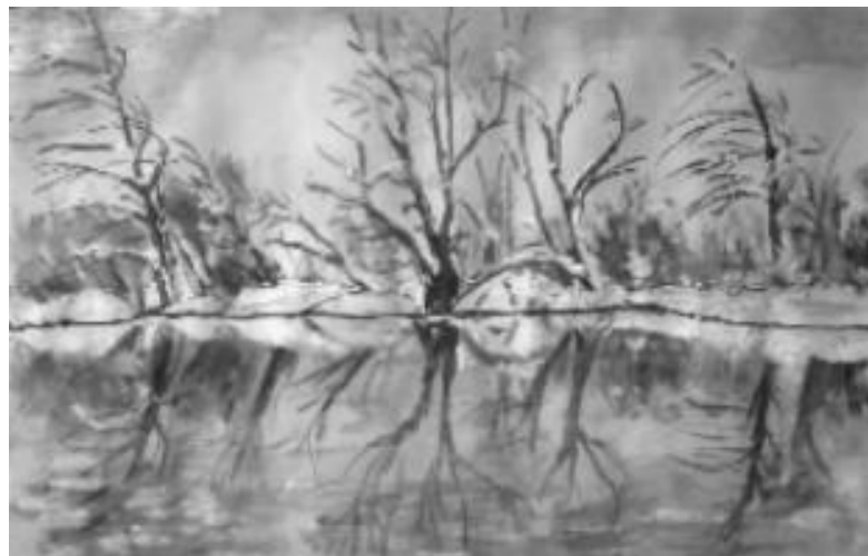
Lászkó Erzsébet festménye

A te szemed lehet ütés vagy simogatás, lehet szeretet, de lehet gyűlölet is, lehet csend és hallgatás, lehet öröm és bánat egyaránt, lehet egy gondolatjel, de lehet a könny a könnyel, vagy a végtelen a végtelennel.