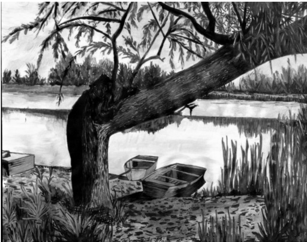
Domahidi Klára: Ősz a Holt-Tiszán