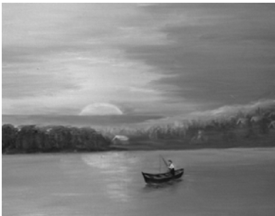
Varannai Margó festménye