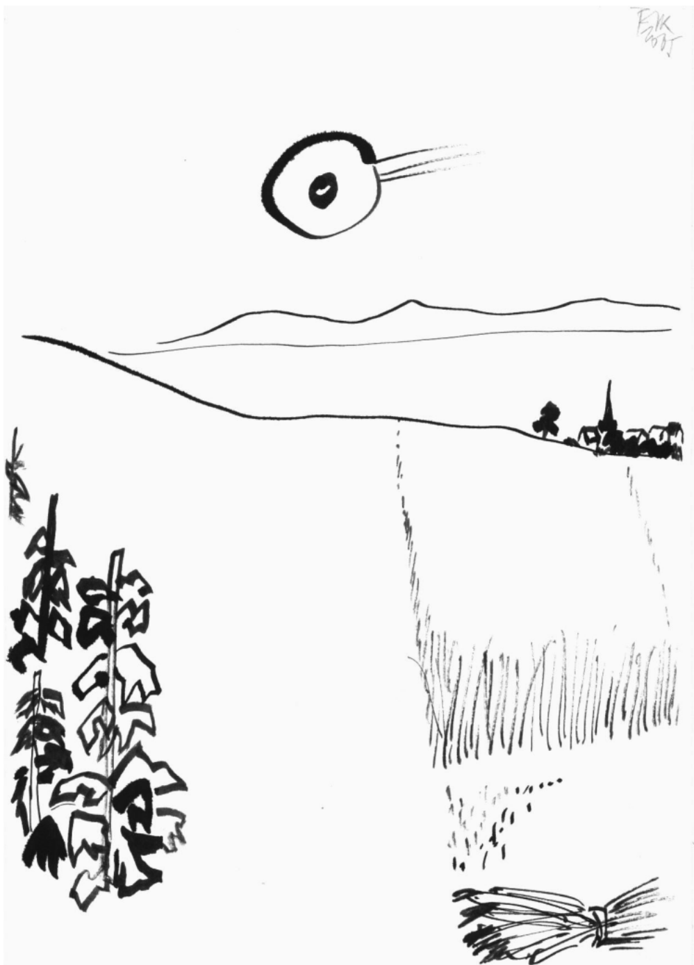
Bor István Iván grafikája