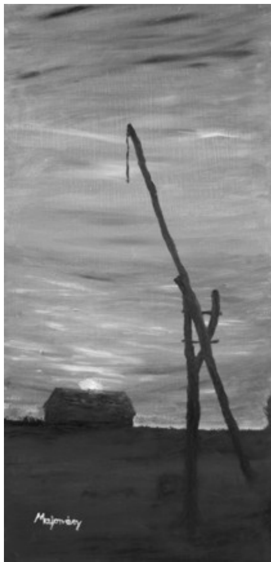
Majorváry Sz. Sándor festménye

és az elaggott levelekbe újra szelek kapaszkodtak... átlépve a nap hátrahagyott fényeiben, hazavittek sajtó lábaim.