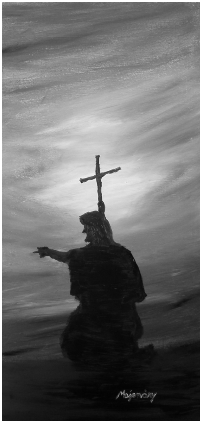
Majorváry Sz. Sándor festménye