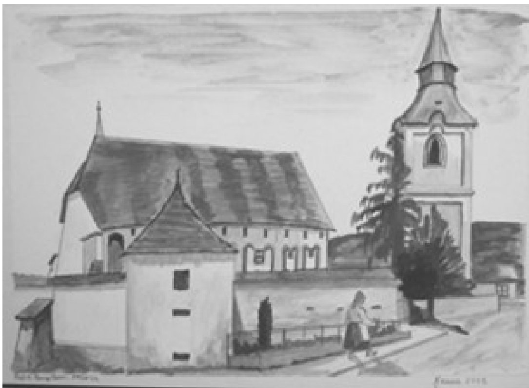
Barna András grafikája