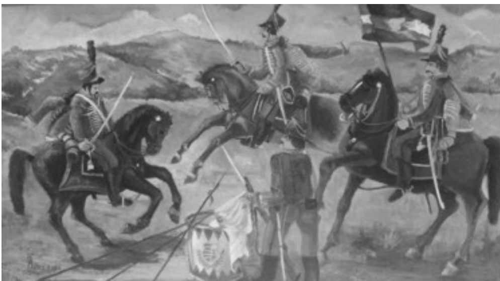
Barna András festménye

1848 Te üstökös csillag, utat mutattál: harctól, haláltól el nem tántorodtál. Időben kik névvel és névtelenül áldozták életük önzetlenül, kérlek, rájuk emlékezz, rendületlenül!