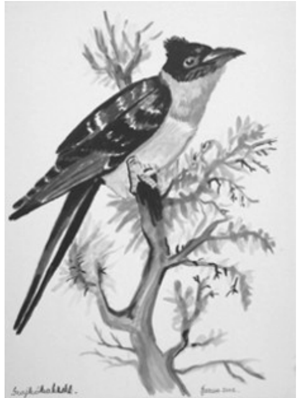
Barna András festménye