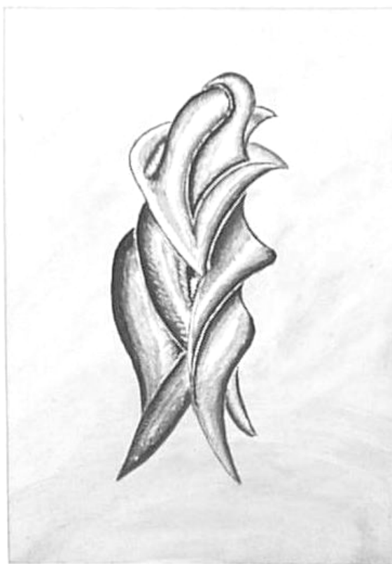
Kolozs József Sándor festménye

Add a kezed, mert beborult, Add a kezed, mert fú a szél, Add a kezed, mert este lesz. Add a kezed, mert reszketek, Add a kezed, mert szédülök, Add a kezed, összerogyok. Add a kezed, mert álmodok, Add a kezed, mert itt vagyok Add a kezed, mert meghalok.