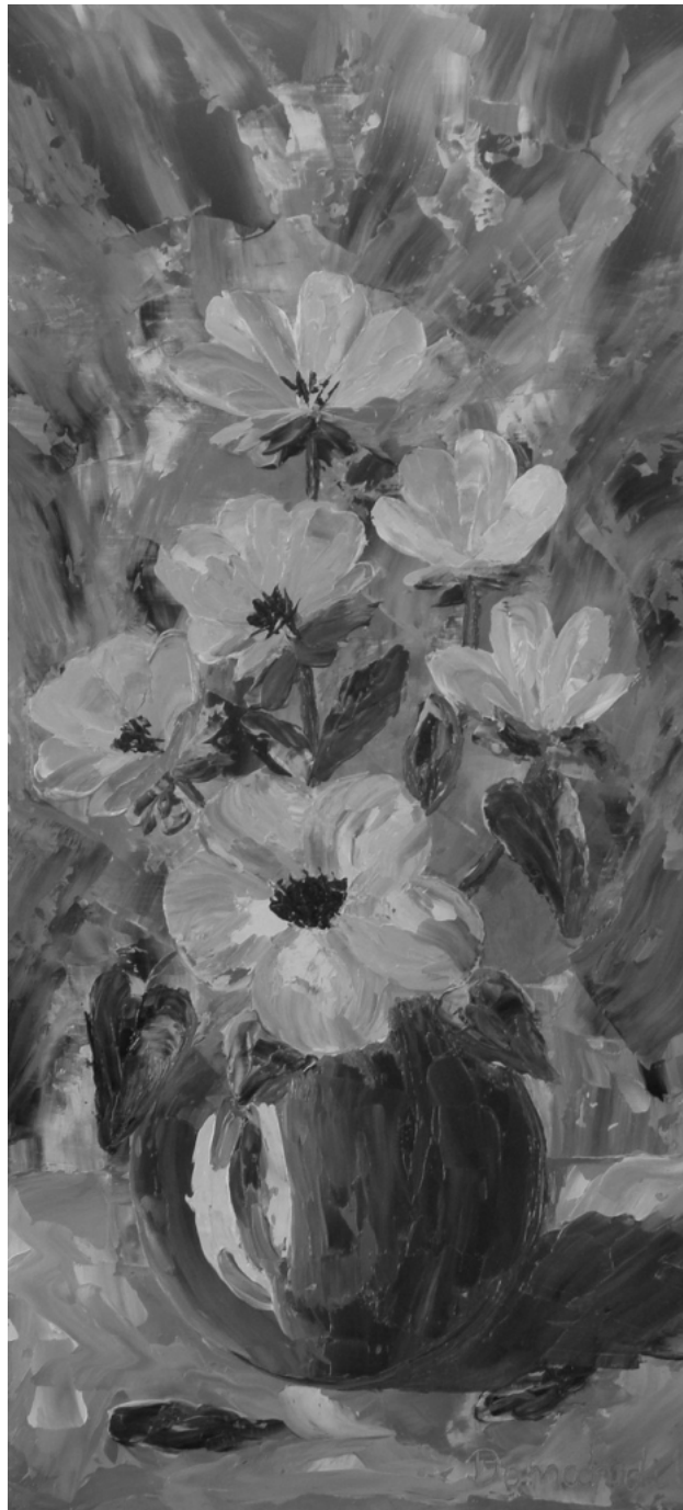
Domahidi Klára festménye