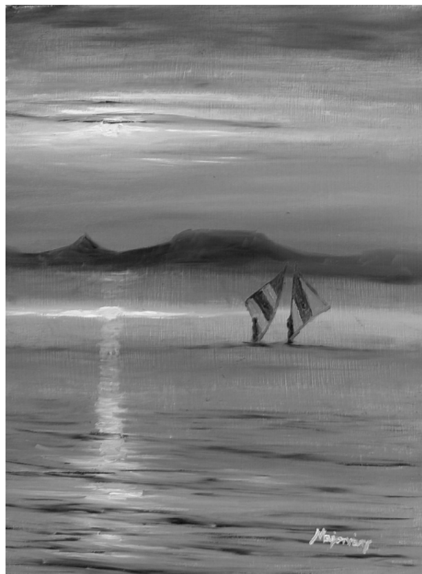
Majorváry Sz. Sándor festménye

Pirosló alkony fülledt óráiban Itt minden csak halkán, de beszél Fenyőágon a madár énekel S a patak csobog odalent. Arcodnak keserű mosolya élni kezd.