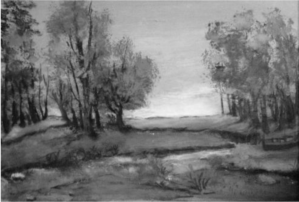
Mohácsi Józsefné Zsóka festménye