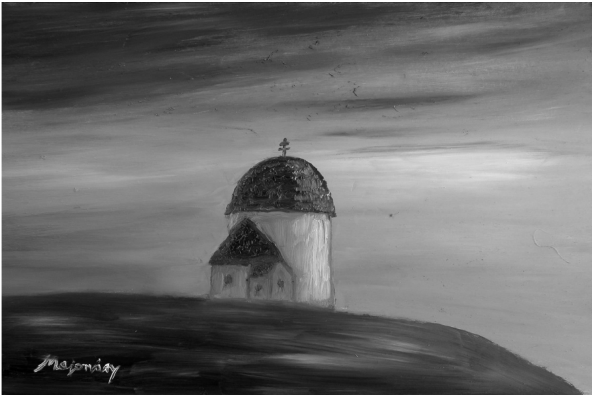
Majorváry Szabó Sándor festménye