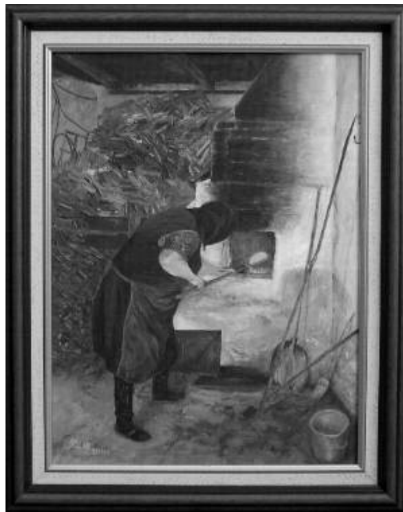
Hornok Magdolna festménye

Ünnep volt a családban minden kenyérsütés, Szívünket boldogság töltötte el. Megvolt a betevő, a drága falat, Illata szétáradt, bejárta kicsiny falunkat.