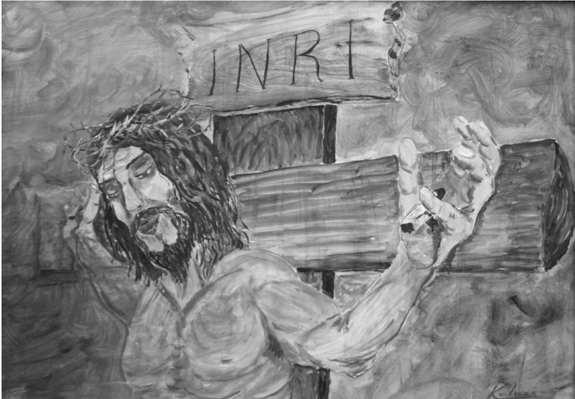
Kolozs József Sándor festménye