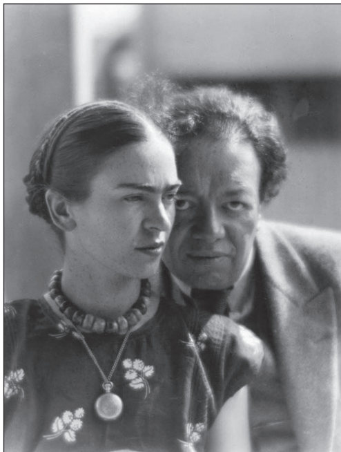
Frida Kahlo férjével, Diego Rivérával

amelyet egy szovjet ügynök követett el 1940-ben. Az 1950-es években, Kahlo halálát követően, Rivera visszakönyörögte magát a szélsőségesen sztálinista Mexikói Kommunista Pártba, amit – akárcsak Kahlo – egyfajta „hazatérésnek” tekintett.