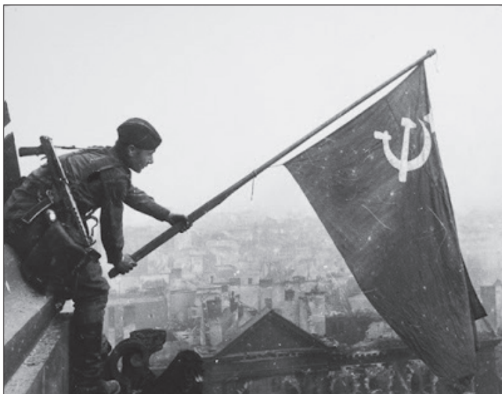
Szovjet zászló leng a Reichstag épületén