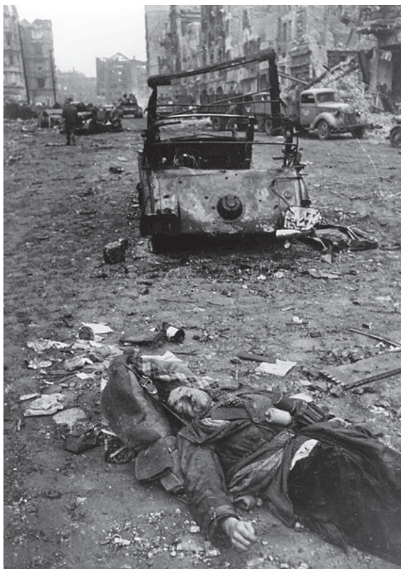
Berlin, 1945. május

rofálisnak ítéli meg a helyzetet. Az természetesen nem igaz, hogy a migráció lenne a társadalmi labilitás és a terrorizmus a melegágya, az azonban kétségtelen, hogy azokban az országokban, ahol a demográfiai robbanás nagyon jelentős, és nem indul be számottevő gazdasági növekedés és vele kapcsolatban modernizáció, ott az Európára és általában a fejlettebb országokra a nyomás igen nagy lesz, ami az elkövetkezendő évtizedekben globális méretekben is destabilizáló lehet. Nem lehet arról elfeledkezni, hogy nemcsak a Közel-Keletről és az afrikai kontinensről van szó, hanem nem kizárhatóan akut válságok alakulhatnak ki Európában is, jelenlegi ismereteink szerint Ukrajnában, és ez tovább növelheti a migrációs nyomást.