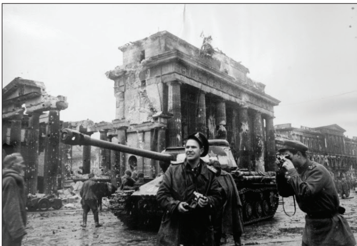
Jevgenyij Haldej Berlin ostrománál, 1945. május