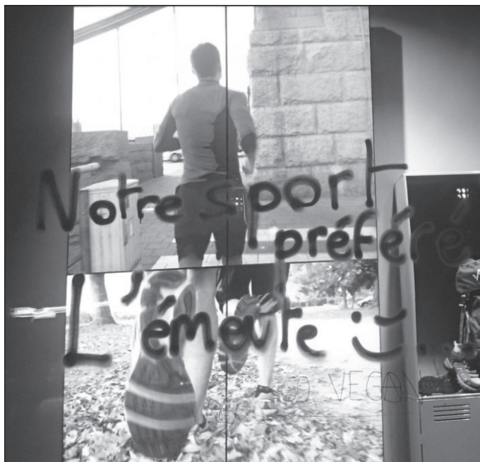
„Kedvenc sportunk a lázadás.”

A tény, hogy a République téren szerveződő Nuit Debout-k résztvevői alapvetően homogén tömeget alkottak, figyelmet érdemel.