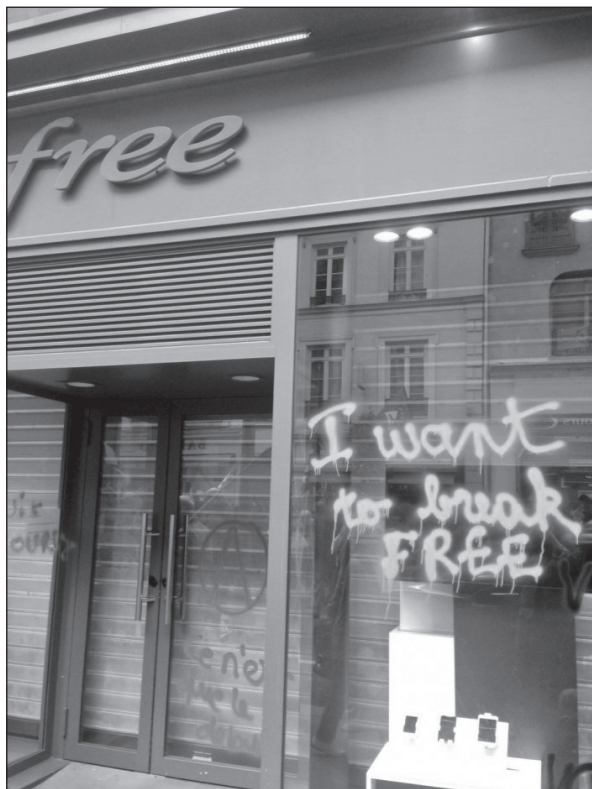
„Szabad akarok lenni.”

A rendőri fellépés következő lépése volt, hogy a tüntetőket az akkor éppen zajló Európa-bajnokságon kikísérletezett szurkolói zónák mintájára körbekerítik. Néhány nappal később Valls megtiltotta a június 23-i vonulást a szakszervezetek által előre kijelölt útvonalon, és helyette egy helyhez kötött tüntetést javasolt a Nation térre – amit a rendőri erők minden irányban hermetikusan lezártak volna... A szakszervezetek nem fogadták el a javaslatot, és a korábban tervezettől eltérő útvonalat javasoltak. Erre válaszul Valls 21-én, kedden, egész egyszerűen betiltotta a tüntetést. A szakszervezetek közölték, hogy ellenszegülnek a