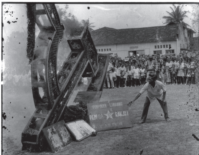
A kommunizmus jelképe, a sarló és kalapács nyilvános elégetése

Ám este 9 órára jobboldali táborkok egy csoportja, a viszonylagos ismeretlenségből ekkor kiemelkedő Suharto tábork vezetésével, visszafoglalta a Merdeka teret, és rádiónyilatkozatban közölte: egyetértés jött létre a szárazföldi erők, a haditengerészet és a rendőrség között a puccs leverésével kapcsolatban, majd bejelentette: maga