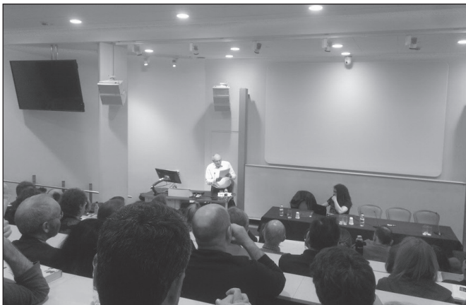
Krausz Tamás Londonban

Kelet-Európában sem tudták a hivatalos kommunisták, hogy mit kellene tenniük, mivel már régen „elfelejtették történelmi hivatásukat”. Amikor Lukács az Ontológiában Lenin szemére vetette, hogy „túlságosan kizáró módon és túlságosan feltétel nélkül az ideológia forradalmasítására összpontosít, és éppen ezért ezt az ideológiát nem