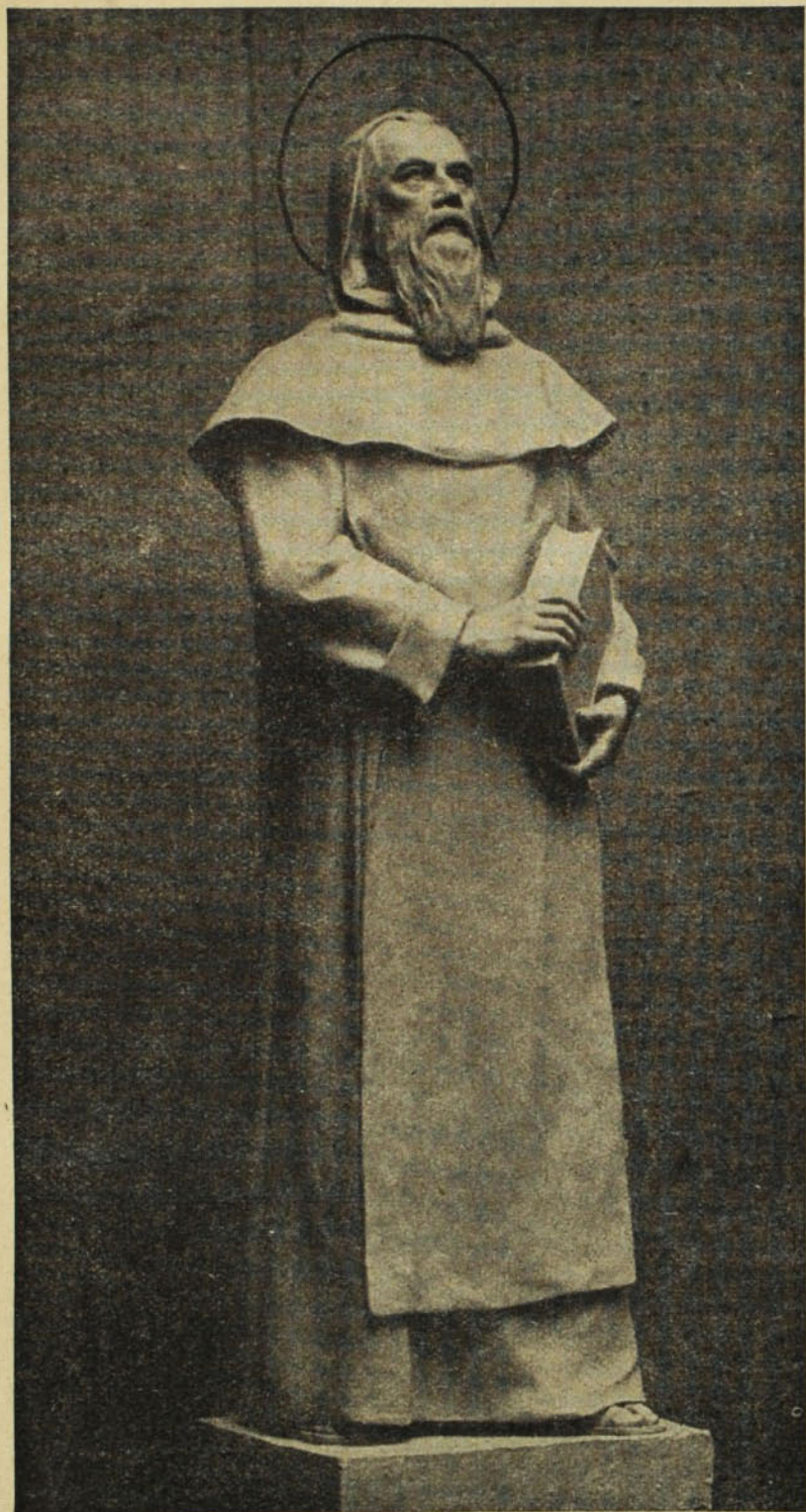
Vastagh Éva: Szent Özséb