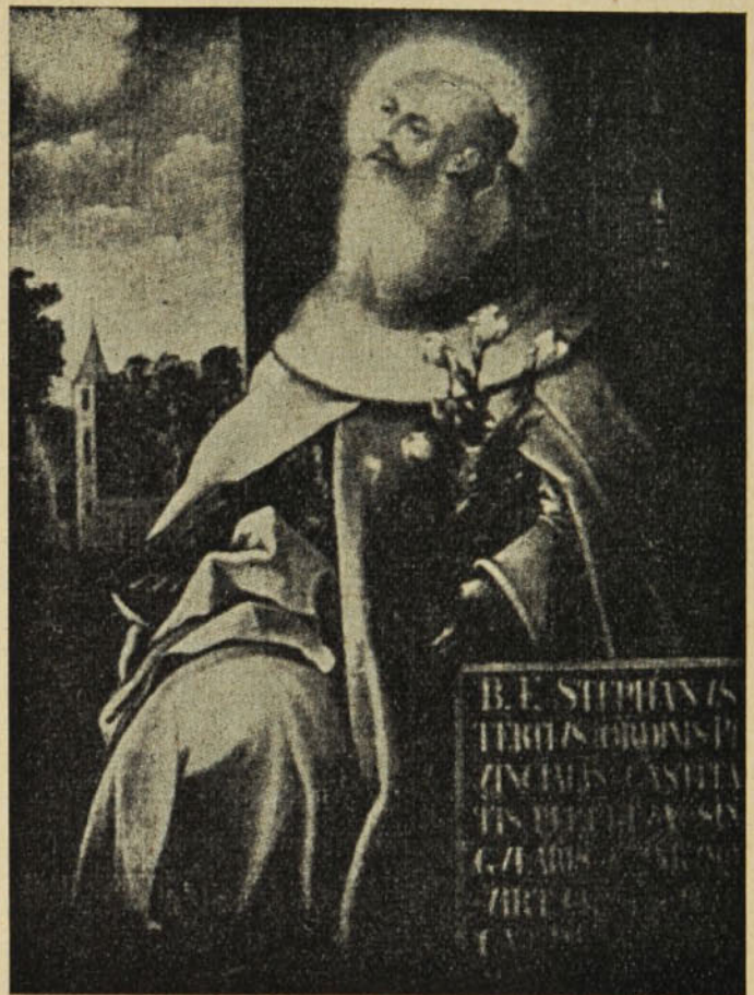
Boldog emlékü István (Csensztochowai festmény 1633-ból)

Úgyszintén együtt étkezzék a perjel az ebédlőben a testvérekkel. És senki se maradjon el az asztaltól, kivéve a felszolgálókat. A felszolgálók pedig a második étkezésen egyenek. A perjel ugyanazt kapja, mint a testvérek. Ha valamelyik testvér valami különlegességet kapna barátaitól, vagy rokonaitól, közösen osszák el. Senkinek sem szabad perjelének engedélye nélkül bármit is elfogadni, vagy adni, kölcsönkérni, vagy kapni; hogyha pedig elfogadtak, vagy