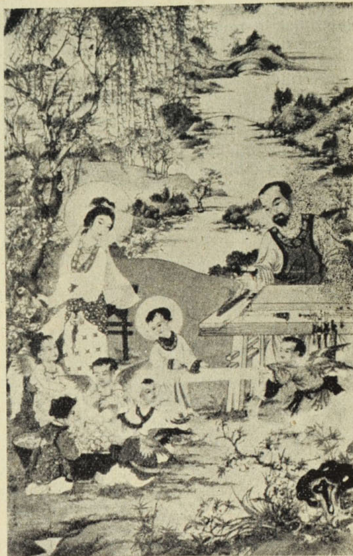
Wang Su-ta, kínai festőművész: A szentcsalád.

Nem lenne helyes a jóvátételt kizárólag a bűnbocsánatra korlátozni. Isten a vétkezőknek nem csupán azzal szolgál elégtétellel, hogy megbocsátja az elkövetett gonoszt, hanem a megtérőnek útravalóként szeretetet is nyújt, hogy e szeretet segít-