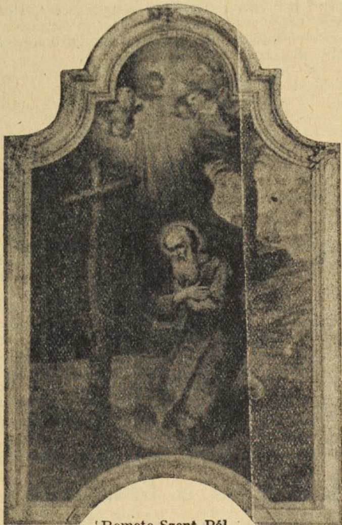
Remete Szent Pál.

meg a szentet. Több miseszöveg még a változó részekben is a szent életéhez alkalmazkodik. A napi szent képét tehát szemléletesen rajzolja elénk az Egyház, hogy egész nap arra nézzünk és utánozzuk. A liturgikus szent-tiszteletnek ez a nevelő oldala. A mai nap szentje a magányosság, hallgatás szeretetére tanít. A magányosság és hallgatás a lélek klauzurája. Amikor «mélységes csönd borult a mindenségre», akkor jött le az Isten Fia a