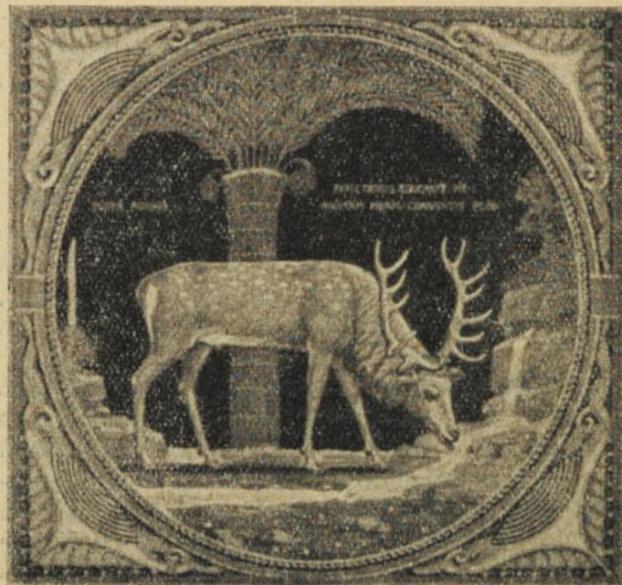
Mint szarvasgím a források vizére, úgy sóvárog utánad a lelkem, én Istenem!

A hegytetőn már ragyogó kereszt hirdeti az új hitet örök igazságul a pogányoknak. Odafönt a bérce, kis hegyi kápolna mellett, végeláthatatlan út kanyarog át a lejtőkön. Görnyedthátú öregember ballag fölfelé. Embert alig lát erre, már-már maga sem emlékszik rá, mióta él itt a nyugalom csendes völgyében. Békés, nyugodt, megelégedett arcáról szeretet sugárzik. Nincs semmije, csak a magányos erdő, nincs más vágya, mint az Úr szolgálata, ahogyan a körülötte susogó erdők, tarka virágok és illatos mezők szolgálják Őt megbékélt lélek-