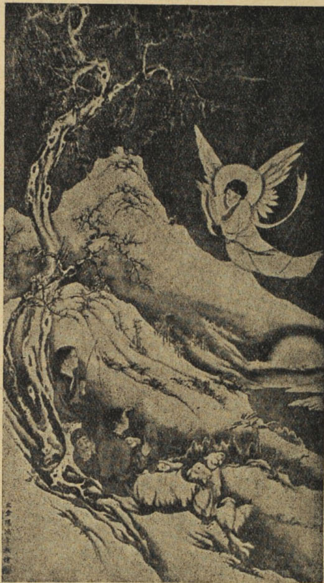
Lu-Hung-nien: «Nagy örömet hirdetek nektek».

melléki várakról és templomokról írt nagy-szabású művében azt mondja, hogy okleve-les nyomra nem talált e templomot illetően és csak feltételezi, hogy az a pálosoké volt. Pedig annak maradványai elég tekintélye- sek. Sógorom mérnöki becslése szerint a templomrom hossza kb. 25 méter, széles-sége 8—9 méter, magassága még ma is 7—8 méter. Egyetlen oklevél vonatkozhat csak rá és pedig Péter veszprémi olvasó-kanonoknak egy 1307-ből maradt birtokba-vételt jelző irata, mely a kőuti (ma Kék-kút) Szent Mária Magdolnáról nevezett pálos