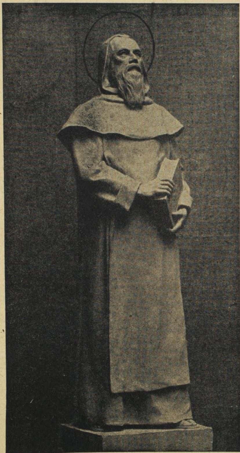
Vastagh Éva: Boldog Özséb