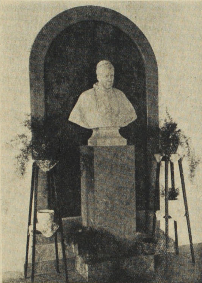
Gróf Zichy Gyula szobra a pécsi Pius-gimnáziumban