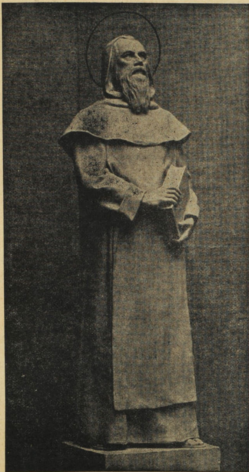
Vastagh Éva: Boldog Özséb