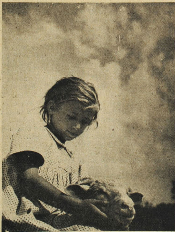
Boldog húsvéti Alleluját kíván kedves olvasóinak «A fehér barát».

Egyik kedves Előfizetők — januári be- köszöntőnkkel kapcsolatban — arra kért min- ket, írjunk már magunkról is, életünkről, napi- rendünkről, kolostori munkáinkról... Ime, egyszerű a titok: pálos életünk reggel öttől este tízig az ima és a munka jegyében pereg le, mint minden szerzetesé. Közösen elmélkedünk a kápolnában, reggel egy félórát, este egy fél- órát. Közösen végezzük, papok, kispapok, ujoncok a szent zsolozsmát. Közösen társal- gunk ebéd és vacsora után egy-egy órát, mert különben csöndnek kell lennie napközben a kolostorban, hogy imádságos munkájában sen- kit se zavarjunk. Az atyák a hívek lelki gon- dozásával, gyóntatásával, prédikációval van- nak elfoglalva. A testvérek söpörgetik a templom- ot, a kolostort, varrnak, főznek, szőlőben,