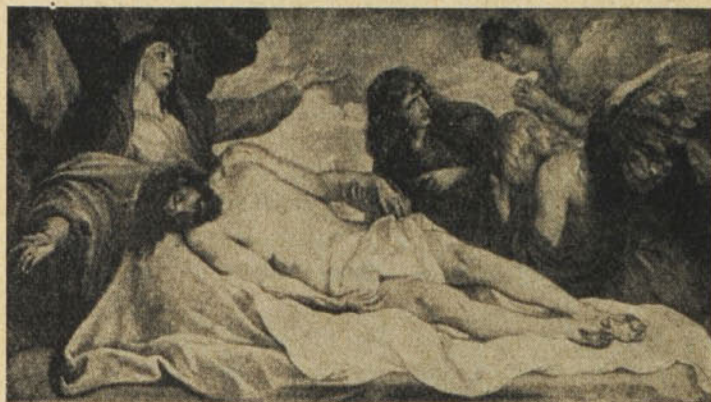
Van Dyck : Piéta.

Vagy megment az irigységtől a rosszak felé.