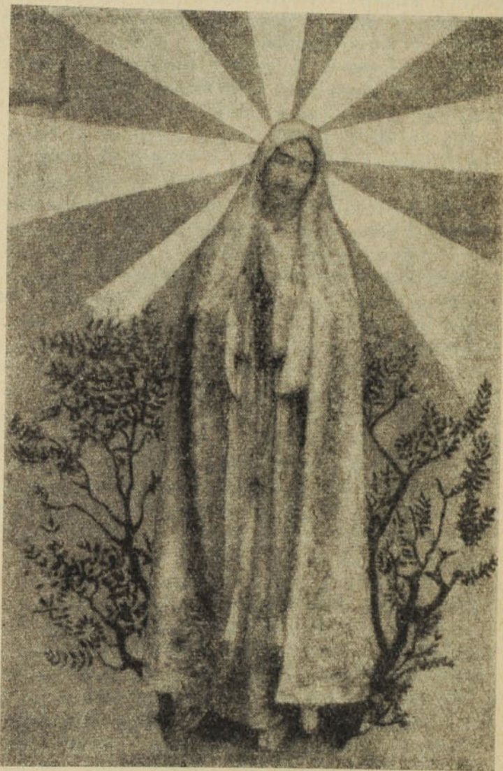
Fatimai Nagyasszony könyörögj érettünk!

A csodálatos látomás után a kicsik erősen fogadkoztak, hogy nem szólnak róla senkinek