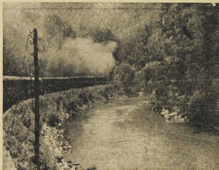
«Megy a gőzös...»

A kalauz végigjárja a kocsikat. Márta gépiesen nyújtja a jegyét, majd ismét helyére csúsztatja. Látszik, oda sem figyel. Nyugtalanul babrál a nyitott könyvben. Gyüri, hajtogatja a lapok sarkait. Olvasni nem tud. Idegesen