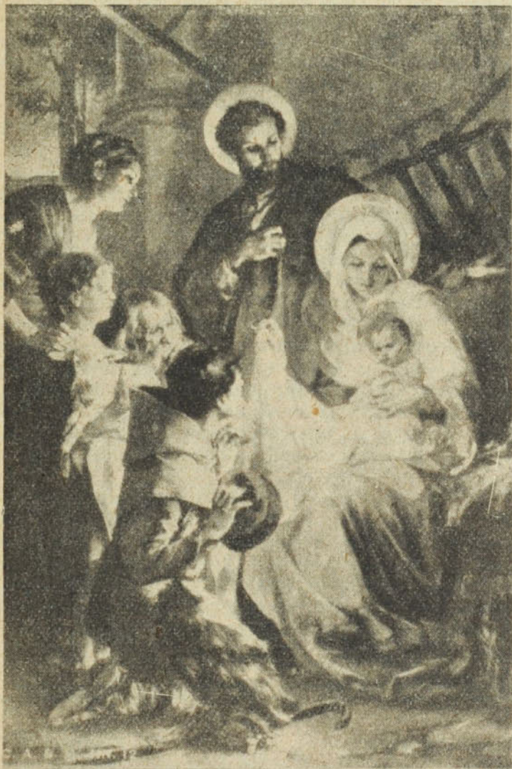
«Ó gyönyörű, szép, titokzatos éj!»

A kisgyermek a juhokat a legelő felé hajtja, miközben a reggeli átlátszóságban úgy alszanak a kis fehér házak, mintha elszenderedtek volna. A tekintet messze kalandozik, amerre a zöldön túl a föld párázik a születő nappalnak fenséges szépségében. A kis pásztorok folytatják reggeli imádságukat. Csöndes tekintetük gyermeki ártatlansággal fedezi föl minden egyes óra szépségét — a forrás csobogása a