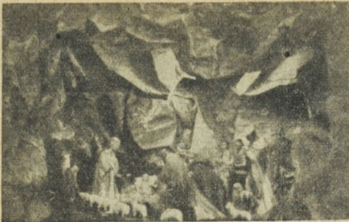
Római kolostorunk Betleheme.