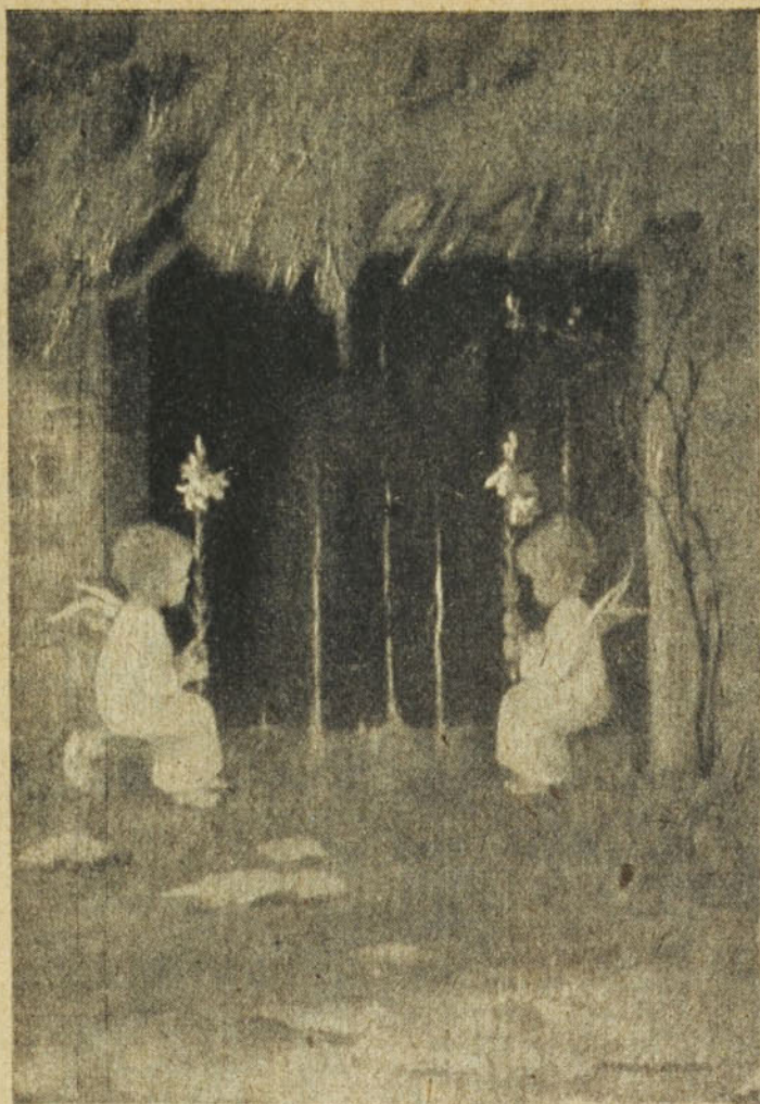
M. Schoenermark : Ádvent.

De mily tragikusan igazak a János-evan-gélium igéi : a Világosság a sötétségben világít, de a sötétség nem fogadta be Őt . . .