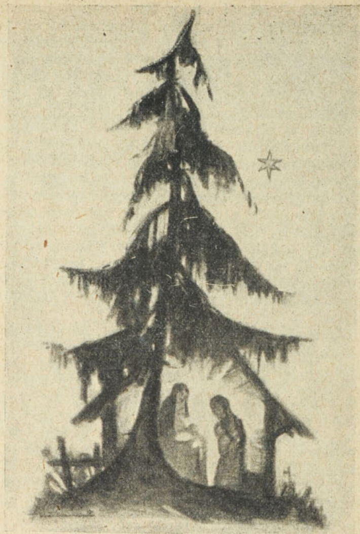
Hummel: «Csendes éj...»

Elmondhatjuk-e, hogy ez nem igaz? Hisz nincs a földön egy kis gyermeknél kedvesebb! Millió anya feleli mosollyal ajkán, könnyes szemmel: Az én kicsi fiam, az én kicsi lányom szép volt, szép volt egész életében, de akkor volt a legszebb, amikor olyan íci-píci, tehetetlen jószág volt, hogy behajlított karom is tágas bölcsőül szolgált neki. — Apák meg rázzák fejüket: Hogyne örülnék a gyermeknek? Hát nem lett gazdagabb és áldottabb az életem, minden fáradság és szegénység ellenére is, amikor egy kis apróság mászkált az ölemben és cirógatta apukát? — Ó Istenem! Ha védelmünkbe vettük a mi okos és édes gyermekeinket a szomszéd utálatos kölykeivel szem-