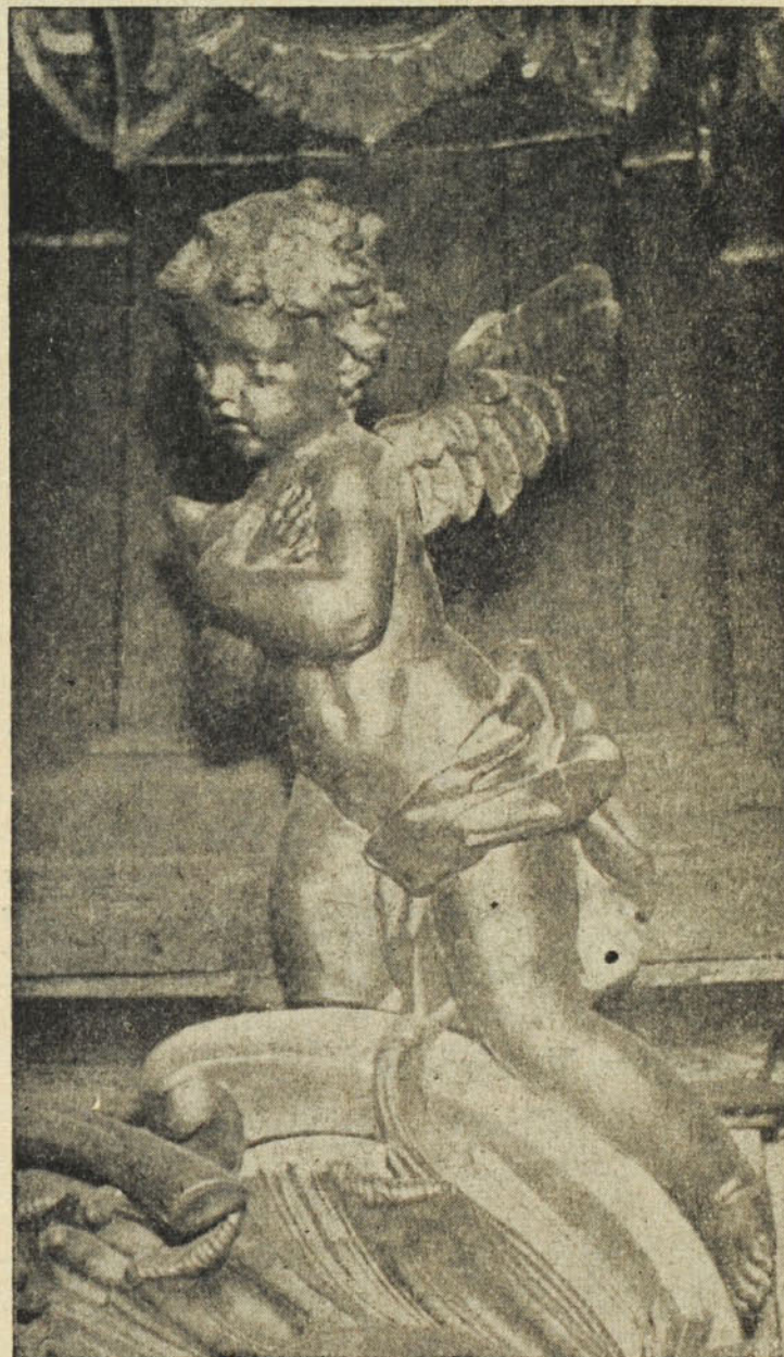
Főoltárrészlet egy régi pálos templomból (Pápa, XVIII. sz.)

Remete Szent Antal pedig pálosrendi ruhában, fehér csuklyával, skapuláréval és köpennyel. Ez a váratlan, gazdag lelet ösztönöz arra, hogy a különböző plébániákon esetleg szélszórt egyházművészeti, de nemzeti szempontból is felbecsülhetetlen értékű adatokat rendszeresen gyűjtsük. A megértő felkarolás reményében kérjük hát a Főtisztelendő Papság támogatását.