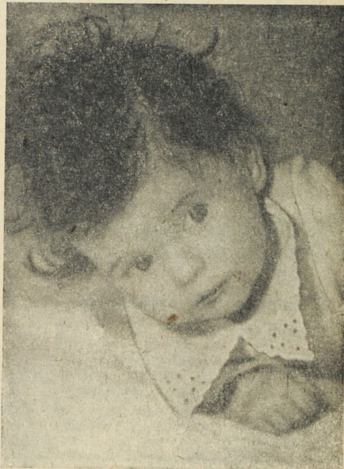
A kis kíváncsi

A pusztító török had, mintha egy ember lett volna, csákánnyal, kampóval törni-zúzni kezdett. Ledöntöttek egy szobrokat. És kacagtak,