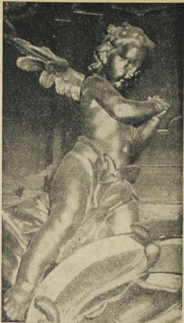
Főoltár részlet egy régi pálos templomból. (Pápa, XVIII. sz.)

1809-ben Károly főherceg lakott a kolostorban. A franciák elleni háborúban hadseregével