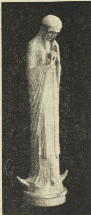
D. Lenz O. S. B.: Virgo mystica.

Igen, egy volt a Kenyerük, egy volt a hitük, egy volt a szívük-lelkük akkor a keresztényeknek! Az ősegyház krónikása nem fogy ki a dicséretből, mennyire szerették egymást s mennyire szerették Krisztust, Akinek parancsa szerint csakugyan arról ismerték meg akkor az emberek, hogy az ő tanítványai, mivel szerették egymást: «A hívők sokaságának pedig szíve-lélke egy volt s egyikük sem mond vala semmit sem a magáénak a birtokából, hanem