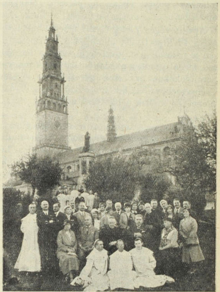
Magyar zarándokok Csensztochovában a pálosok hazajövele alkalmából 1934 májusában. Hátterben a világhírű búcsújáráhely temploma s tornya.