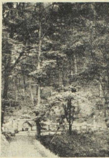
Május a Bükkben.