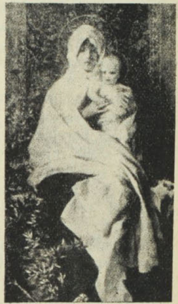
Barabino: Regina Pacis.

Szóval megérkeztünk a királyi palota elé. Kedves Gyermek! Szedjétek elő egész képzelőtehetségeket, hogy fogalmatok legyen e palota szépségéről és pompájáról. Tiszta üveg és színarany a fala,