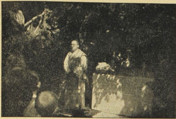
Tábori mise a Báthory barlangnál.