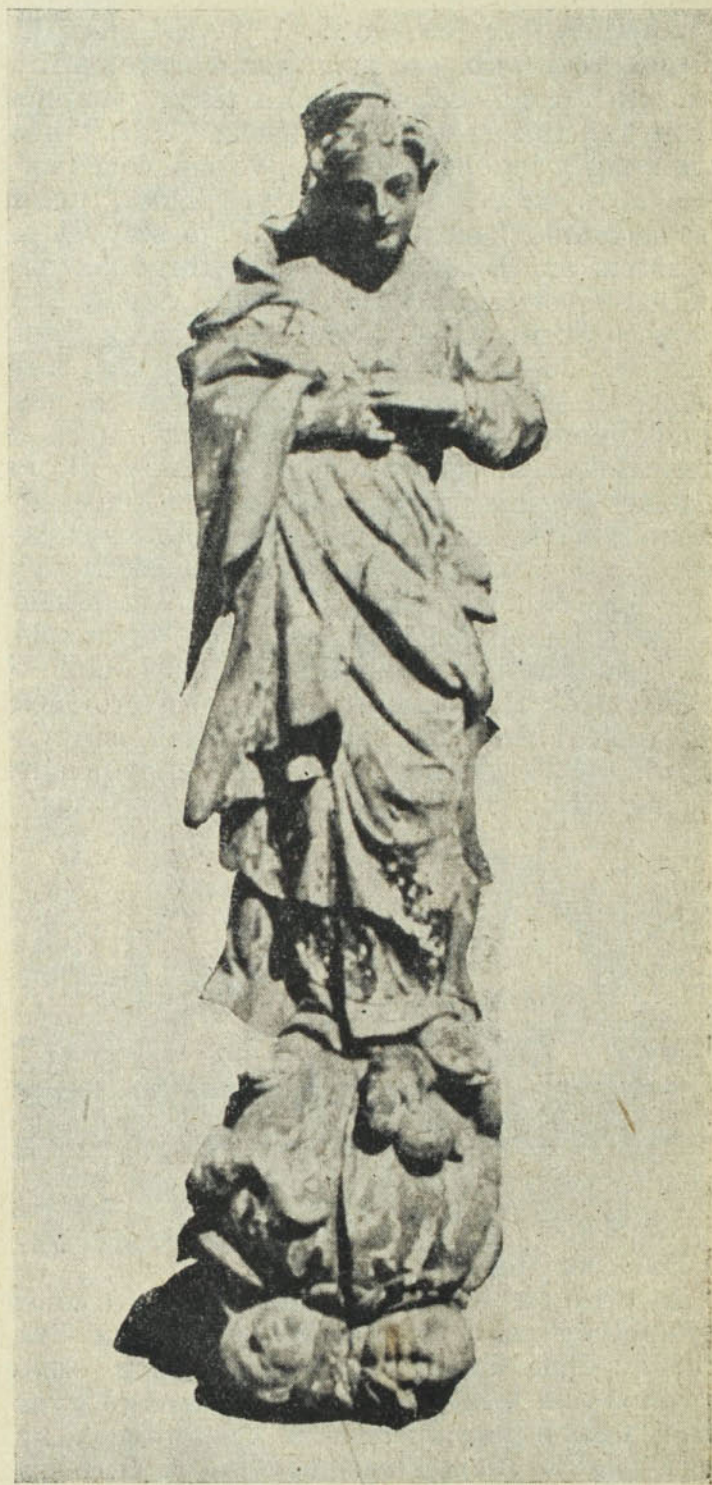
A Szeplőtelen sajóládi szobra.

lyosón és a lépcsőházban állnak szép rendben, gondosan tartva régi pálos oltáraink töredékei, amint azokról még beszámolunk. A templom Sárlos Boldogasszonynak dedikált főoltára új. A szószék, mint mondottuk,