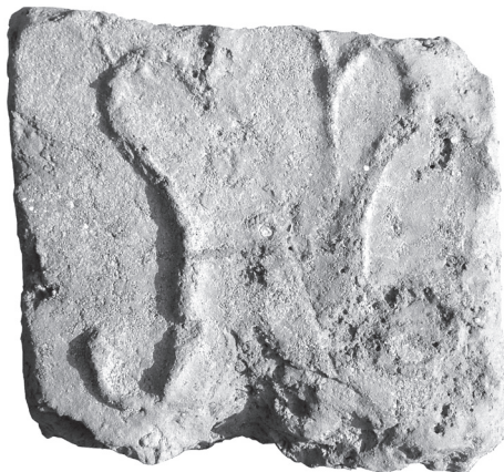
A mindszenti téglá az Anjou-liliommal

Az egykori romhoz vezető erdei úton ma is fellelhetők a téglaszállítások nyomai, a monostorból származó, sötétvörösre égetett téglatörmelékek. E sorok írója 2010 augusztusában talált közöttük egy tégladarabot, melyen jól kivehető az Anjou-liliom egyszerű ábrázolásának