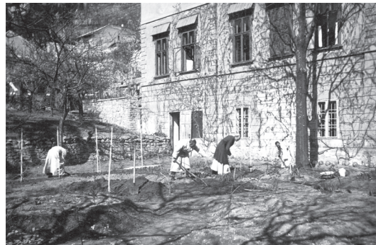
Kerti munka a pécsi rendházban (1943)