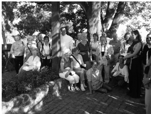
Zarándokok