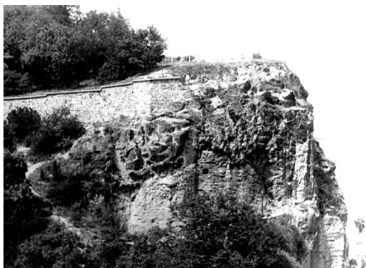
A befalazott Sziklatemplom 1960-ban

1993-ban a budapesti EXPO előkészítésének utolsó szakaszában, a Magyar Karszt- és Barlangkutató Társulat (MKBT) vetette fel, hogy az üreget idegenforgalmilag kellene hasznosítani. Terveik szerint az üregben a barlangnak és képződményeinek a bemutatásán kívül egy – a budai termálkarszt barlangjait bemutató – kiállítást és az északkeleti mesterséges tárószakaszban kis csoportok fogadására alkalmas előadótermet is szeretnének volna berendezni. A beruházási költségek csökkentését jelentette vol-