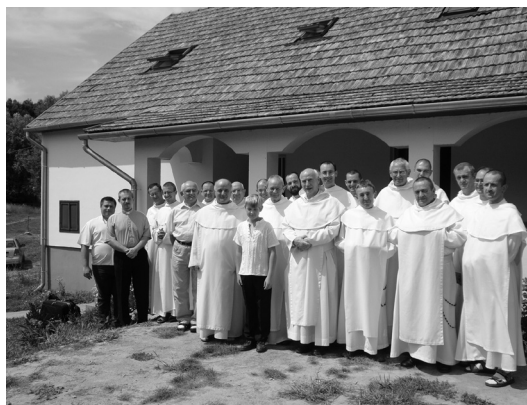
A pálosok lelkigyakorlata – 2012 nyara, Gálosfa

A Sziklatemplom másik meghatározó személyisé-