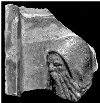
Kályhacsempe töredéke Budaszentlőrincről, az egykori pálos főmonostorból (Budapesti Történeti Múzeum)

A vizsgált korszak sok és sokféle, ám távolról sem a teljesség igényével bemutatott adatát átfutva az az érzésünk, hogy nem tévedett Gyöngyösi Gergely, amikor a Mohács előtti évekből a 15. századra visszapillantva megállapította, hogy az egészséges rendi spiritualitás az anyagiakban is egyfajta jólétet eredményezett. A szerzetesség történetében ez a minduntalan visszatérő toposz komoly igazságtartalommal rendelkezik: a történelem folyamán mindig voltak, akik a kevéssel is megelégedve boldogan éltek és dolgoztak az evangéliumok szellemében.