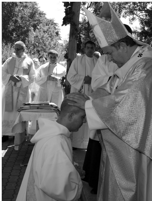
A papszentelés szertartása – 2012 nyara, Pálósszentkút

2004-ben elkezdhettem teológiai tanulmányaimat a Pécsi Püspöki Hittu-