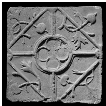
Padlólap Budaszentlőrincről, az egykori pálos főmonostorból (Budapesti Történeti Múzeum)

A rector chori feladata volt mind a kóruskönyvek, mind pedig az asztali olvasmányok könyveinek szövegtszűrésére vigyázni. Szigorú előírás volt még, hogy saját elhatározásból nem lehetett javítani a szövegeken, ehhez feltétlenül az illetékes superior engedélye kellett. Ellenben az újonnan elkészült liturgikus könyveket súlyosabb bűn terhe alatt javítás nélkül nem volt szabad használatba venni, érthető óvatosság az egységesség megőrzése érdekében. A zenetörténeti kutatások szerint a középkorban saját pálos hang-