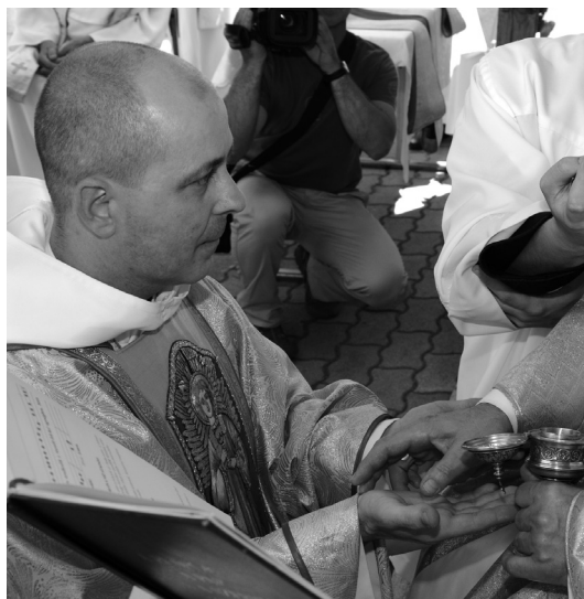
A papszentelés szertartása – a kezek krizmával való megkenése

mutatása volt a szülőfalumban Óváron, ahol a falu apraja-nagyja jelen volt. Ez nagy örömmel töltött el. Ezt követően vonatos zárándoklatra indultunk Lengyelországba, Częstochowába. Itt egy újabb érzés ragadott meg. Az ünnep és öröm együttes megélése sok hívő emberrel. Isten szeretetének öröme töltött el. Papként ezt az örömteli reményt kell majd az emberek szíve felé közvetítenem a mindennapokban. E nagy események sorozata után kerültem új szolgálati helyemre, Márianosztrára, ahol a hívek régi ismerősként nagy szeretettel fogadtak. Innen indultam, itt kezddhetem meg szerzetesi életemet, és most a gondviselő Isten kegyelméből újra visszakerülhettem erre a kegyhelyre.