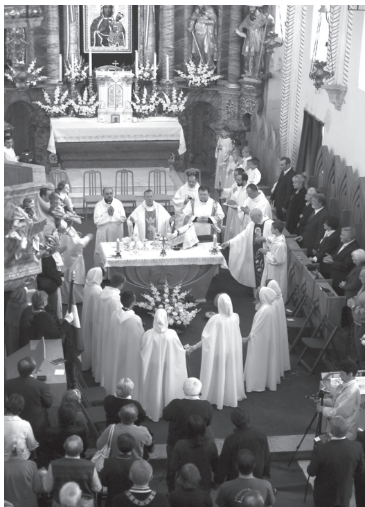
Búcsúúti szentmise Máriastráza