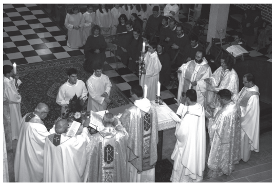
A Pálos templom búcsúmiséje