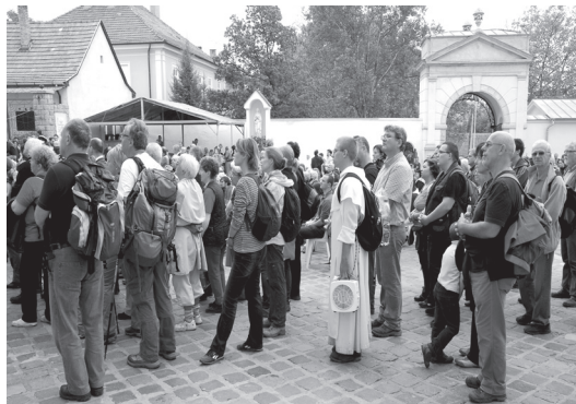
Érkezés Márianosztrára

A 2012. október 5 és 7. között megrendezett „Pálos 70” zarándoklatnak és teljesítménytúrának összesen 617 regisztrált résztvevője volt. Közülük 363 előzetesen nevezett be, és 254 zarándok vasárnap reggel Szobnál kapcsolódott a lelkes menethez. A 2011-es 519 (259 nevezett, 260 szobi zarándok) főhöz képest ez 18,89%-os növekedés.