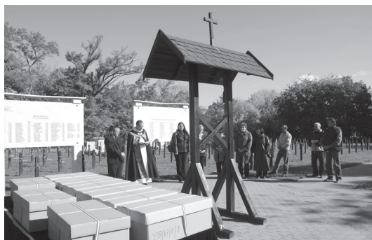
A kibantoltak újratemetése 2012-ben

Az 1951-ben, koncepciós perben ártatlanul elítélt, majd kivégzett P. Vezér Ferenc pálos szerzetes exhumálása és azonosítási folyamata során más kivégzettek földi maradványait is kiemelték. (Mivel a politikai okokból kivégzettek temetésével kapcsolatos adatokat annak idején szándékosan meghamisították, illetve a kivégzetteket sokszor álneveken temették el, e nélkül nem lehetett teljes pontossággal azonosítani P. Vezér Ferenc földi maradványait.) Az exhumálást követően a tudományos módszerekkel történt azonosítás után 2012. április 30-án a Magyar Pálos Rend végtisztességben részesítette Ferenc atyát egykori legfontosabb papi szolgálati helyén, Petőfiszállás-Pálosszentkúton.