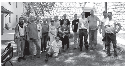
A motorosok csoportja a Délvidéken